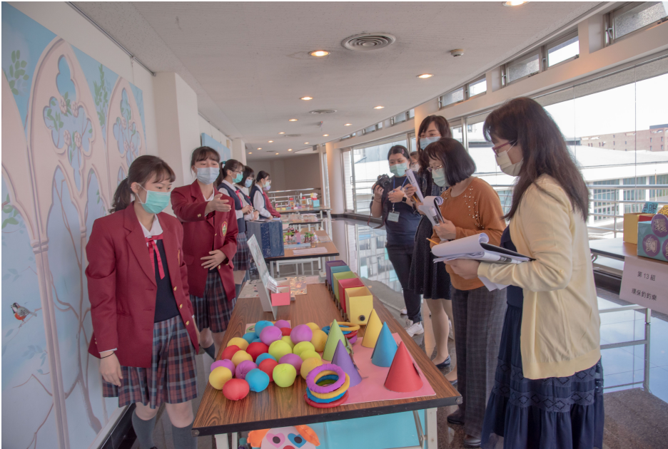
▲ 參賽同學用心跟評審解說自己的作品

兒童教玩具競賽主要激勵學生應用所學，設計製作具有原創性、實用且富有教育意義的教玩具，期能提升學生實務專題能力，每位參賽者更要說學逗唱，透過口說、表演、操作等方式，來為自己設計的教具推廣行銷以爭取最佳成績，每年的作品創意都讓人驚喜連連，更帶來許多啟發性。