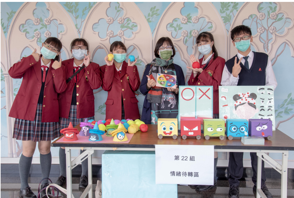
▲ 嘉藥舉辦兒童教玩具創意比賽吸引眾多高中職學參加

活動當日也舉辦「當生活遇上戲劇」研習，讓參賽學生能藉由研習中汲取多元靈感，啟發美感素養及專業實務能力，進而運用所學，與幼教現場密切接軌。