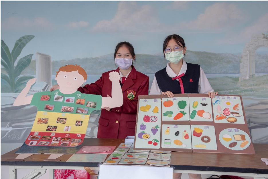
▲ 色彩豐富變化多元的成品吸引人目光

嘉南藥理大學嬰幼兒保育系於12月18日舉辦第12屆「全國兒童教玩具競賽暨應用研習」活動，該競賽研習活動是高中職及五專學生展現創意、表現自己的重要發表平台，每年皆有來自各地高中職與五專學生齊聚切磋，相互交流，今年更吸引了近50組，超過百人參加，入圍組數較多的學校，甚至包遊覽車前來，可見對該競賽的重視程度。