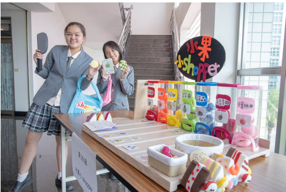
▲ 高中職同學用心創作展創意

嘉南藥理大學嬰幼兒保育系於12月18日舉辦第12屆「全國兒童教玩具競賽暨應用研習」活動，該競賽研習活動是高中職及五專學生展現創意、表現自己的重要發表平台，每年皆有來自各地高中職與五專學生齊聚切磋，相互交流，今年更吸引了近50組，超過百人參加，入圍組數較多的學校，甚至包遊覽車前來，可見對該競賽的重視程度。