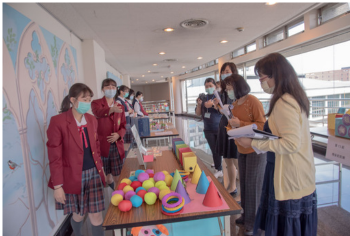
參賽同學用心跟評審解說自己的作品