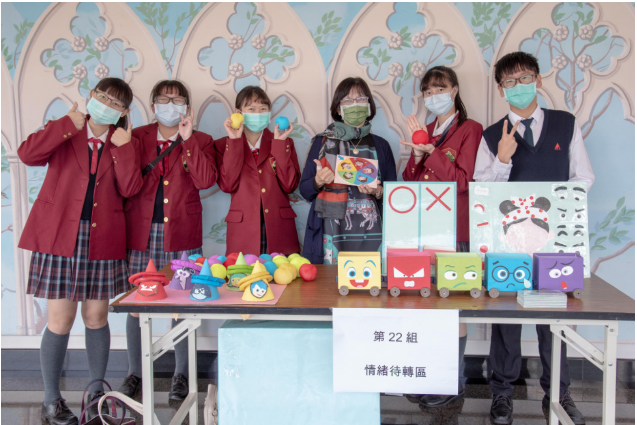
▲嘉藥舉辦兒童教玩具創意比賽吸引眾多高中職學參加