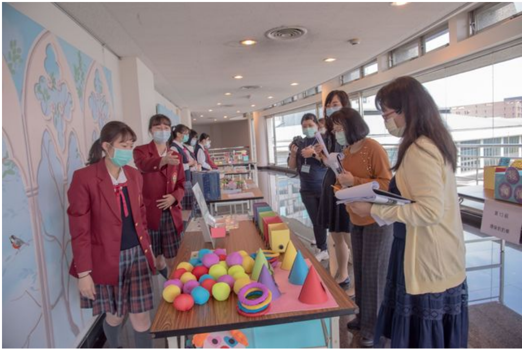
參賽同學用心跟評審解說自己的作品。

嘉南藥理大學嬰幼兒保育系於12月18日舉辦第12屆「全國兒童教玩具競賽暨應用研習」活動，該競賽研習活動是高中職及五專學生展現創意、表現自己的重要發表平台，每年皆有來自各地高中職與五專學生齊聚切磋，相互交流，今年更吸引了近50組，超過百人參加，入圍組數較多的學校，甚至包遊覽車前來，可見對該競賽的重視程度。