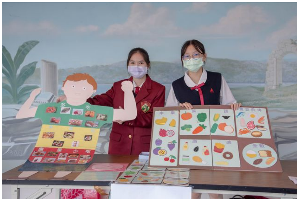
色彩豐富變化多元的成品吸引人目光。