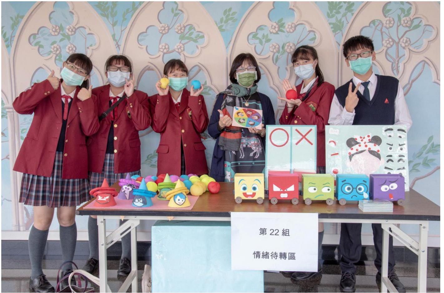
嘉藥舉辦兒童教玩具創意比賽吸引眾多高中職學參加。