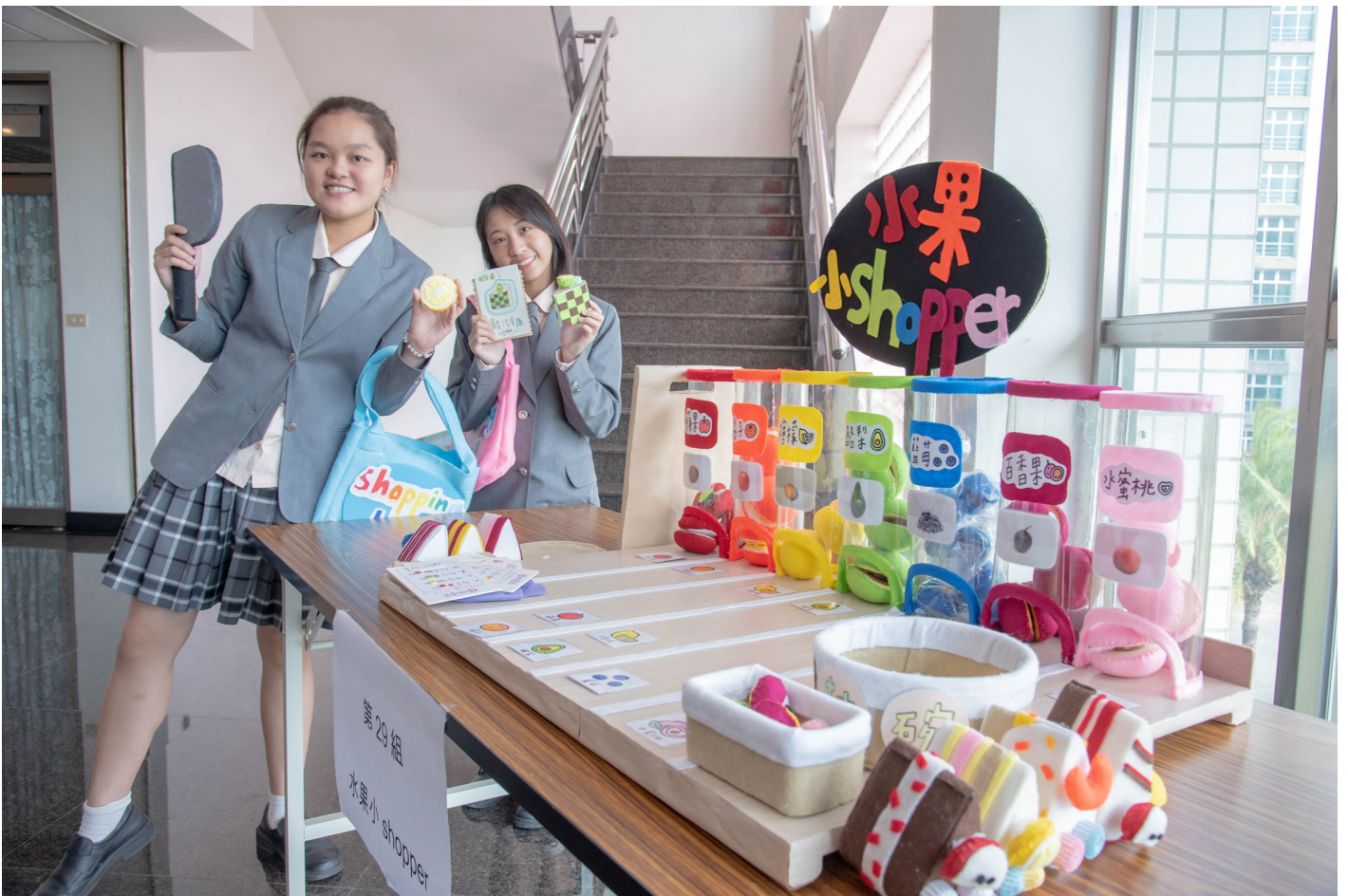
圖說：嘉藥舉辦兒童教玩具創意比賽吸引眾多高中職學參加。

兒童教玩具競賽主要激勵學生應用所學，設計製作具有原創性、實用且富有教育意義的教玩具，以提升學生實務專題能力，每位參賽者更要說學逗唱，透過口說、表演、操作等方式，來為自己設計的教具推廣行銷以爭取最佳成績，每年的作品創意都讓人驚喜連連，更帶來許多啟發性。活動同時也舉辦「當生活遇上戲劇」研習，讓參賽學生能藉由研習中汲取多元靈感，啟發美感素養及專業實務能力。