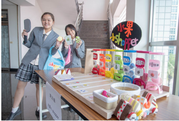
高中職同學用心創作展創意