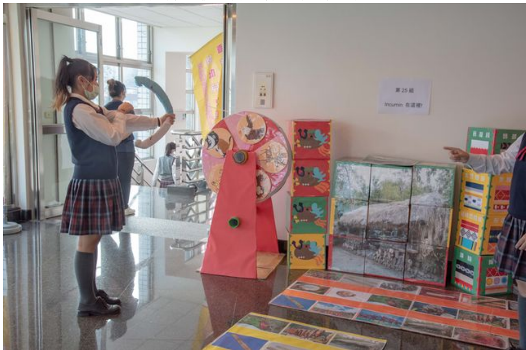
樹德家商同學以原住民文化為主創作出教玩具。