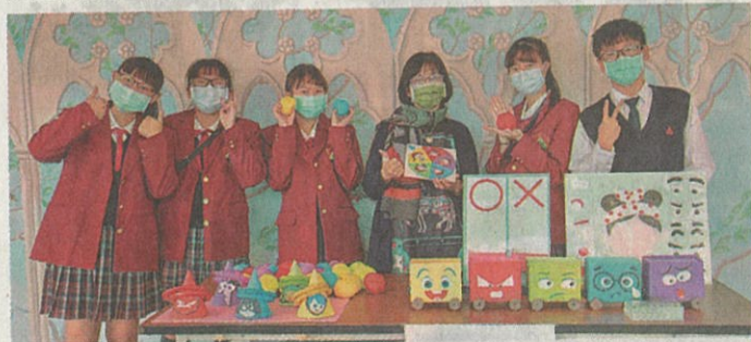
嘉藥舉辦兒童教玩具創意比賽吸引眾多高中職學生參加。