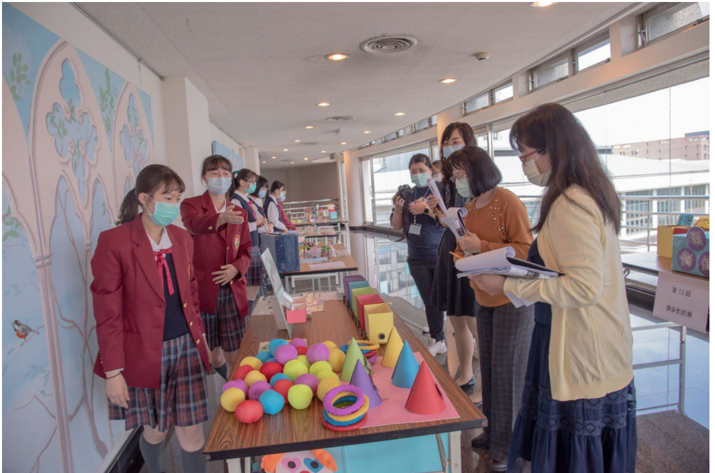
參賽同學用心跟評審解說自己的作品。