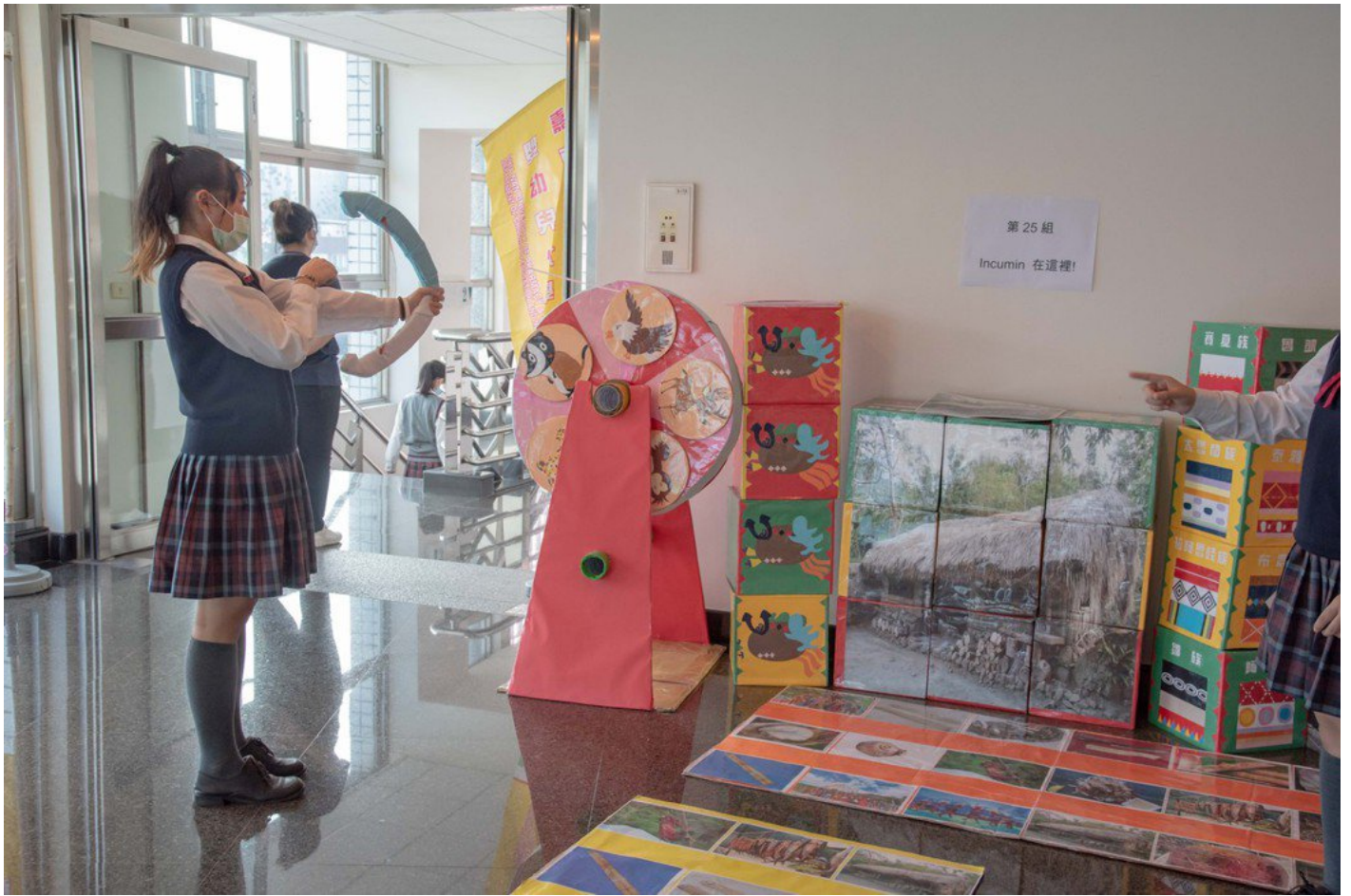
樹德家商同學以原住民文化為主創作出教玩具。