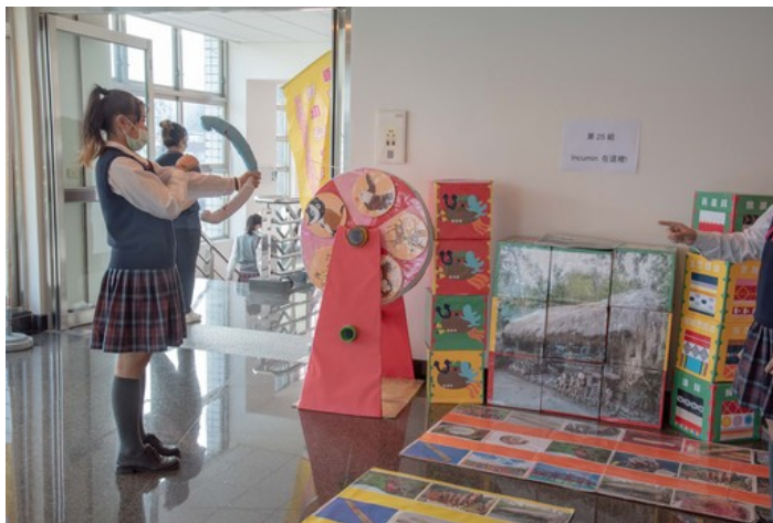
樹德家商同學以原住民文化為主創作出教玩具