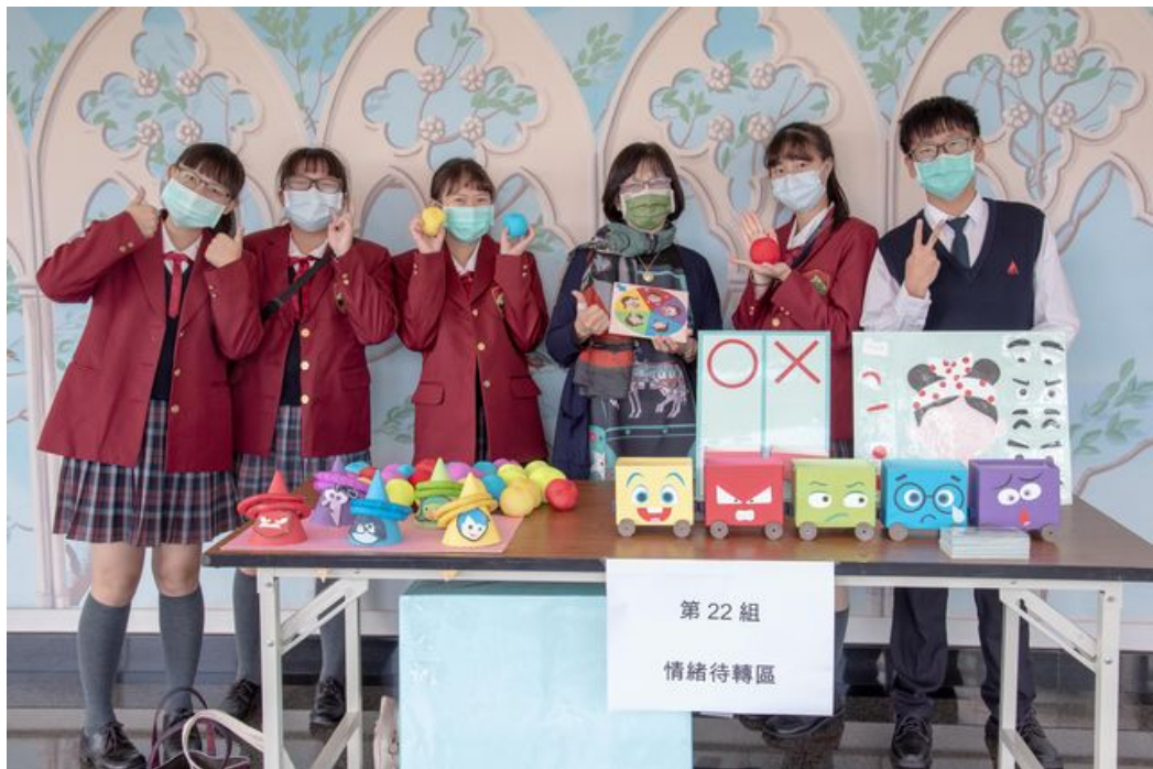
嘉藥舉辦兒童教玩具創意比賽吸引眾多高中職學參加。

http://www.cntimes.info 2020-12-18 19:31:41