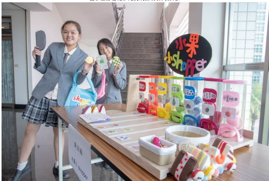
高中職同學用心創作展創意。