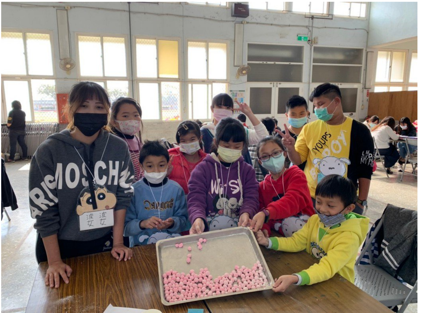
北門國小學童開心體驗製作小湯圓。