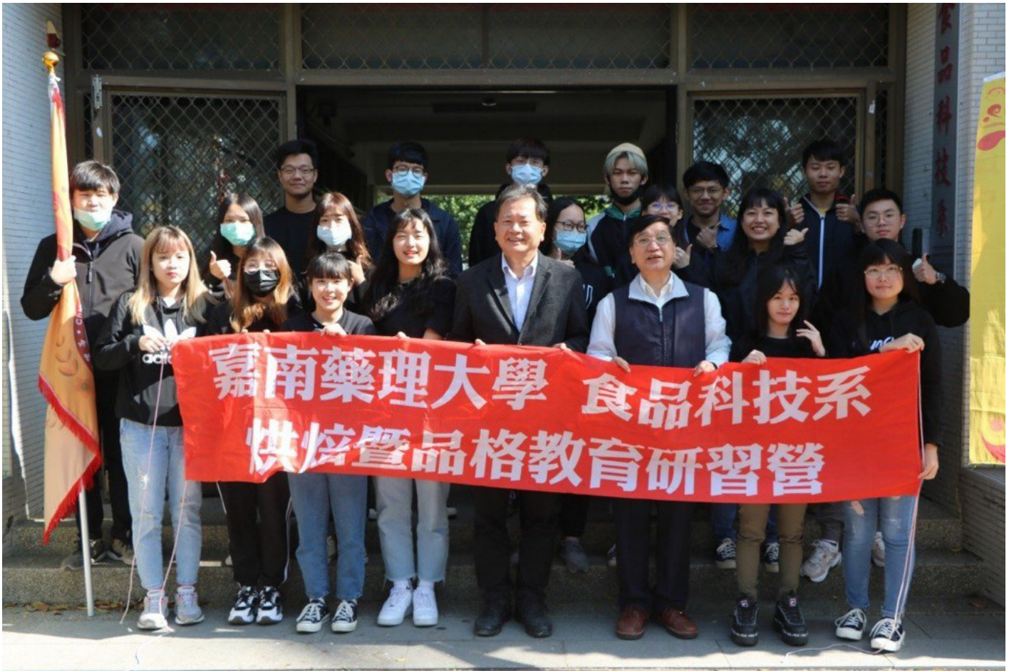
嘉藥食品系組對至北門國小舉辦烘焙品格教育營。嘉藥 / 提供