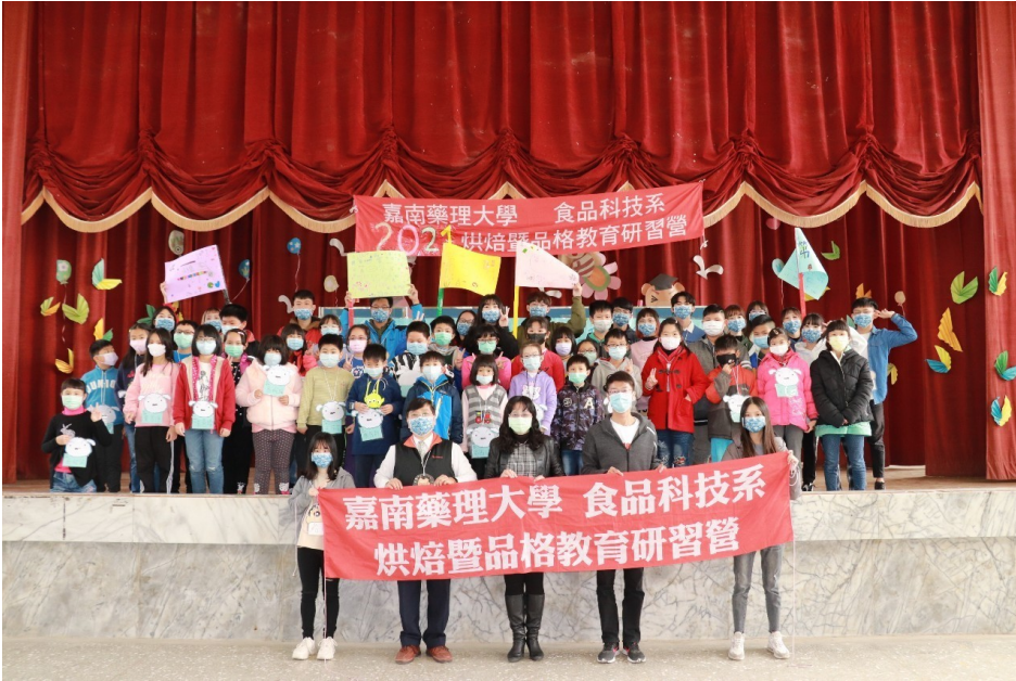
▲ 嘉藥烘焙教育品格營讓參加的學童收穫滿滿

營，看到小朋友認真學習精神及享受玩遊戲的樣子，讓我們覺得辛苦規劃這場活動，來增加小朋友課外技能及經驗，而且能和一群志同道合的夥伴為共同目標邁進，感覺真的很棒！