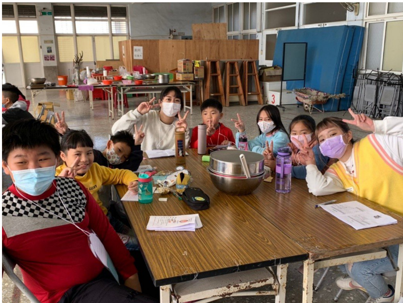
北門國小的小朋友在嘉藥學長姊帶領下製作烘焙食品。