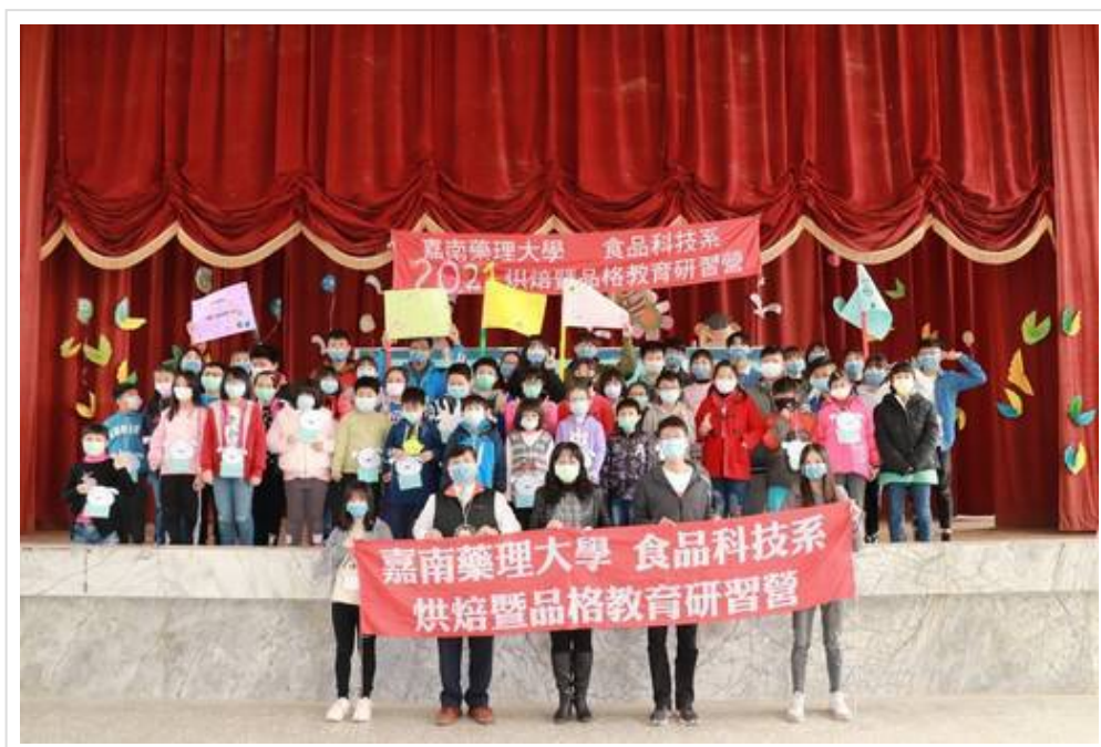
▲ 嘉藥烘焙教育品格營讓參加的學童收穫滿滿