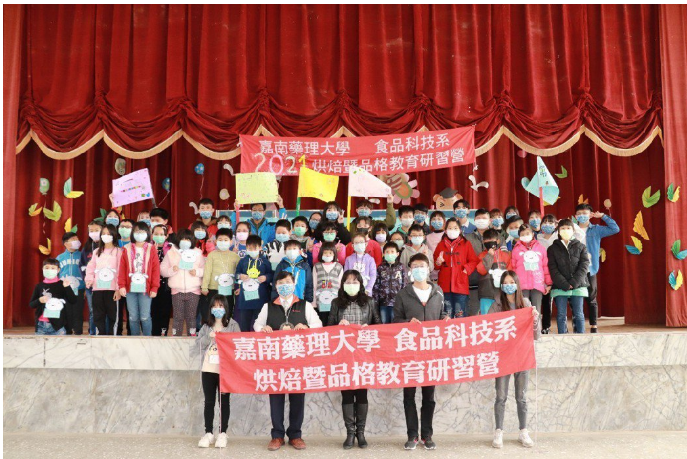
嘉藥烘焙教育品格營讓參加的學童收穫滿滿。