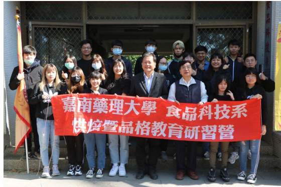
嘉藥食品系組對至北門國小舉辦烘焙品格教育營。

【記者孫宜秋 / 南市報導】嘉南藥理大學食品科技系日前帶隊至台南市北門區北門國民小學舉辦第十一屆「2021品格暨烘焙教育研習營」活動，為了能將烘焙技術完整傳授給小朋友，烘焙教育研習營特別以三年期來規劃，強調「學中做、做中學」的理念來實際執行多元化教育技能，傳