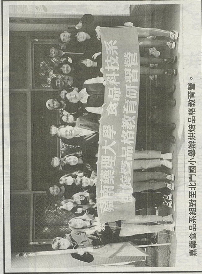
嘉藥品系組對至北門國小舉辦烘焙品格教育營。

烘焙技術外，也注重小朋友們的品格教育，烘焙教學中以杏仁瓦片、巧克力米小西餅、小湯圓及蔓越莓優格瑪芬蛋糕及香草卡士達海綿蛋糕等為主；同時搭配各種食品安全知識，讓小朋友在享受美食之餘也能跟家人分享學習到的知識。