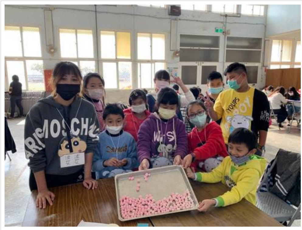
▲北門國小學童開心體驗製作小湯圓

(中央社訊息服務20210121 09:18:20)嘉南藥理大學食品科技系日前帶隊至台南市北門區北門國民小學舉辦第十一屆「2021品格暨烘焙教育研習營」活動，為了能將烘焙技術完整傳授給小朋友，烘焙教育研習營特別以三年期來規劃，強調「學中做、做中學」的理念來實際執行多元化教育技能，傳授實作經驗，因此獲得台灣華山聖光慈善會及華山興企業有限公司都在贊助，今年來到計畫第三年，全體參加的北門國小學童、師長都滿載而歸。