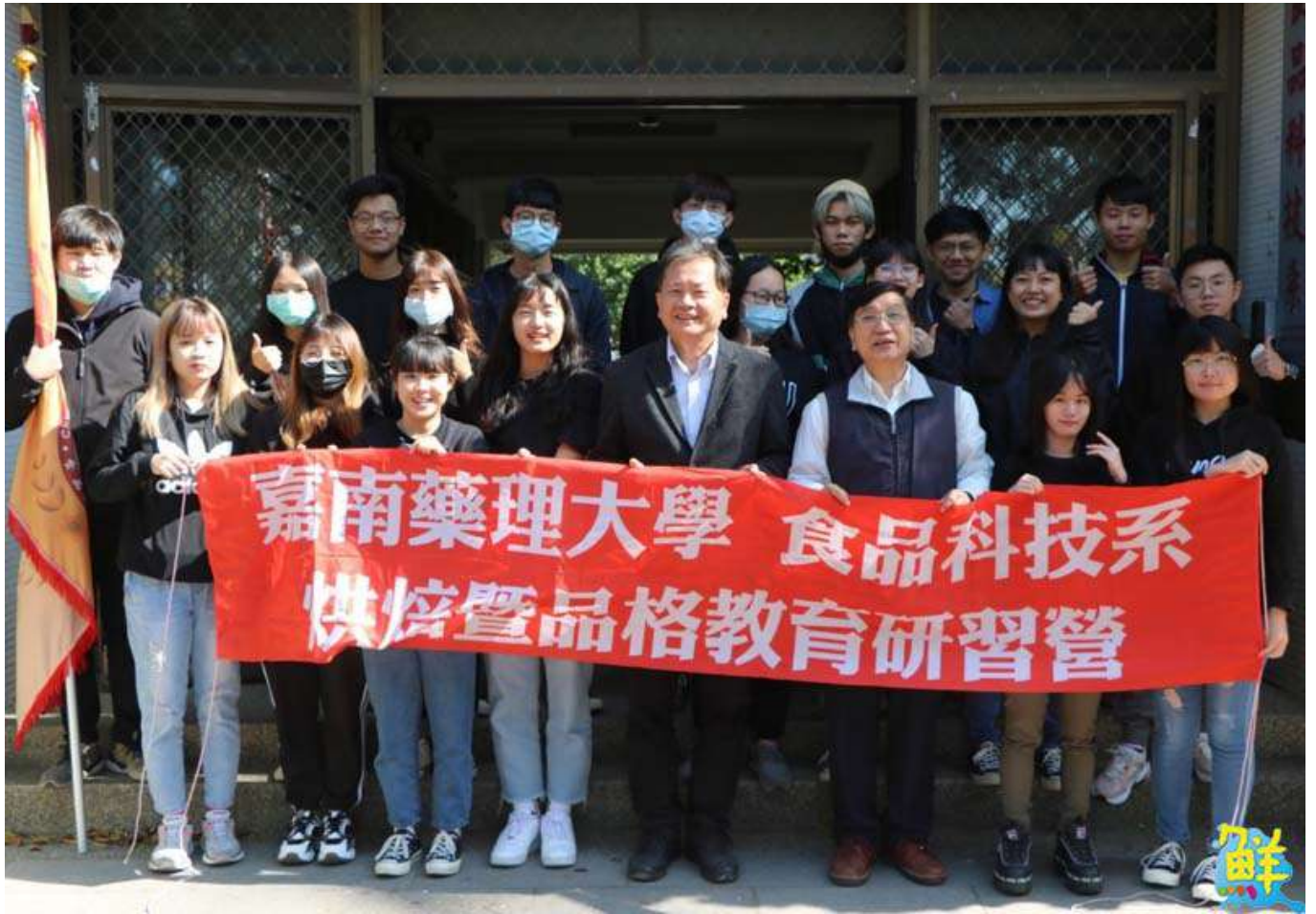
▲嘉藥食品系組對至北門國小舉辦烘焙品格教育營，用自己的專業指導小朋友們。