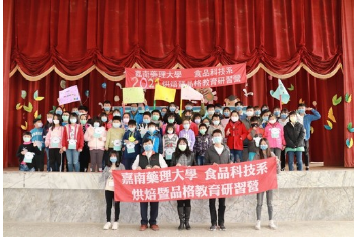
嘉藥烘焙教育品格營讓參加的學童收穫滿滿