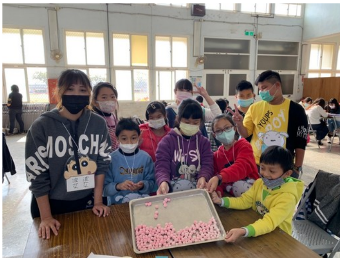
北門國小學童開心體驗製作小湯圓