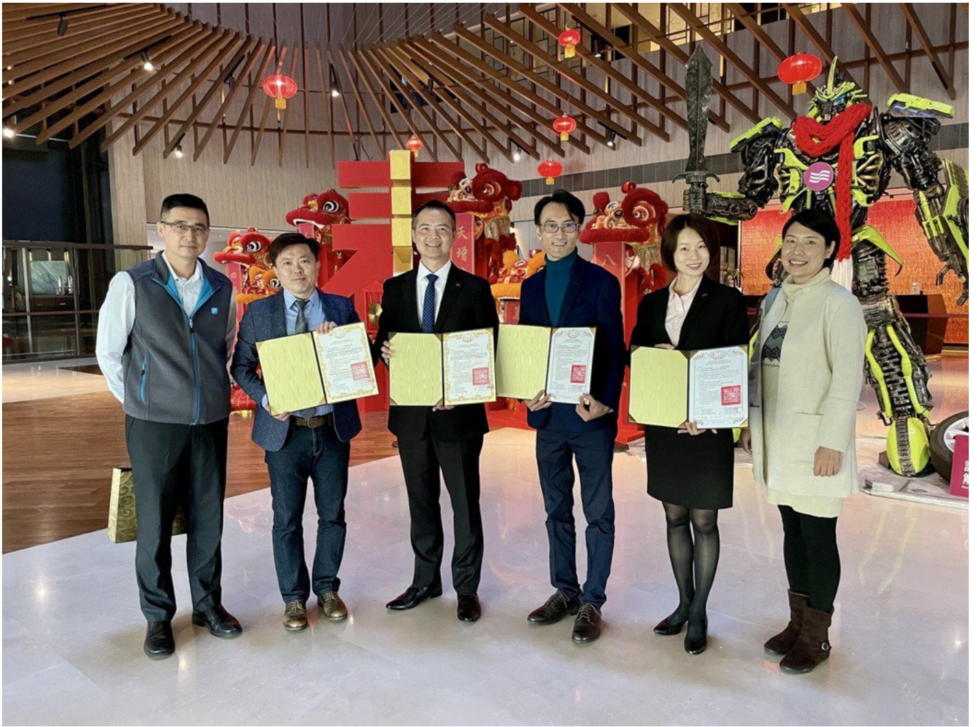
嘉藥觀光與休閒系與大員皇冠飯店簽訂產學合作協定，結合彼此資源，共創多贏。