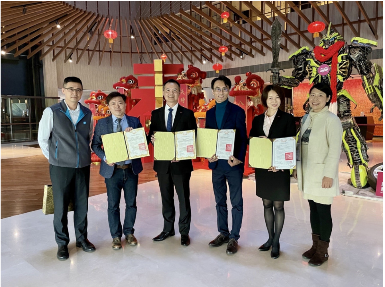
▲嘉藥觀光與休閒系與大員皇冠飯店簽訂產學合作協定，結合彼此資源，共創多贏