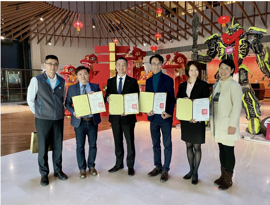
▲ 嘉藥觀光與休閒系與大員皇冠飯店簽訂產學合作協定，結合彼此資源，共創多贏

台南市近年來在中央政府政策加持下已帶動高科技等各產業蓬勃發展，不可忽略的是商務或觀光人士流入，對台南市休閒觀光產業產生正面影響及經濟效益，台灣在這次COVID-19防疫成績斐然，受到全球矚目，預期將有利後疫情時代台灣休閒觀光旅遊爆發性發展。因此，嘉藥休閒系與觀光系攜手合作，積極爭取優質合作廠商並保持深厚緊密連結關係，共同進行人才培育深耕佈局，為協助學生拓展未來就業發展而努力。