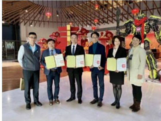
嘉藥觀光與休閒系與大員皇冠飯店簽訂產學合作協定，結合彼此資源，共創多贏。

【記者孫宜秋 / 南市報導】嘉南藥理大學觀光事業管理系和休閒保健管理系攜手爭取產學合作，陸續與全球知名酒店集團臺南晶英及洲際酒店集團（IHG）旗下台南大員皇冠假日酒店簽訂產學合作協定，雙方未來在學生實習就業、教師實務研習、業師協同教學、產學計畫等長期人才培育策略聯盟合作機制，進行多元交流與緊密