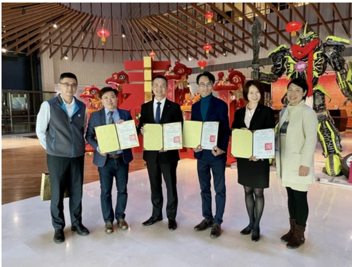
嘉藥觀光與休閒系與大員皇冠飯店簽訂產學合作協定，結合彼此資源，共創多贏