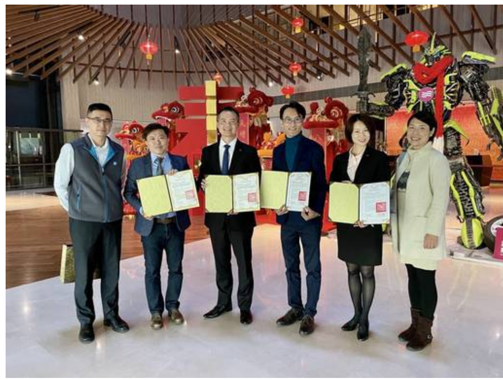
▲ 嘉藥觀光與休閒系與大員皇冠飯店簽訂產學合作協定，結合彼此資源，共創多贏