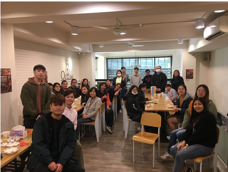
▲ 嘉藥舉辦外籍生春節聚餐活動，讓外籍生感受台灣過節氣氛

而境外學生台灣生態文化參訪則選定學生喜愛的墾丁地區，22位外籍生與老師一早就懷抱輕鬆心情出發，前往藍天碧海白沙灣、鹿境梅花鹿生態園區、國立海洋生物博物館參觀，除了享受當地美食外，也體驗餵食梅花鹿、參觀海生館各種珍奇生物，還一同到著名的福安宮祈福，行程豐富也有趣參加的師生都滿載而歸，留下美好的回憶。