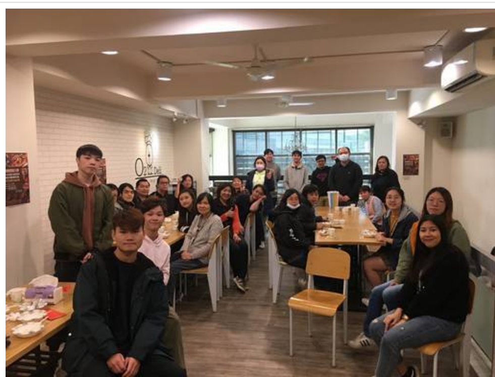
▲嘉藥舉辦外籍生春節聚餐活動，讓外籍生感受台灣過節氣氛

(中央社訊息服務20210129 10:19:25)新冠疫情越演越烈，台灣雖有零星本土病例但相對安全，許多在台留學外籍生考量母國疫情後，選擇留在台灣過寒假，嘉南藥理大學為了緩解留台外籍生的思鄉之情，特別在期末及寒假初辦理外籍生聯歡餐會及台灣生態文化參訪，不