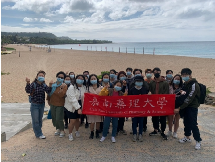
溫暖的南台灣讓嘉藥外籍生身心都放鬆