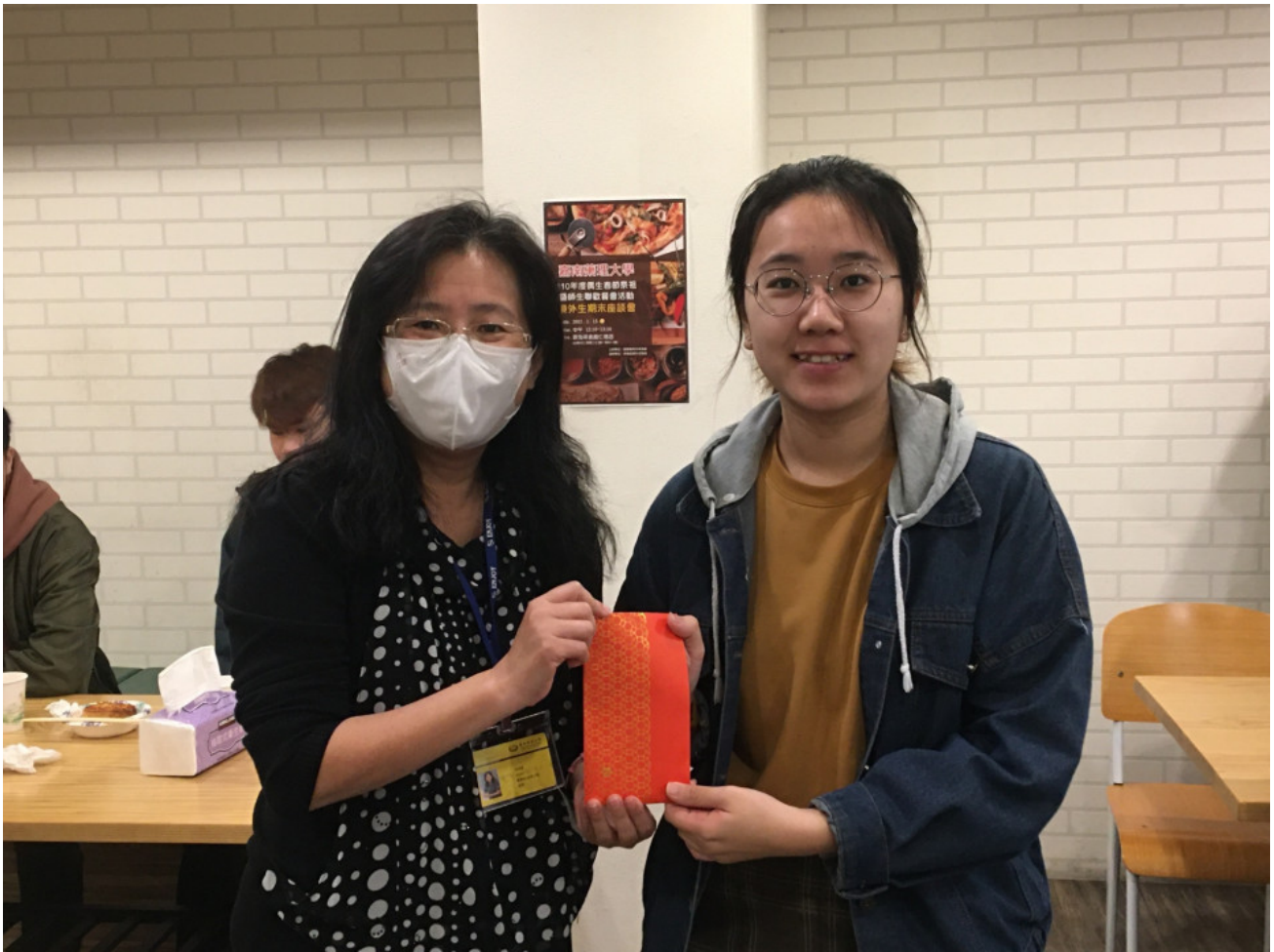
疫情阻礙歸鄉路 嘉藥外籍生在台聯歡 記者 蔡宗武