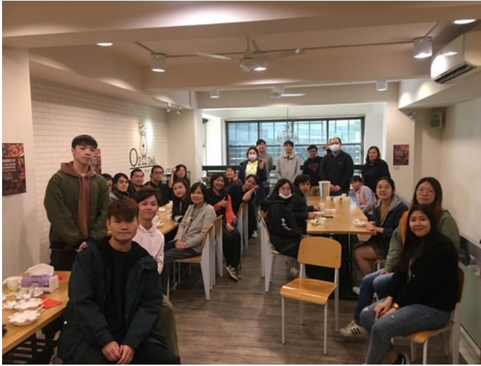
嘉藥舉辦外籍生春節聚餐活動，讓外籍生感受台灣過節氣氛

而境外學生台灣生態文化參訪則選定學生喜愛的墾丁地區，22位外籍生與老師一早就懷抱輕鬆心情出發，前往藍天碧海白沙灣、鹿境梅花鹿生態園區、國立海洋生物博物館參觀，除了享受當地美食外，也體驗餵食梅花鹿、參觀海生館各種珍奇生物，還一同到著名的福安宮祈福，行程豐富也有趣參加的師生都滿載而歸，留下美好的回憶。