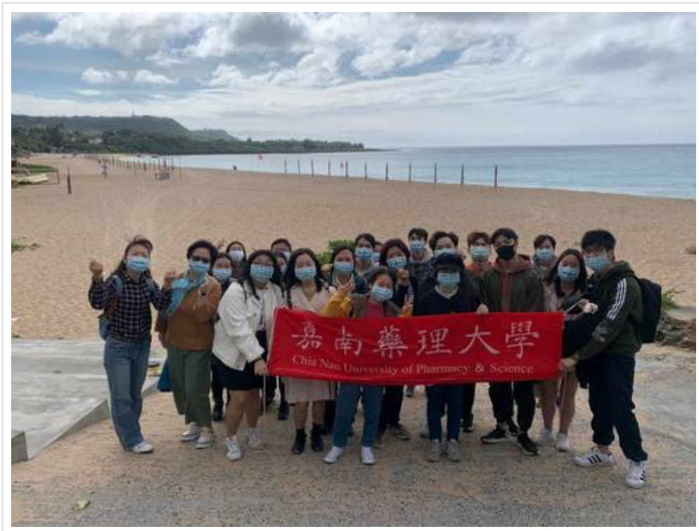
▲ 溫暖的南台灣讓嘉藥外籍生身心都放鬆