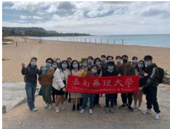
溫暖的南台灣讓外籍生身心都放鬆。

【記者孫宜秋 / 南市報導】新冠疫情越演越烈，台灣雖有零星本土病例但相對安全，許多在台留學外籍生考量母國疫情後，選擇留在台灣過寒假，嘉南藥理大學為了緩解留台外籍生的思鄉之情，特別在期末及寒假初辦理外籍生聯歡餐會及台灣生態文化參訪，不僅要讓外籍生能感受台灣學校的溫情，也希望增加外籍學生們之間的認識與連結，在這疫情緊繃之際，增添一絲溫暖與趣味。