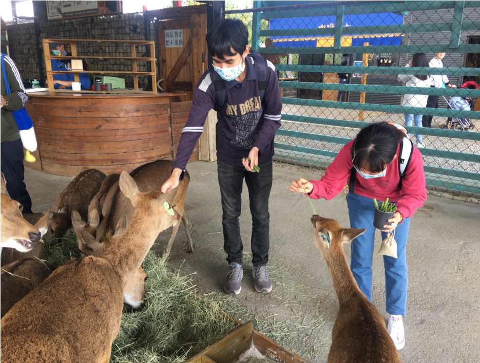
▲ 鹿境梅花鹿生態園區讓嘉藥外籍生有完全不同的體驗

新冠疫情越演越烈，台灣雖有零星本土病例但相對安全，許多在台留學外籍生考量母國疫情後，選擇留在台灣過寒假，嘉南藥理大學為了緩解留台外籍生的思鄉之情，特別在期末及寒假初辦理外籍生聯歡餐會及台灣生態文化參訪，不僅要讓外籍生能感受台灣學校的溫情，也希望增加外籍學生們之間的認識與連結，在這疫情緊繃之際，增添一絲溫暖與趣味。