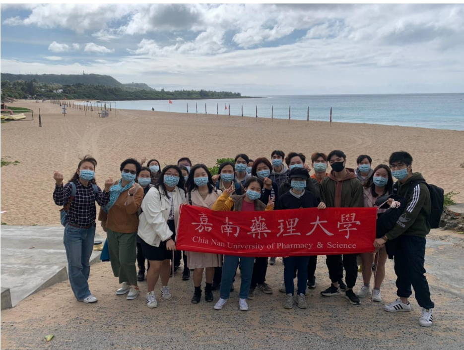
▲ 溫暖的南台灣讓外籍生身心都放鬆

新冠疫情越演越烈，台灣雖有零星本土病例但相對安全，許多在台留學外籍生考量母國疫情後，選擇留在台灣過寒假，嘉南藥理大學為了緩解留台外籍生的思鄉之情，特別在期末及寒假初辦理外籍生聯歡餐會及台灣生態文化參訪，不僅要讓外籍生能感受台灣學校的溫情，也希望增加外籍學生們之間的認識與連結，在這疫情緊繃之際，增添一絲溫暖與趣味。