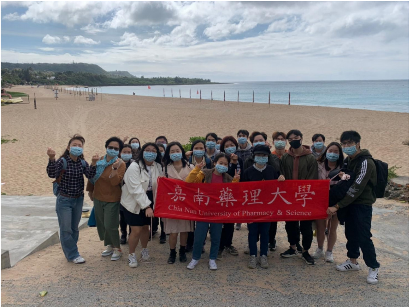
▲溫暖的南台灣讓外籍生身心都放鬆