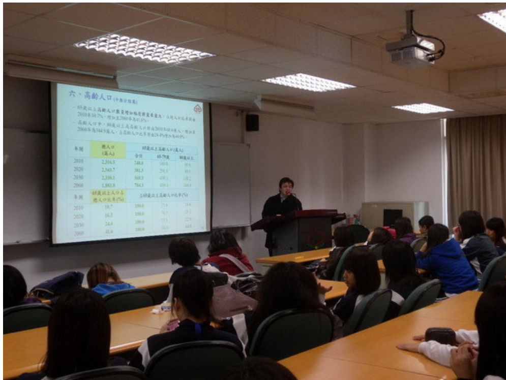
▲ 專案製作能力培訓課程。