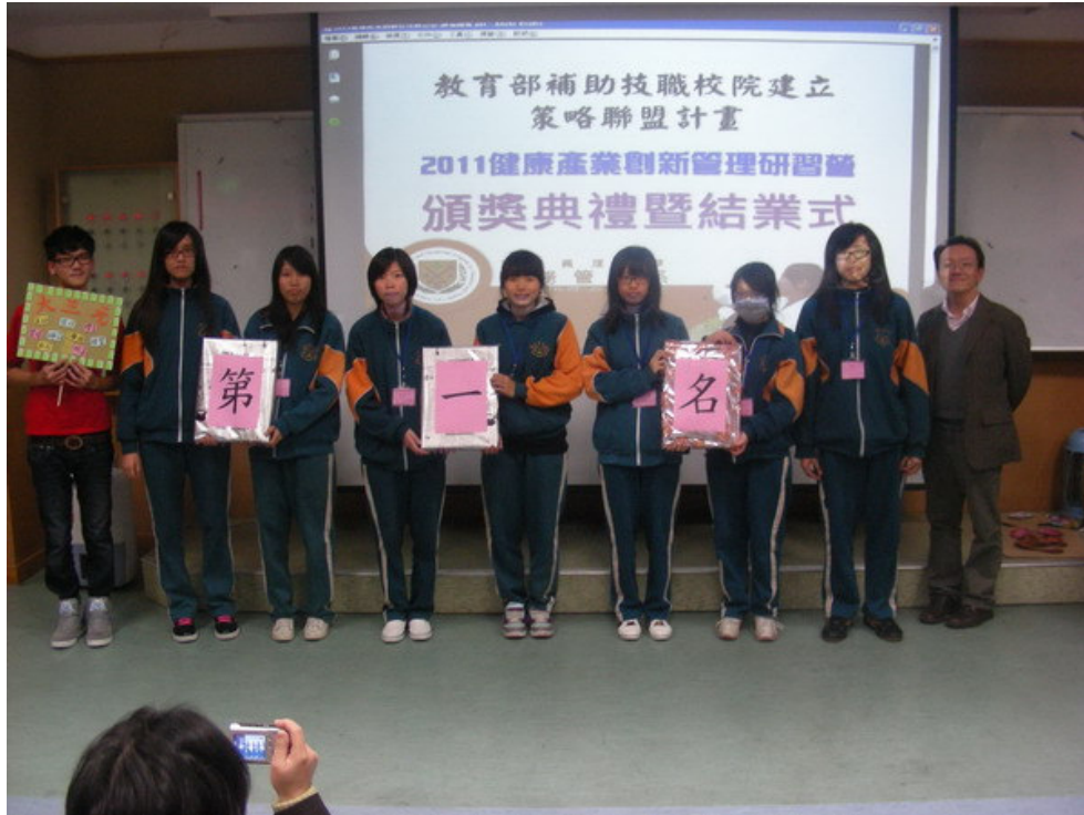
▲ 創意競賽頒獎與優勝隊伍。