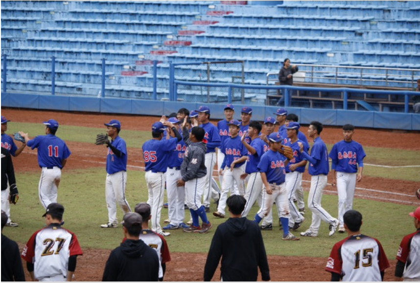
▲大專棒聯，嘉南藥大。