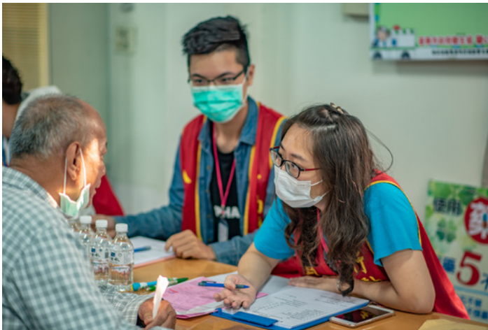
嘉藥藥理學院學生到台南大內區進行「行動醫院 全民健檢」服務