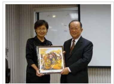
與南大有約~ 司法院優遇大法官王和雄暢談經驗與人生