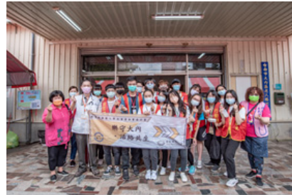
嘉藥藥理USR X南市衛生局，守護內庄好健康。

【記者孫宜秋 / 南市報導】嘉南藥理大學藥理學院攜手臺南市政府衛生局辦理「溫暖大臺南 營造高齡友善城市-健康促進系列活動」，日前移師到大內區進行「行動醫院 全民健檢」服務，結合嘉藥藥理學院「樂守內庄 活絡共生」大學社會責任實踐計