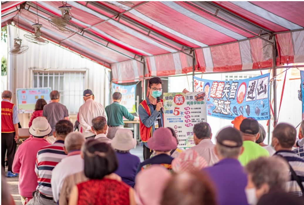
▲嘉藥學生進入社區運用所學宣導用藥資訊。

臺南市城鄉差距大，間接造成醫療資源分布不均，大內區不僅人口老化，醫療資源也較為欠缺；因此特別將「行動醫院 全民健檢」開到大內區，提供到點的整合式篩檢服務，讓偏遠地區民眾能享有便捷醫療資源；檢查項目除一般成人健檢外，現場也有藥師、中醫師等專業醫療人員提供預防保健諮詢。