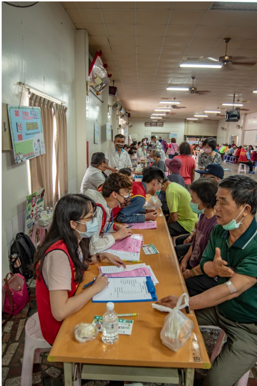
嘉南藥理大學藥理學院到大內區執行「樂守內庄·活絡共生」大學社會責任實踐(USR) 計劃，給予長輩們安全用藥知識。(記者張淑娟攝)