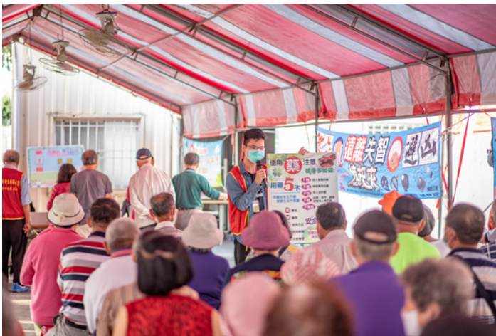
嘉藥學生進入社區運用所學宣導用藥資訊