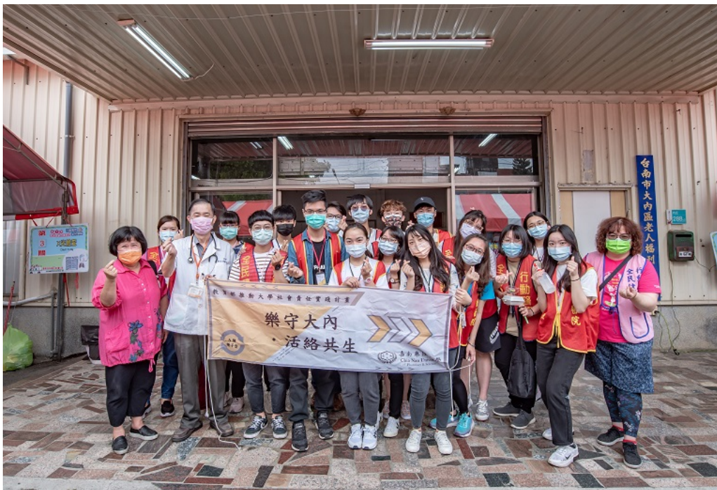
▲嘉藥藥理USR X南市衛生局 守護內庄好健康。