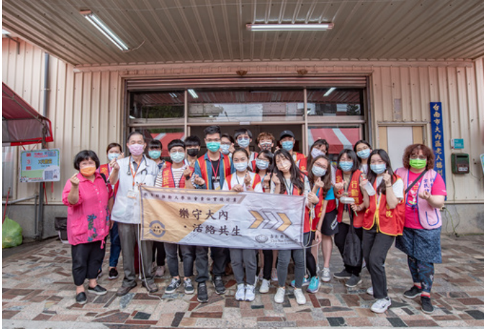
嘉藥藥理USR X南市衛生局 守護內庄好健康