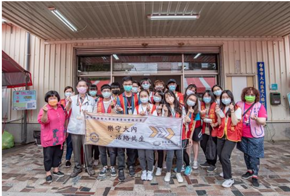
嘉藥藥理USR X南市衛生局 守護內庄好健康

(中央社訊息服務20210423 09:24:05)嘉南藥理大學藥理學院攜手臺南市政府衛生局辦理「溫暖大臺南 營造高齡友善城市-健康促進系列活動」，日前移師到大內區進行「行動醫院 全民健檢」服務，結合嘉藥藥理學院「樂守內庄 活絡共生」大學社會責任實踐設計(USR) 計劃，除了健檢項目外，現場還有專業醫療人員進行諮詢服務，搭配活動設計共20道關卡，提供正確安全用藥知識，吸引超過250位民眾前來參與。