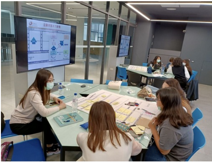
嘉藥休閒系同學透過就業學程計畫學習企劃創意行銷，參加比賽並考取相關證照(照片為三級疫情前拍攝)

程」計畫，在課程中積極輔導學生考照並參加競賽，而「TBSA全國大專創新企劃競賽」就是極佳的挑戰機會，白老師表示，此競賽除可讓學生學習如何寫出創業企劃書外，也培養學生的團隊合作、邏輯思考、行銷創意與表達能力，未來可順利與職場接軌。他同時鼓勵就業學程學員報考廣受業界認列的「TBSA商務企劃進階能力檢定」，17位學員全數通過，考取率100%，成為全國