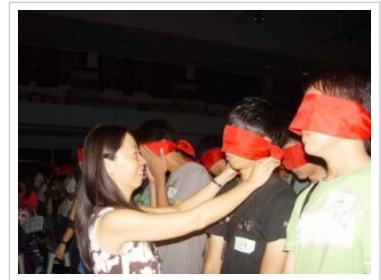
南大薪火傳承 為新生啟蒙