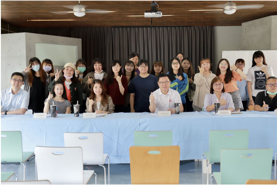
▲ 嘉藥休閒系創意行銷活動企劃人才就業學程期末企劃成果發表(照片為三級疫情前拍攝)

事，每年都吸引超過數百優秀隊伍參加競技，一路從初賽、地區賽、到全國總決賽，競爭激烈也成為參賽選手相互觀摩學習的平台。