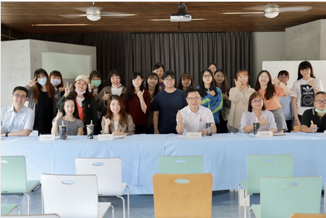
嘉藥休閒系創意行銷活動企劃人才就業學程期末企劃成果發表(照片為三級疫情前拍攝)