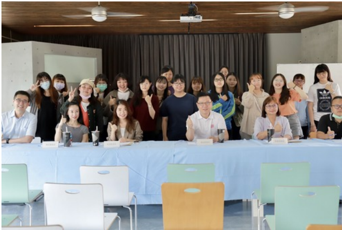
嘉藥休閒系創意行銷活動企劃人才就業學程期末企劃成果發表(照片為三級疫情前拍攝)