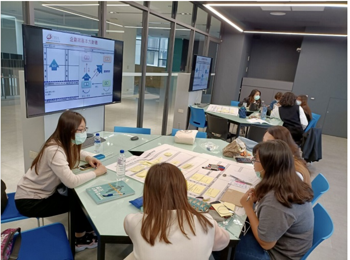
嘉藥休閒系同學透過就業學程計畫學習企劃創意行銷，參加比賽並考取相關證照(照片為三級疫情前拍攝)