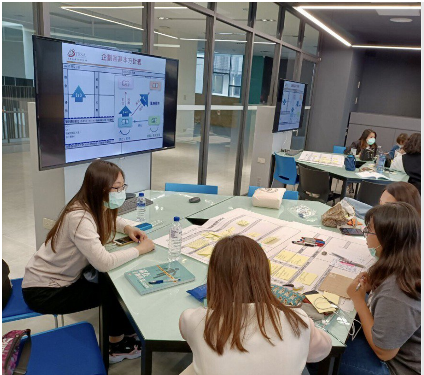
嘉藥休閒系同學透過就業學程計畫學習企劃創意行銷，參加比賽並考取相關證照(照片為三級疫情前拍攝)。