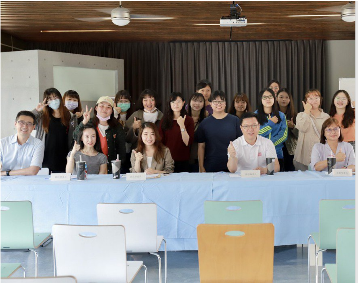
嘉藥休閒系創意行銷活動企劃人才就業學程期末企劃成果發表(照片為三級疫情前拍攝)。