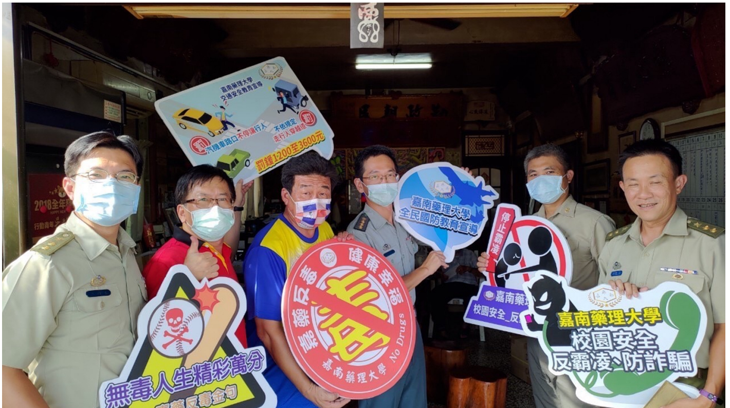
圖：嘉藥軍訓特地拜訪里長及鄰近派出所。

嘉藥表示，校方特別重視學生的安全維護，尤其自去年不幸事件後，學校加強一系列校園安全措施，也積極和周遭歸仁警分局、文賢派出所、文賢消防分隊、交通局、里長及社區巡守隊合作，「增設巡邏箱，提升校園周邊見警率」、「改善校園周邊交通及通學步道照明設施」及「結合守望相助隊加強校園周邊巡邏」來提升校園安全防護強度，期能「防患於未然」，力求安居樂學，讓學生安心、家長放心。【記者黃鐘毅 / 台南報導】