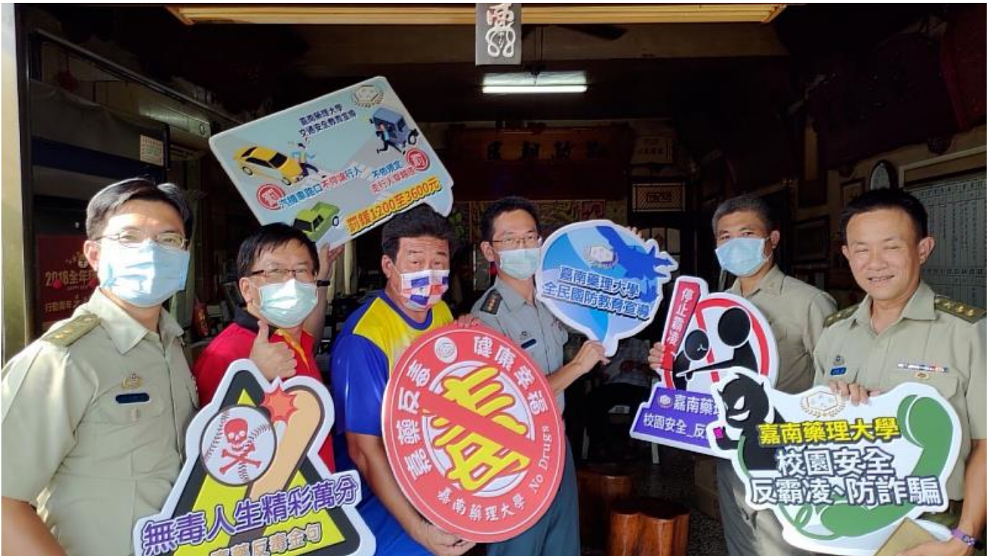
嘉藥軍訓室也特地拜訪里長及鄰近派出所

校方表示，嘉藥特別重視學生的安全維護，尤其自去年不幸事件後，學校加強一系列校園安全措施，如改善周遭照明狀況、增設監視設備密度、推動學校宿舍駐點老師制度及防身術推展，也積極和周遭單位包含歸仁警分局、文賢派出所、文賢消防分隊、交通局、里長及社區巡守隊合作，「增設巡邏箱，提升校園周邊見警率」、「改善校園周邊交通及通學步道照明設施」及「結合守望相助隊加強校園周邊巡邏」來提升校園安全防護強度，期能「防患於未然」，力求安居樂學，讓學生安心、家長放心。