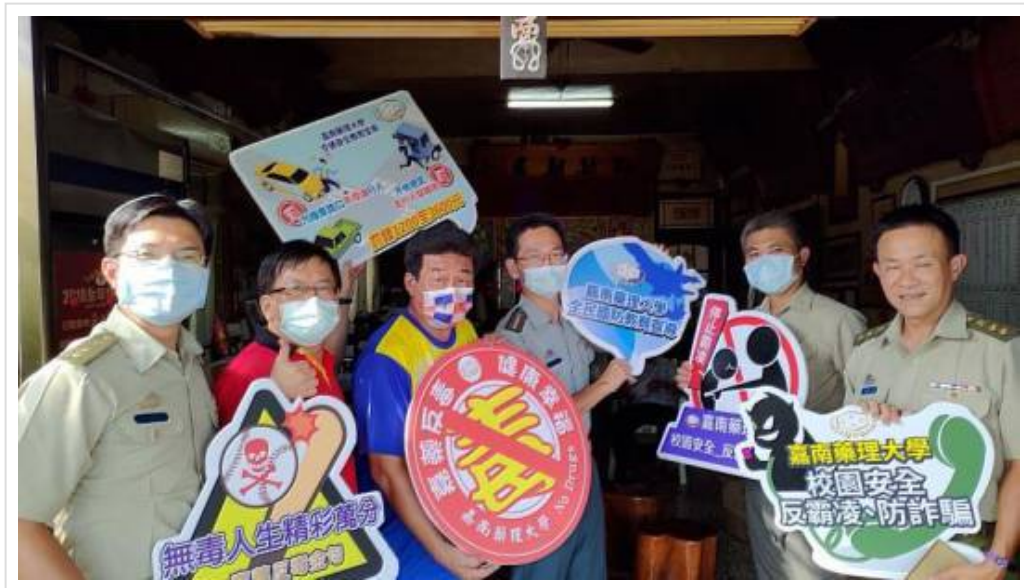
▲嘉藥軍訓室也特地拜訪里長及鄰近派出所