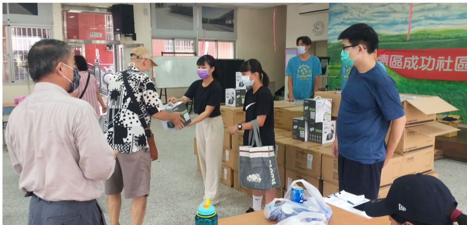
▲ 嘉藥運管系同學協助仁德區重陽敬老活動

嘉南藥理大學整合全校跨域資源，為能活化在地社區、經營環境永續，除了持續投入大學社會責任實踐 (University Social Responsibility, USR) 計畫，也攜手地方共同舉辦社區公益活動，從黃金海岸到關廟區，從銀髮長者到國小學童都是嘉藥USR投入的地區與夥伴，彼此熱情互動與回饋則成為活動永續經營的滋養，帶來成長與溫暖。