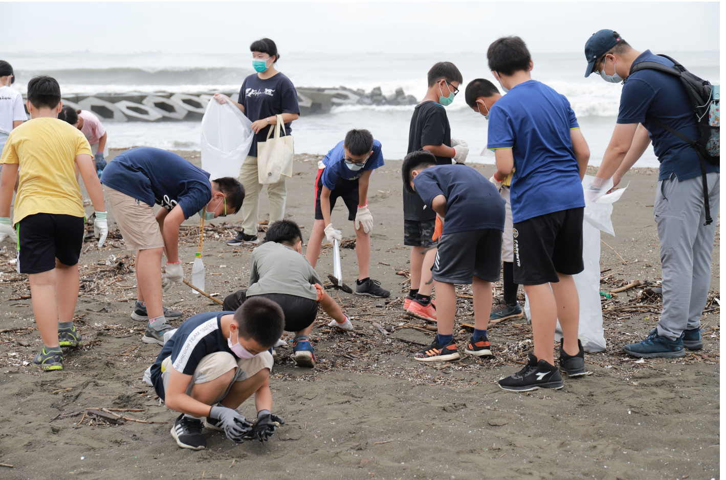
嘉藥學生與省躬國小同學一同完成淨灘工作。

為能活化在地社區、經營環境永續，嘉南藥理大學整合全校跨域資源，除了投入大學社會責任實踐計畫，也攜手地方共同舉辦社區公益活動，從黃金海岸到關廟區，從銀髮長者到國小學童都是嘉藥USR投入的地區與夥伴，彼此熱情互動與回饋則成為活動永續經營的滋養，帶來成長與溫暖。