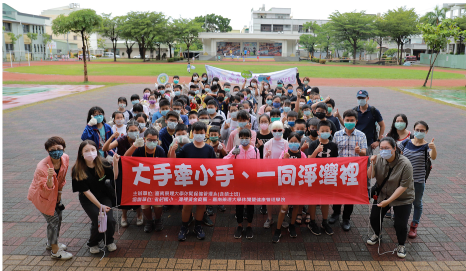
▲ 嘉藥休閒系大手牽小手、一同淨灣裡淨灘活動

嘉南藥理大學整合全校跨域資源，為能活化在地社區、經營環境永續，除了持續投入大學社會責任實踐 (University Social Responsibility, USR) 計畫，也攜手地方共同舉辦社區公益活動，從黃金海岸到關廟區，從銀髮長者到國小學童都是嘉藥USR投入的地區與夥伴，彼此熱情互動與回饋則成為活動永續經營的滋養，帶來成長與溫暖。