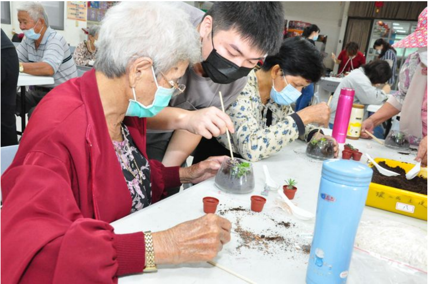
▲嘉藥環境院學生與城西社區長輩一同做創意生態瓶。

嘉藥環境永續學院長年與城西社區(舊稱港仔西)發展協會合作，不論是「家園守護圈」或「永續安南環境生態與綠色產業」USR計畫，透過有食閣有掠的活動-「里長伯養魚」、「西瓜忠種瓜」、「郭姊妹炊粿」、「港仔西烤窯」等活動早就遠近馳名，叫好又叫座，為了深化里民與社區連結，分別於22及28日，由環境永續學院長劉瑞美帶領舉辦「創意壓花書籤」與「創意生態瓶」製作，以多彩花草來設計製作書籤或將綠色植物種栽於回收玻璃容器來綠化居家環境，鼓勵學員多參與社區活動、進而關懷美化社區。