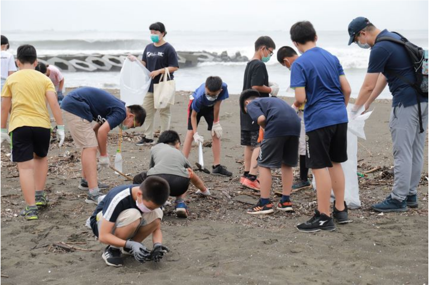
▲嘉藥學生與省躬國小同學一同完成淨灘工作。(嘉藥提供) ▼嘉藥休閒系大手牽小手、一同淨灣裡淨灘活動。(嘉藥提供)