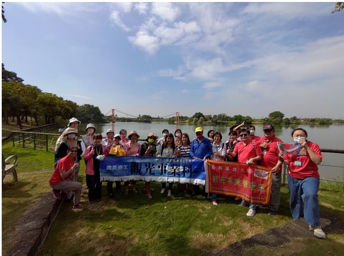
嘉藥聯手高中職舉辦行走西拉雅賞遊生態漫步文化之旅