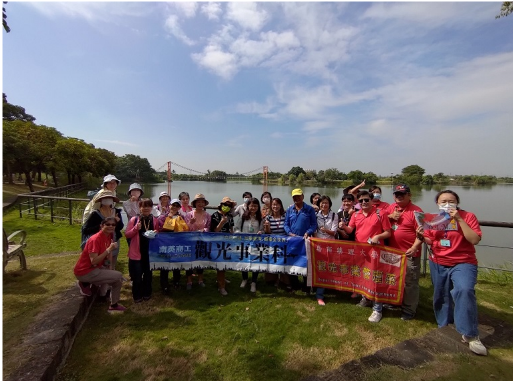
▲嘉藥聯手高中職舉辦行走西拉雅賞遊生態漫步文化之旅。