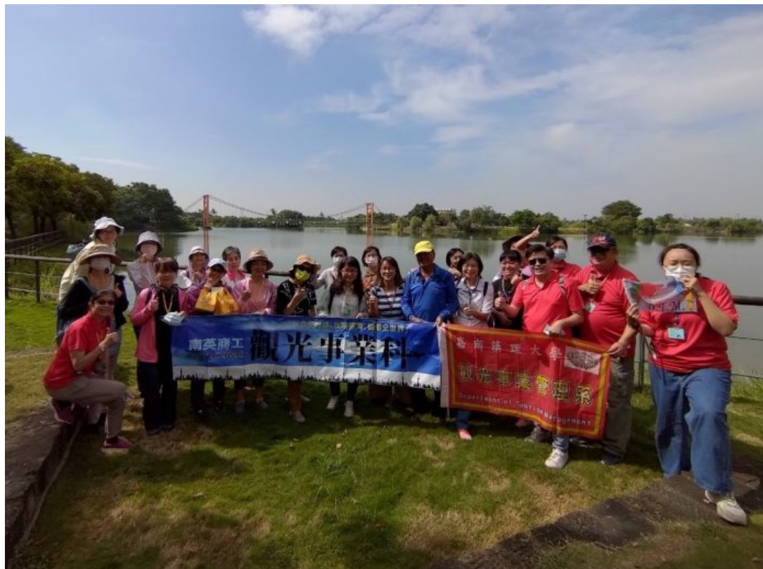
嘉藥觀光系聯手高中職校舉辦行走西拉雅賞遊生態漫步文化之旅。