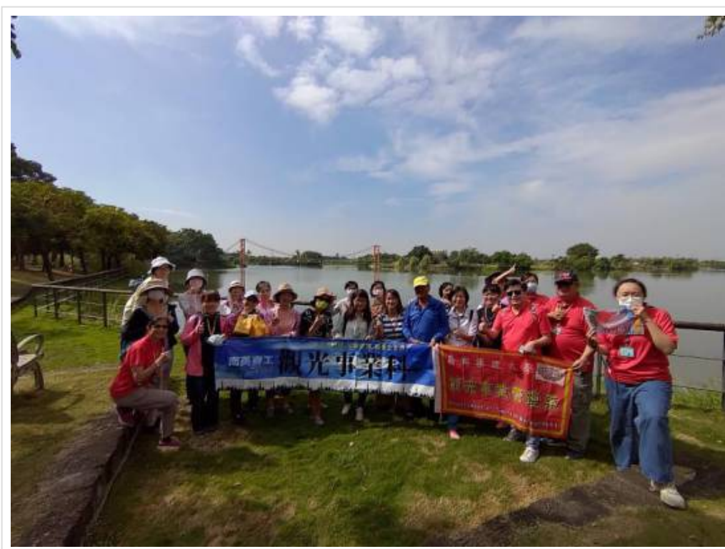
▲ 嘉藥聯手高中職舉辦行走西拉雅賞遊生態漫步文化之旅