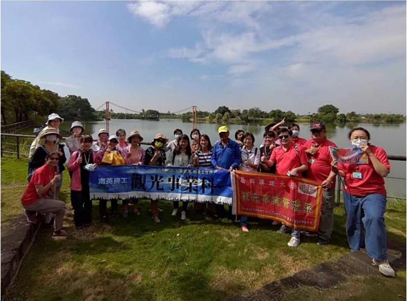
嘉藥觀光系聯手高中職校舉辦行走西拉雅賞遊生態漫步文化之旅。