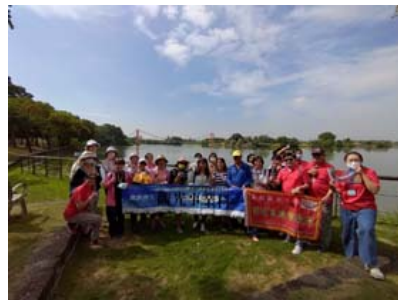
嘉藥聯手高中職舉辦行走西拉雅賞遊生態漫步文化之旅。

【記者孫宜秋 / 南市報導】嘉南藥理大學觀光系日前攜手南英商工、玉井商工、中山國中...等國、高中職師生於西拉雅國家風景區舉辦「行走西拉雅賞遊生態漫步文化之旅」，並由該系畢業系友擔任解說員，不僅詳細說明西拉雅國家風景區內的人文與生態，也分享觀光導覽經驗，讓此次賞遊西拉雅之旅不只感受心靈放鬆，更有體驗導覽員工作的收穫。