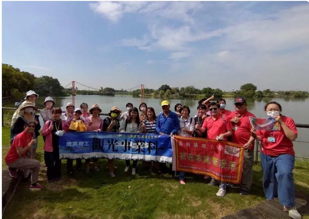
嘉藥觀光系聯手高中職校舉辦行走西拉雅賞遊生態漫步文化之旅。(記者黃文記翻攝)