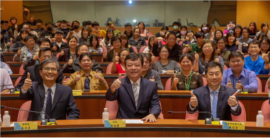
▲ 嘉南藥理大學全體師生與陳宗彥政務次長合影留念

陳宗彥政務次長以全球疫情統計為起點，比較台灣與各國政府抗疫上的不同，也細數中央疫情指揮中心從三級開設以來，各部會間、中央政府與地方政府間如何通力合作，逐步建立信任與默契，因為新冠肺炎才是人類的共同敵人，他更提及訊息傳播需要仰賴全民「停、看、聽」，強調政府對疫情資訊絕對公開透明，就如嘉藥校訓「真實」一樣，而民眾自發性的查證資訊，杜絕散播或聽信謠言，都是疫情當中值得欣慰的，更有利人心安定和社會穩定。