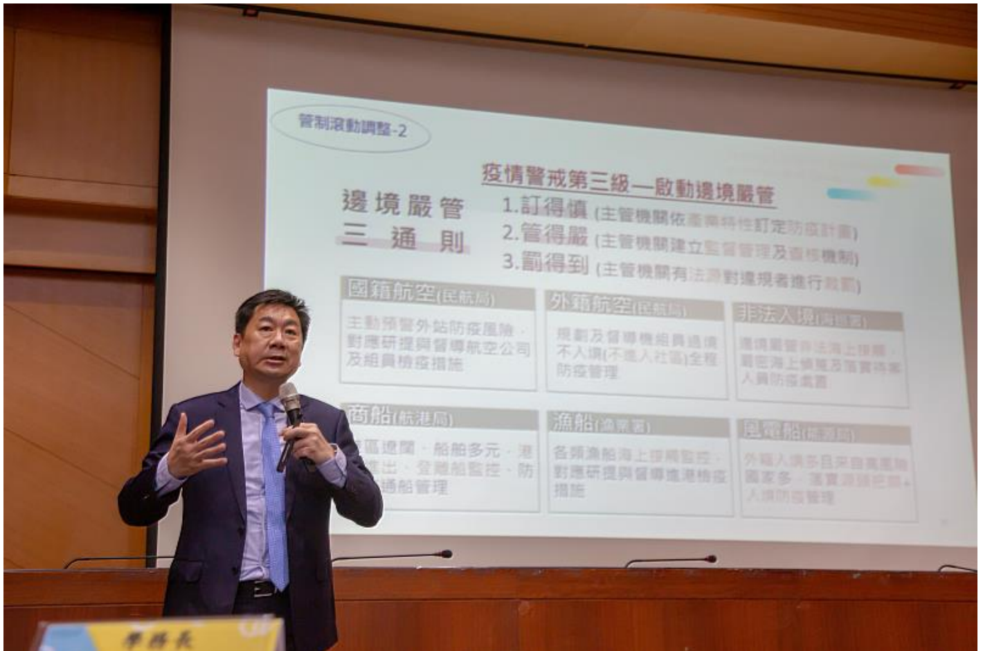
陳宗彥政務次長與大家分享邊境管制的準備與應因

陳宗彥政務次長以全球疫情統計為起點，比較台灣與各國政府抗疫上的不同，也細數中央疫情指揮中心從三級開設以來，各部會間、中央政府與地方政府間如何通力合作，逐步建立信任與默契，因為新冠肺炎才是人類的共同敵人，他更提及訊息傳播需要仰賴全民「停、看、聽」，強調政府對疫情資訊絕對公開透明，就如嘉藥校訓「真實」一樣，而民眾自發性的查證資訊，杜絕散播或聽信謠言，都是疫情當中值得欣慰的，更有利人心安定和社會穩定。