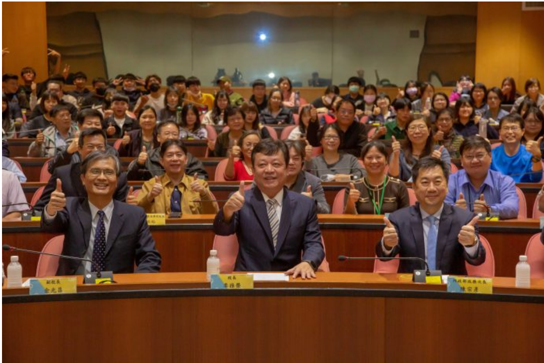
內政部次長陳宗彥（前右一）應邀到嘉藥演講，與參與師生合影。