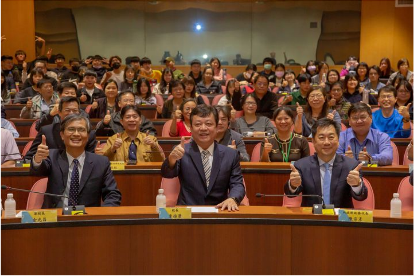
▲嘉南藥理大學全體師生與陳宗彥政務次長合影留念。