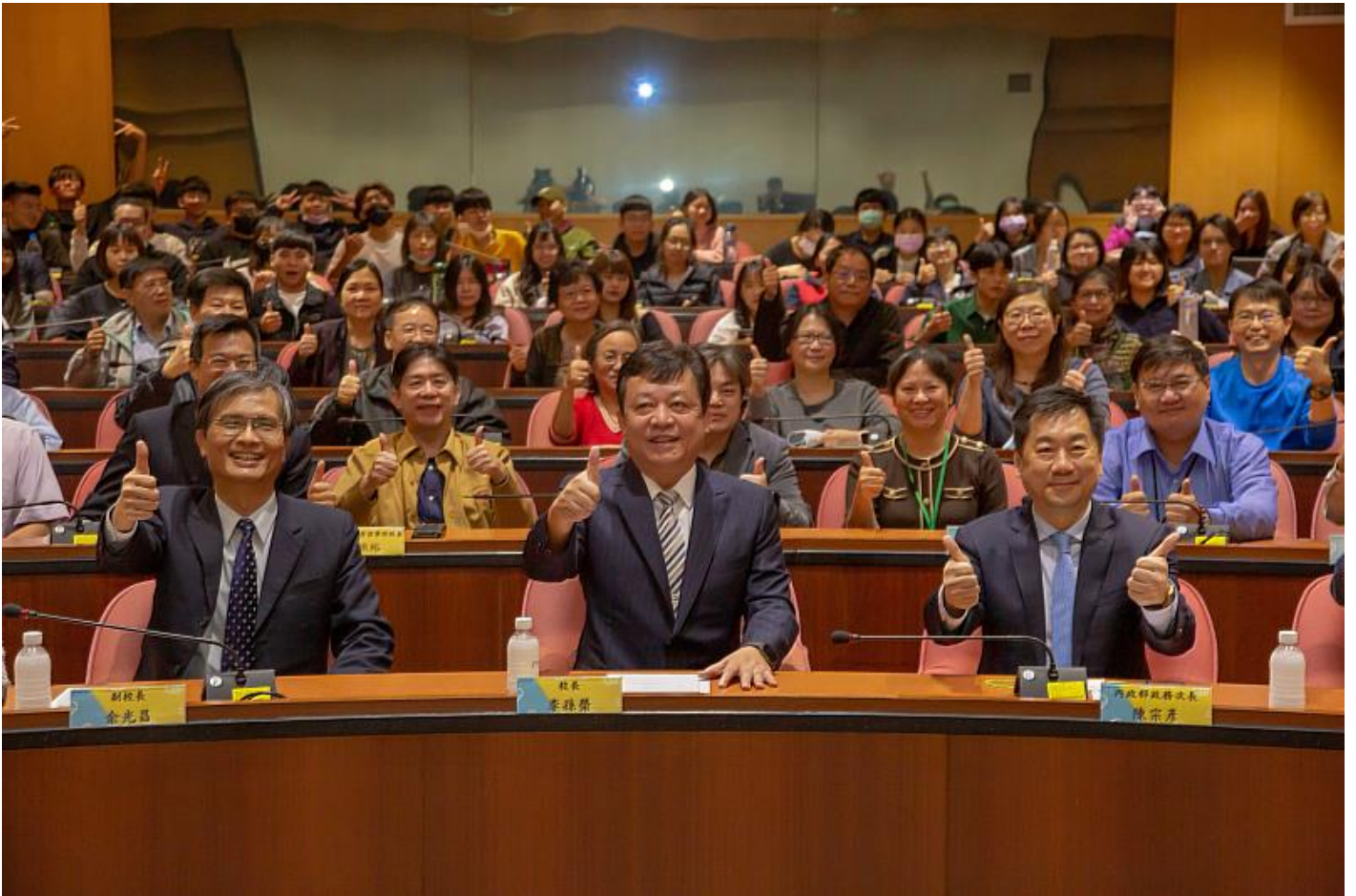
嘉南藥理大學全體師生與陳宗彥政務次長合影留念

嘉藥校長李孫榮特別致贈以嘉藥校訓「真實」為題之白瓷酒瓶，除了感謝陳政次應邀蒞校演講外，也傳達對陳政次與中央疫情指揮中心長期守護台灣的敬佩，李校長表示，新冠疫情影響全民生活甚巨，還好有中央疫情指揮中心明確而有效的指引，引導民眾及學校在抉擇當下做出正確措施，如今大家能相聚於校園，齊聚一起聆聽演講就是台灣疫情控制成功的最佳證明，也是政府、防疫人員與民眾共同努力的成果。