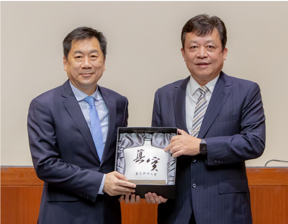
▲ 嘉南藥理大學李孫榮校長致贈「真實」校訓的白磁酒瓶感謝防疫團隊們防疫期間的辛勞

陳宗彥政務次長以全球疫情統計為起點，比較台灣與各國政府抗疫上的不同，也細數中央疫情指揮中心從三級開設以來，各部會間、中央政府與地方政府間如何通力合作，逐步建立信任與默契，因為新冠肺炎才是人類的共同敵人，他更提及訊息傳播需要仰賴全民「停、看、聽」，強調政府對疫情資訊絕對公開透明，就如嘉藥校訓「真實」一樣，而民眾自發性的查證資訊，杜絕散播或聽信謠言，都是疫情當中值得欣慰的，更有利人心安定和社會穩定。