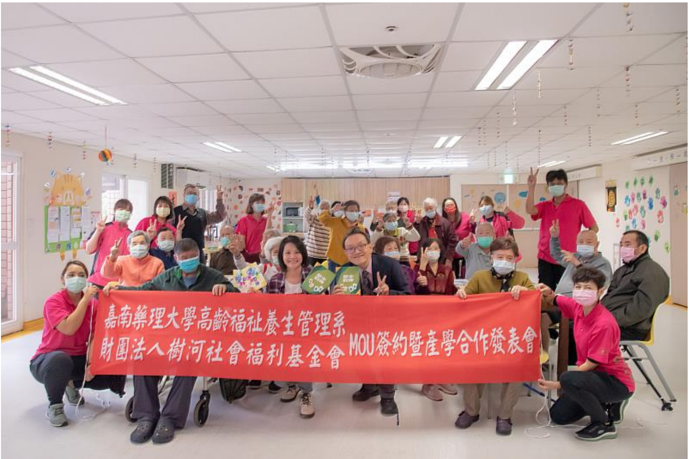
嘉藥長期與悠然綠園合作延緩失能益智桌遊

(中央社訊息服務20211223 10:00:10)強強聯手，嘉南藥理大學高齡福祉養生管理系21日與臺南優質長照機構悠然體系簽訂合作備忘錄並進行銀髮桌遊開發的產學技轉，在雙方長期努力下，目前合作開發多款預防及延緩失能的銀髮桌遊已量產上市，計畫透過國內知名的「瘋桌遊」平台銷售，不僅帶給銀髮族更多休閒養生選項，也為台灣高齡長照產業開拓更多領域與人才。