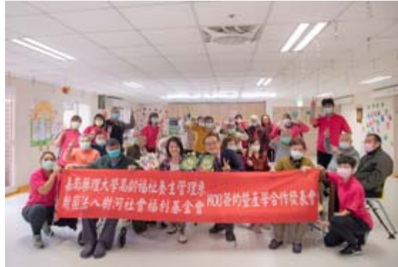
嘉藥長期與悠然綠園合作延緩失能益智桌遊。

【記者孫宜秋 / 南市報導】強強聯手，嘉南藥理大學高齡福祉養生管理系今（21）日與臺南優質長照機構悠然體系簽訂合作備忘錄並進行銀髮桌遊開發的產學技轉，在雙方長期努力下，目前合作開發多款預防及延緩失能的銀髮桌遊已量產上市，計畫透過國內知名的「瘋桌遊」平台銷售，不僅帶給銀髮族更多休閒養生選項，也為台灣高齡長照產業開拓更多領域與人才。