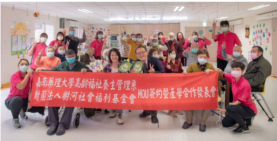
▲ 嘉藥長期與悠然綠園合作延緩失能益智桌遊

強強聯手，嘉南藥理大學高齡福祉養生管理系12月21日與臺南優質長照機構悠然體系簽訂合作備忘錄並進行銀髮桌遊開發的產學技轉，在雙方長期努力下，目前合作開發多款預防及延緩失能的銀髮桌遊已量產上市，計畫透過國內知名的「瘋桌遊」平台銷售，不僅帶給銀髮族更多休閒養生選項，也為台灣高齡長照產業開拓更多領域與人才。