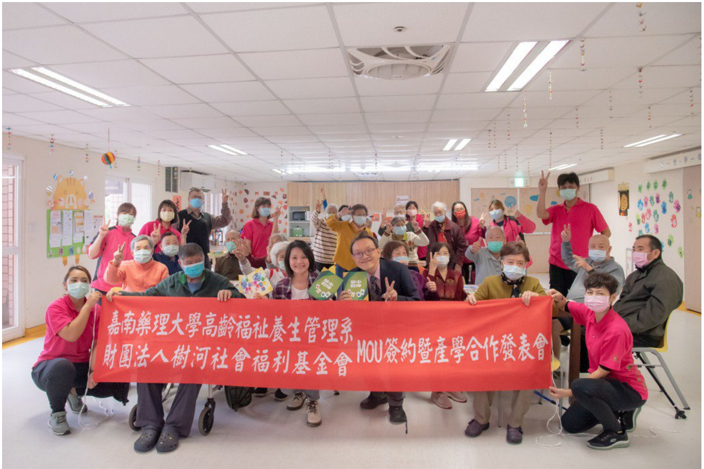
嘉藥長期與悠然綠園合作延緩失能益智桌遊。

造福社區與機構的長輩，除了感謝樹河基金會與悠然體系長期支持外，也期盼將來能培育出更多的高齡產業人才，為高齡化台灣盡一份心力。