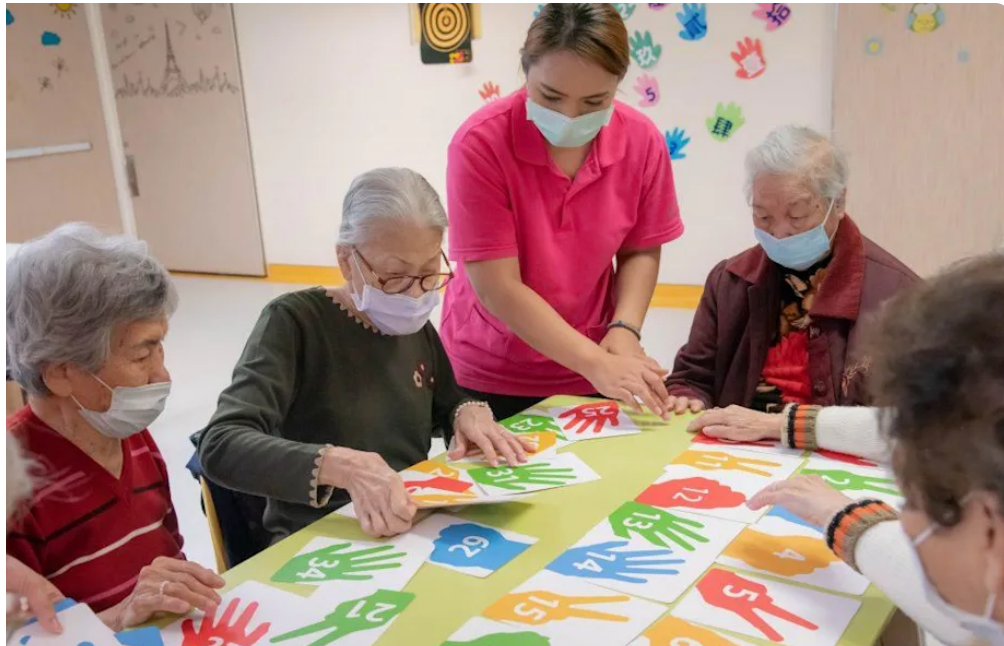
嘉藥研發銀髮桌遊，讓銀髮族有更多休閒養生選項。