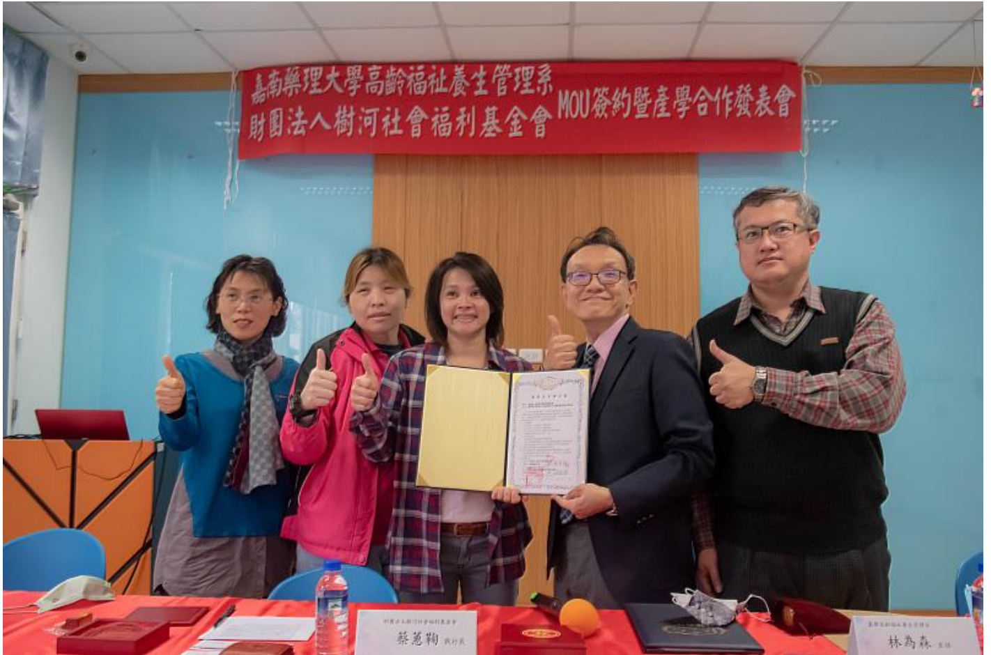
嘉藥高福系與長照機構悠然體系簽訂合作備忘錄

顏色、數字與動作結合，讓長者在收到顏色、數字指令時，除了做出對應動作外，也可舒展身體，而「歡樂數」則透過顏色、數字及形狀的結合，培養團隊合作、策略運用以預防延緩失能。