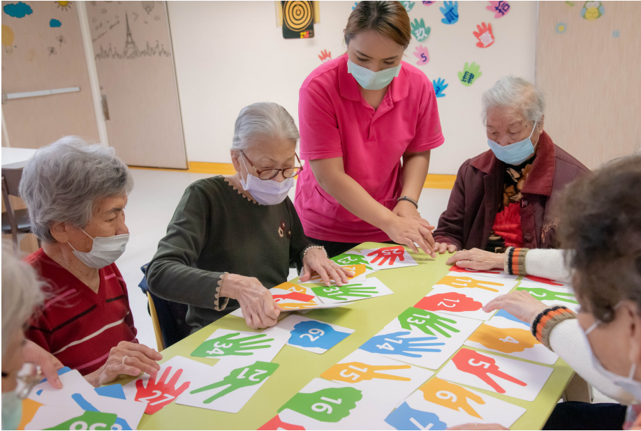
▲ 嘉藥研發銀髮桌遊銀髮族更多休閒養生選項

健康促進教案，成為衛生福利部預防及延緩失能照護方案-延緩失能益智桌遊（中央型：CL-03-0064），此次技轉的「歡樂數」與「掌中乾坤」兩款遊戲以數字、顏色為基礎，「掌中乾坤」著重在顏色、數字與動作結合，讓長者在收到顏色、數字指令時，除了做出對應動作外，也可舒展身體，而「歡樂數」則透過顏色、數字及形狀的結合，培養團隊合作、策略運用以預防延緩失能。