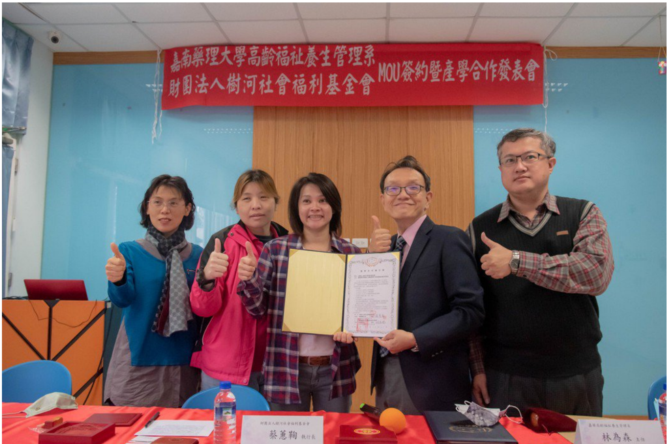
嘉藥高福系與長照機構悠然體系簽訂合作備忘錄。