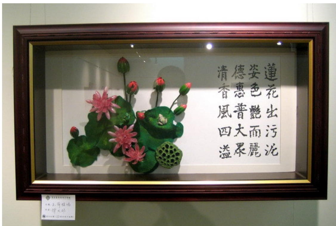
▲徐老師作品-玉荷蛙鳴。