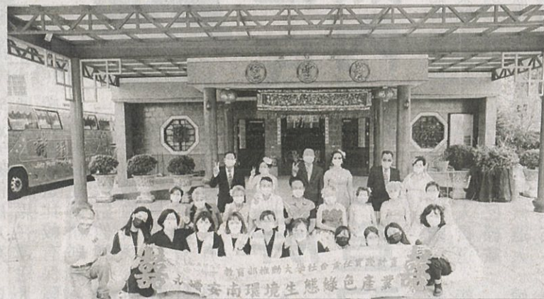
嘉藥師生今到城西社區舉辦「嘉內的公公婆婆，藥您漂亮的回憶」活動。

上有極大的挑戰性，無論是皮膚的水嫩或皺紋都是課堂中學不到的實作經驗，特別是幫阿嬤們完妝後看到他們開心滿意的笑容，更加體會到滿滿的成就感跟感動！ 環境學院院長劉瑞美表示，嘉藥環境學院長年與執行USR計畫，持續與在地合作進行社區營造及地方觀光經濟開發，希望能讓遊客能輕鬆的認識城西里的特有景點、生態物種、糧品特色製程及海蠶風味餐，期待為這個地處偏遠、城鄉差距大、人口外流嚴重的社區創造更多活力，吸引更多遊客一同來體驗環境美、人文更美的港仔西文化。