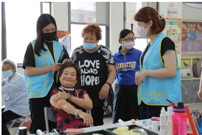
▲ 由嘉藥粧品系學生展現專業幫阿嬤打扮漂亮拍婚紗

嘉南藥理大學4月19日再度來到台南市安南區城西社區舉辦「“嘉”內的公公婆婆，“藥”您漂亮的回憶」活動，邀請當地銀髮族與該校環境永續學院及粧品系學生同樂，透過同學們現場為社區長者化妝、設計婚紗造型及拍攝婚紗照，讓阿公、阿嬤們再現當年結婚時的溫馨幸福，彷彿穿越時空隧道，重溫青春的美好，氣氛相當感人。