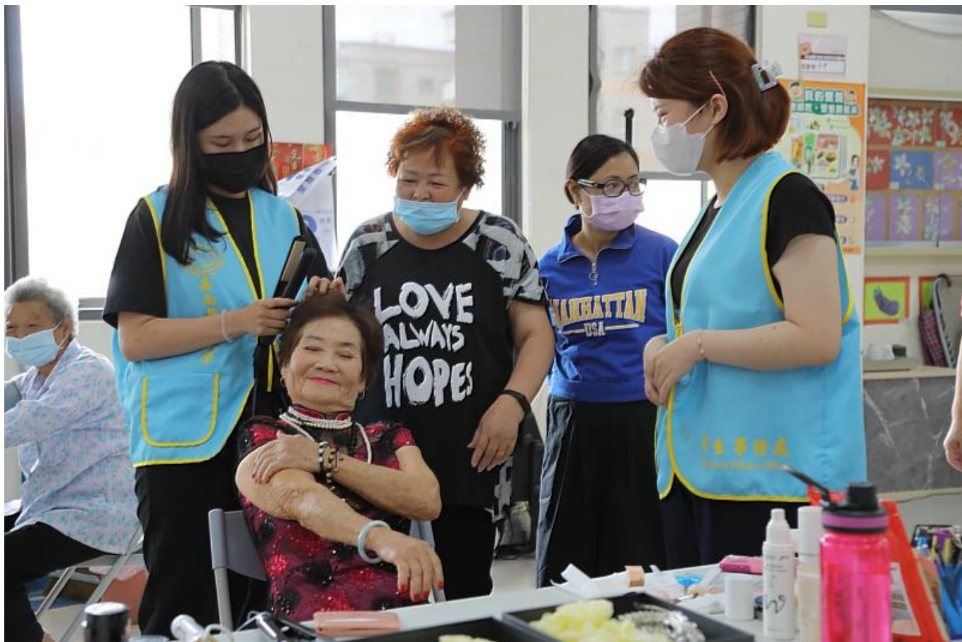
由嘉藥粧品系學生展現專業幫阿嬤打扮漂亮拍婚紗