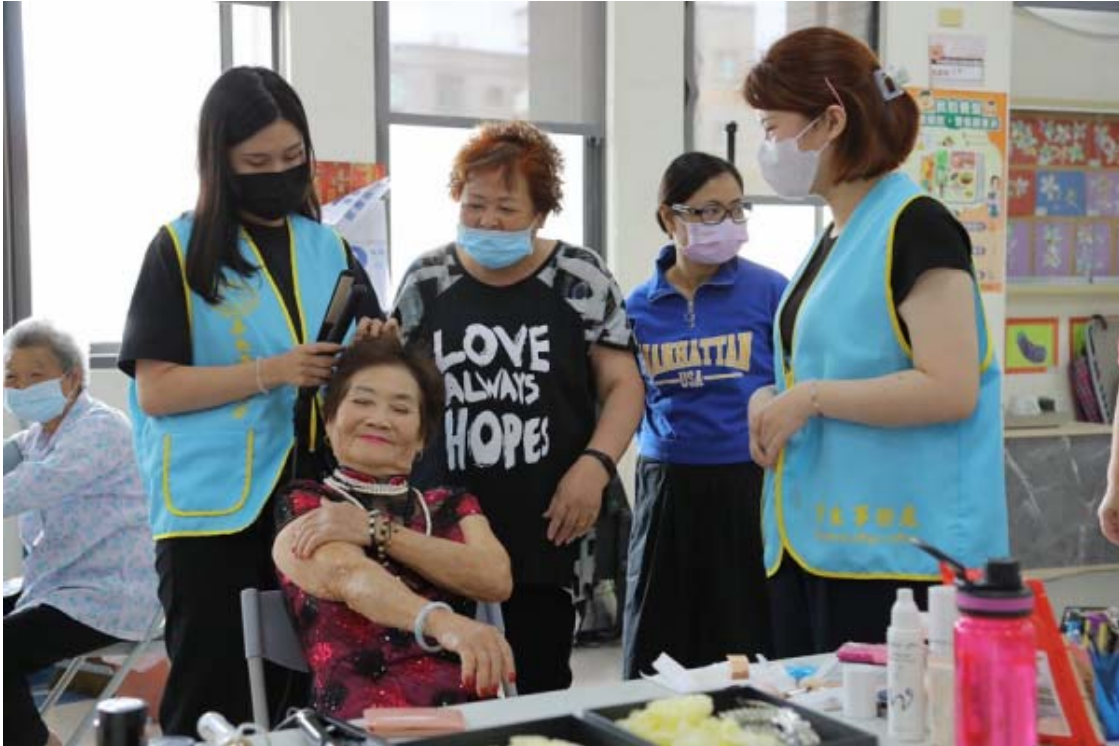
由嘉藥粧品系學生展現專業幫阿嬤打扮漂亮拍婚紗。

長者們設計彩粧、穿戴婚紗及拍照，藉由拍攝婚紗重溫往日甜蜜喜樂的氛圍，讓長者們擁有愉快且豐富多元的美好記憶，留下幸福的回憶。