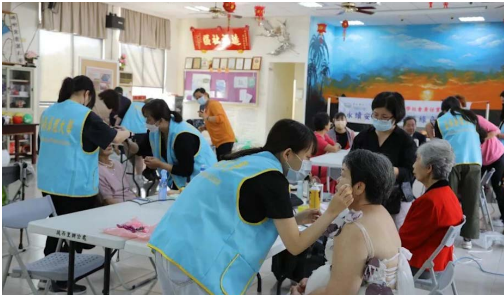
嘉藥環境永續學院及粧品系學生，為社區長輩化妝、設計婚紗造型，讓阿公、阿嬤再現當年結婚時的溫馨幸福。