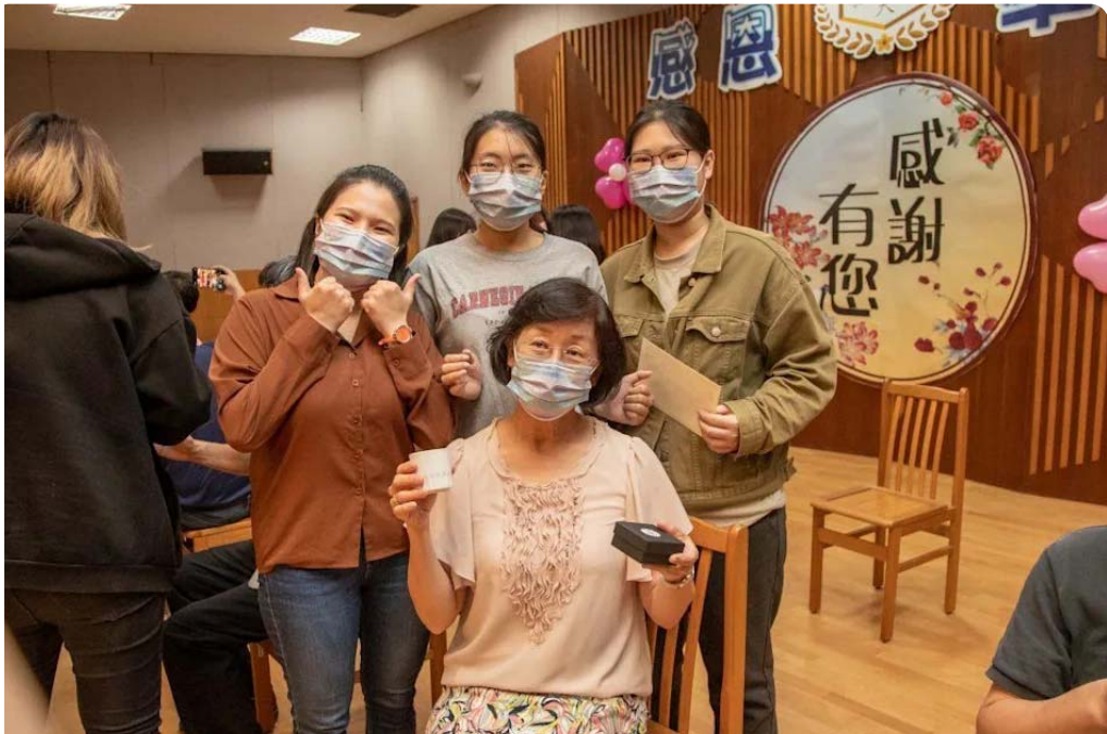
嘉藥學生為師長們奉茶。