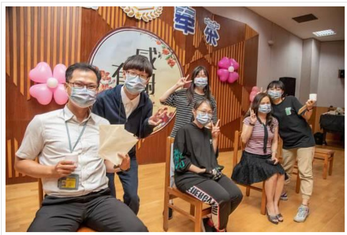
▲嘉藥舉辦「感恩奉茶、獻禮暖心」活動，更加拉近師生彼此間的感情