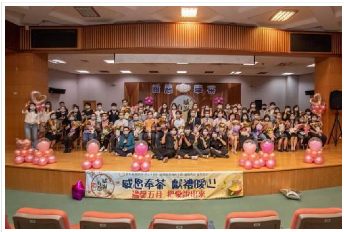
▲嘉藥舉辦舉辦「感恩奉茶、獻禮暖心」活動