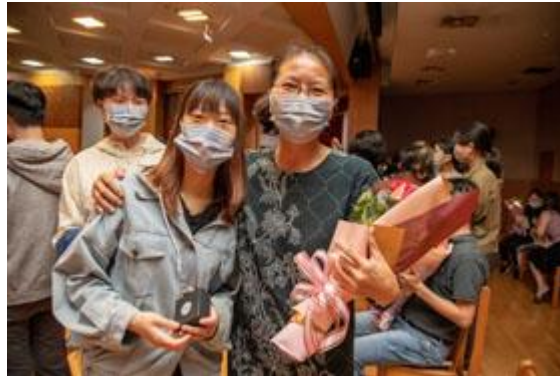
活動溫馨感人，老師與學生都紅了眼眶。

【記者孫宜秋 / 南市報導】疫情升溫的五月，讓原本充滿感念溫馨的母親節黯淡了不少，緊接的六月將迎來畢業季，更要好好把握機會，在離別前向師長一訴感謝之情。嘉南藥理大學為了讓學生與師長能彼此分享暖心溫情，特別舉辦「感恩奉茶、獻禮暖心」活動。在高規格防疫措施的前提下，