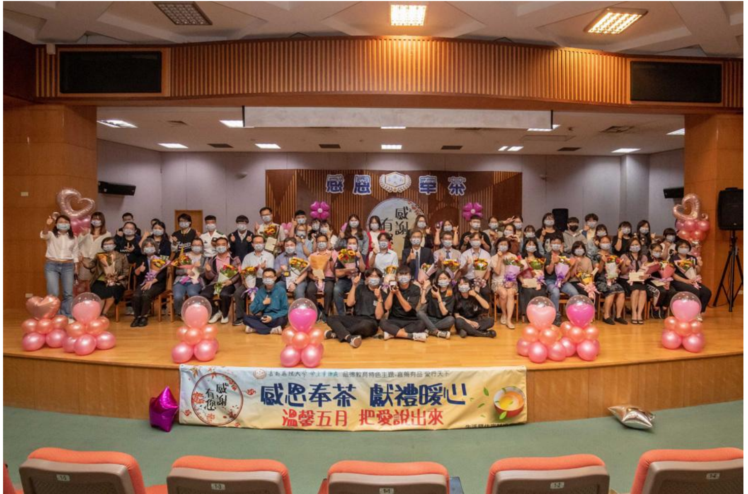
嘉藥舉辦舉辦「感恩奉茶、獻禮暖心」活動。

「奉茶」是一種文化，也是一種精神，代表尊重與感恩。在5月這個充滿著感謝與祝福的季節，嘉南藥理大學安排同學們向師長們奉茶，喝的不只是茶水，更是滿滿的感激與無限的祝福，藉由奉茶的儀式，表達感恩師長們無私的付出，時時的言行身教，培養學生的良好品德。