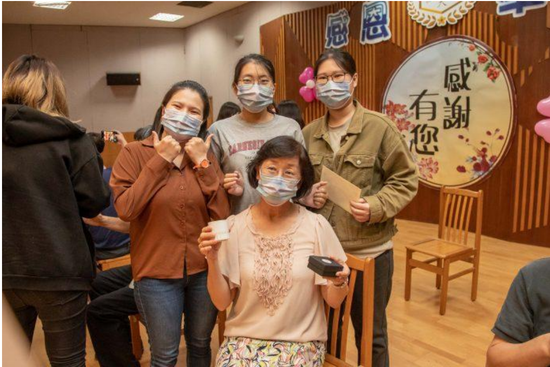
嘉藥學生為師長們奉茶。