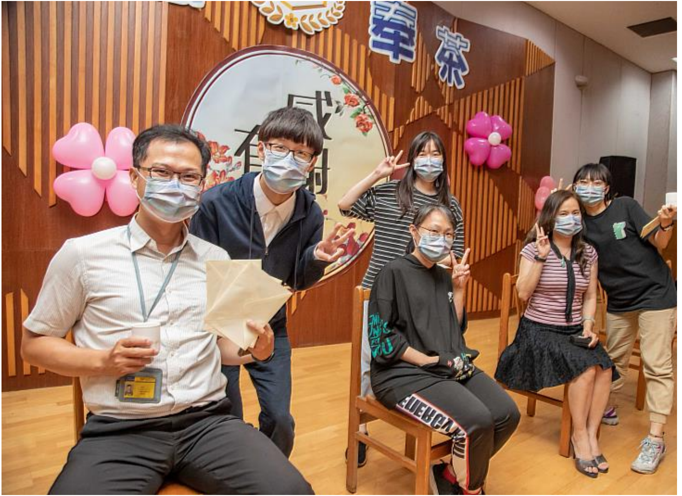
嘉藥舉辦「感恩奉茶、獻禮暖心」活動，更加拉近師生彼此間的感情