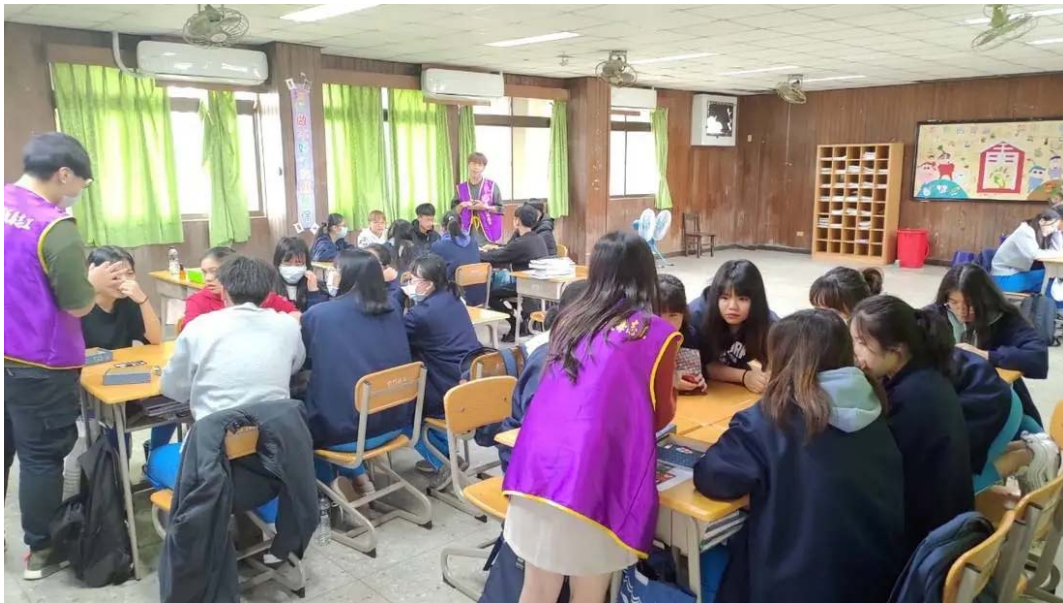
(圖說) 嘉藥師生110年跨海至金門學校宣傳反毒活動。

嘉藥長期配合政府「新世代反毒行動綱領」，落實推動防制學生藥物濫用工作，由於近來校園毒品使用年齡有下降之隱憂，因此，該校積極辦理校內外創新多元的宣教活動，憑藉著多年的經驗與不斷的努力，不僅與鄰近各級學校在反毒議題上有深厚的合作與默契，更將寶貴反毒經驗推展至偏鄉，在110年跨海延伸至金門各級學校，創新卓越，深獲多方肯定。