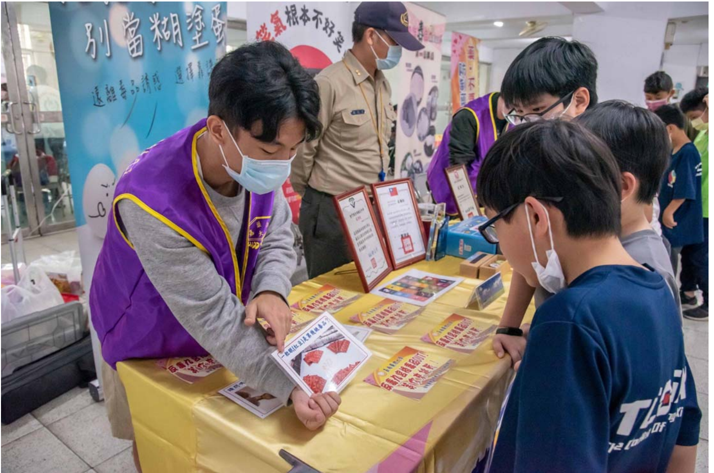
圖說：嘉藥反毒志工團利用桌遊宣導毒品危害。

嘉藥紫錐花反毒社結合校內資源，整合包含社工系、藥學系與粧品系等師生組成反毒志工團，與衛福部、台南市衛生局和警察局及地方法院等政府機構攜手合作，辦理多項教育宣導活動，例如反毒AI機器人競賽、反毒桌遊、跨海校外反毒等，吸引近5千人次參與，其中反毒宣導品也搭配新冠防疫需求製作乾洗手，讓反毒不只寓教於樂也結合生活化趨勢。