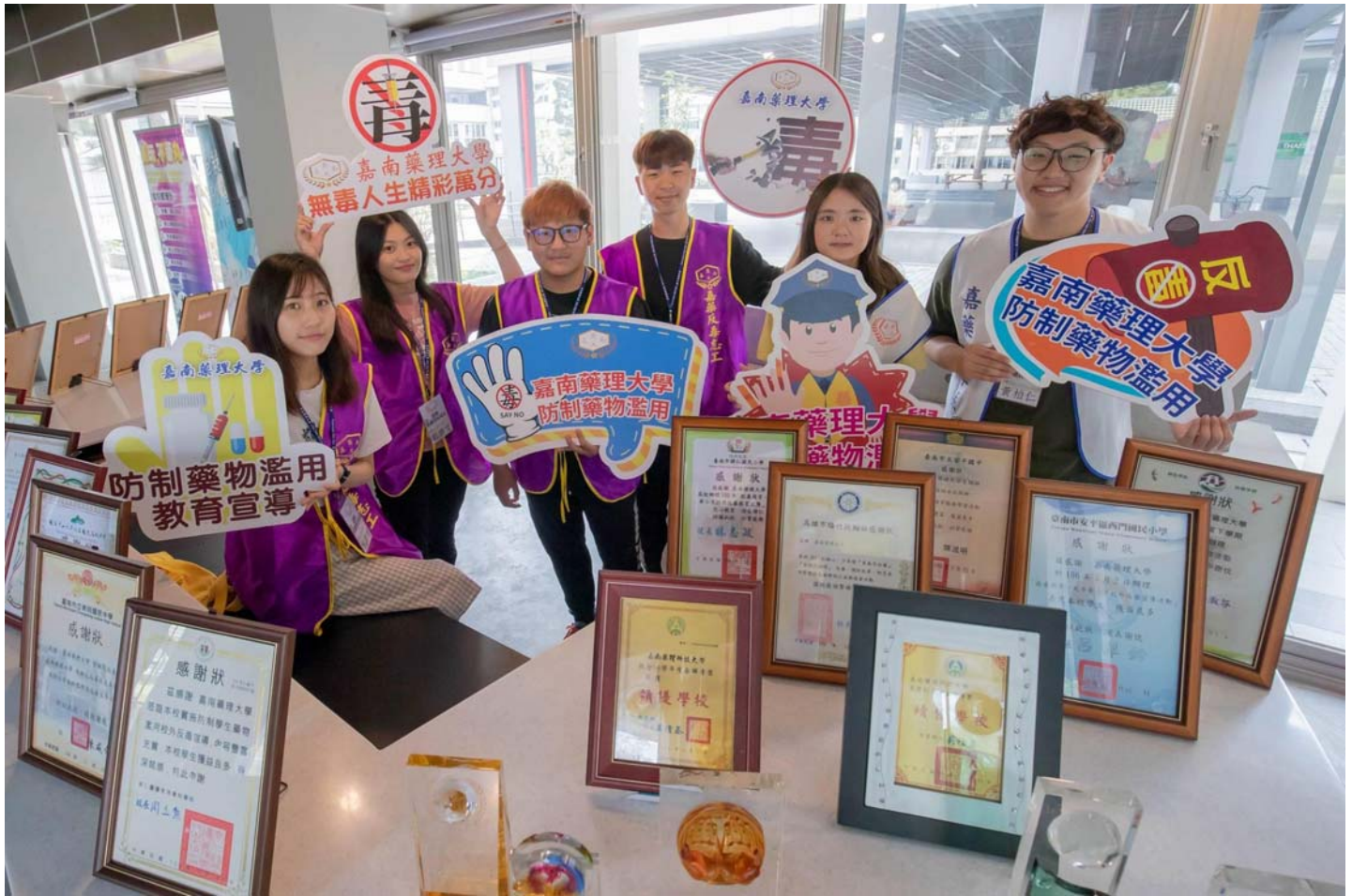
圖說：嘉南藥理大學連續六年獲得「防制學生藥物濫用」績優學校。

【記者黃鐘毅 / 台南報導】嘉南藥理大學「防制學生藥物濫用」績效嚇嚇叫，今年再次獲得教育部肯定，蟬聯110年度育部評鑑全國大專院校「防制學生藥物濫用」績優學校，不僅締造高達12度獲獎紀錄，更是連續六年獲得此項殊榮，令全校師生倍感振奮，與有榮焉，彰顯嘉藥在防制學生藥物濫用工作上的深耕與成效。