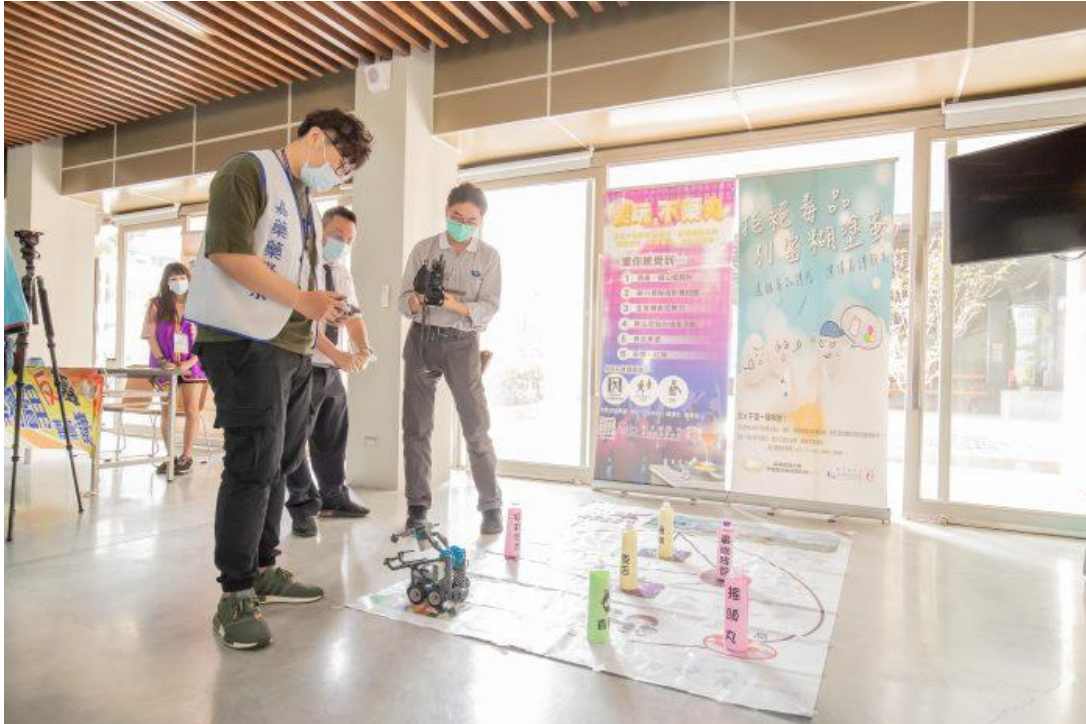
嘉藥以創新方式來宣導反毒。