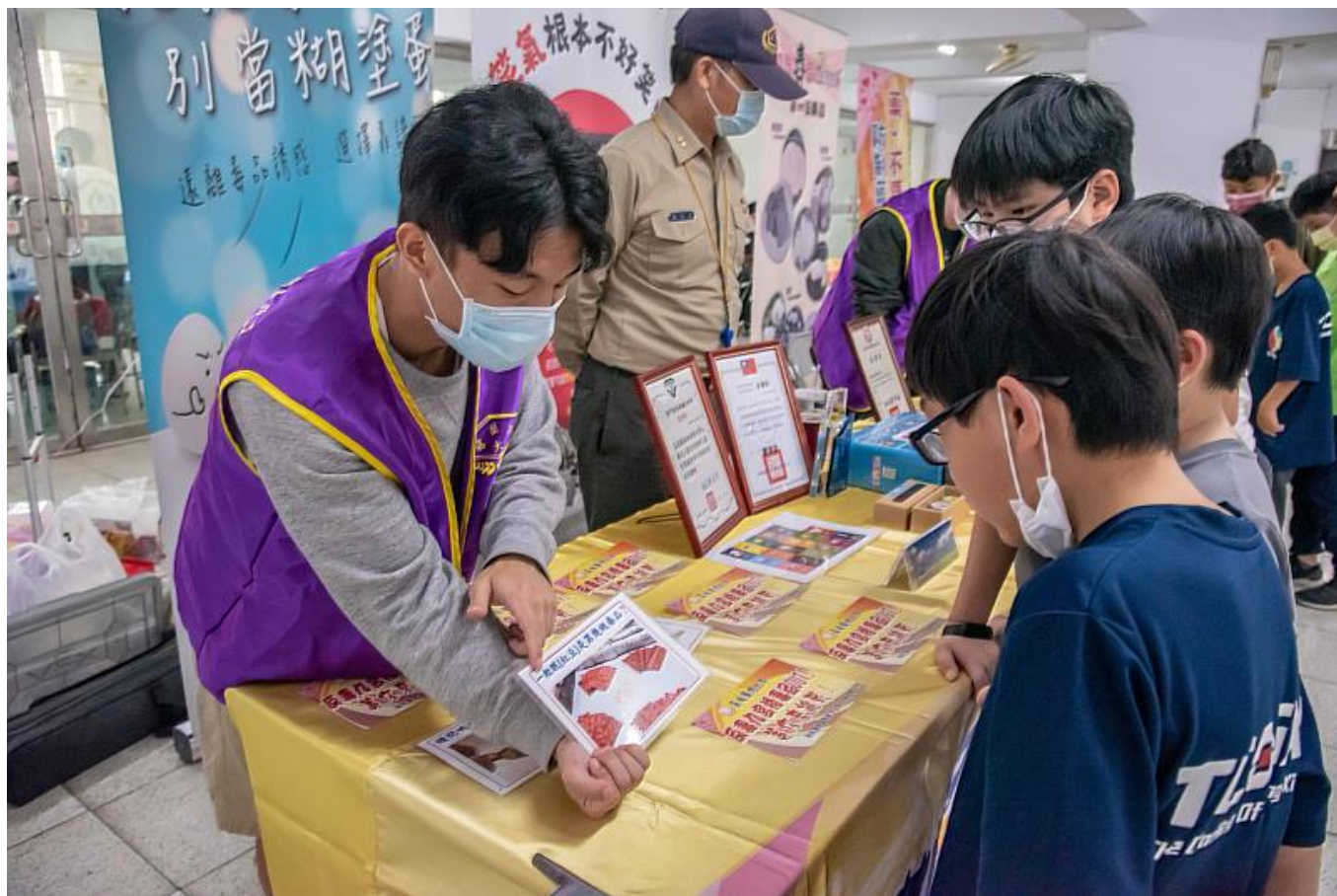
嘉藥反毒志工團利用桌遊宣導毒品危害

戰心驚。嘉藥紫錐花反毒社結合校內資源，整合包含社工系、藥學系與粧品系等師生組成反毒志工團，與衛福部、臺南市衛生局和警察局及地方法院等政府機構攜手合作，辦理多項教育宣導活動，例如反毒AI機器人競賽、反毒桌遊、跨海校外反毒等，吸引近5千人次參與，其中反毒宣導品也搭配新冠防疫需求製作乾洗手，讓反毒不只寓教於樂也結合生活化趨勢。