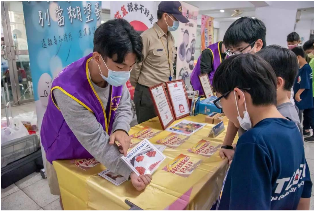
(圖說) 嘉藥反毒志工團利用桌遊宣導毒品危害。

嘉藥長期配合政府「新世代反毒行動綱領」，落實推動防制學生藥物濫用工作，由於近來校園毒品使用年齡有下降之隱憂，因此，該校積極辦理校內外創新多元的宣教活動，憑藉著多年的經驗與不斷的努力，不僅與鄰近各級學校在反毒議題上有深厚的合作與默契，更將寶貴反毒經驗推展至偏鄉，在110年跨海延伸至金門各級學校，創新卓越，深獲多方肯定。