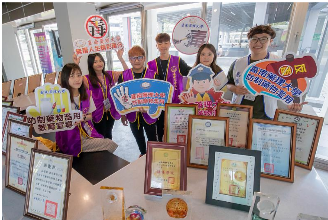
嘉藥連續六年獲得「防制學生藥物濫用」績優學校

嘉藥長期配合政府「新世代反毒行動綱領」，落實推動防制學生藥物濫用工作，由於近來校園毒品使用年齡有下降之隱憂，因此，該校積極辦理校內外創新多元的宣教活動，憑藉著多年的經驗與不斷的努力，不僅與鄰近各級學校在反毒議題上有深厚的合作與默契，更將寶貴反毒經驗推展至偏鄉，在110年跨海延伸至金門各級學校，創新卓越，深獲多方肯定。