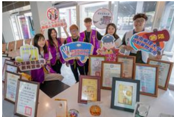
嘉藥連續六年獲得「防制學生藥物濫用」績優學校。

【記者孫紹逸 / 南市報導】嘉南藥理大學「防制學生藥物濫用」績效嚇嚇叫，今年再次獲得教育部肯定，蟬聯110年度教育部評鑑全國大專院校「防制學生藥物濫用」績優學校，不僅締造高達12度獲獎紀錄，更是已連續六年獲得此項殊榮，令全校師生倍感振奮，與有榮焉，彰顯嘉藥在防制學生藥物濫用工作上的深耕與成效。