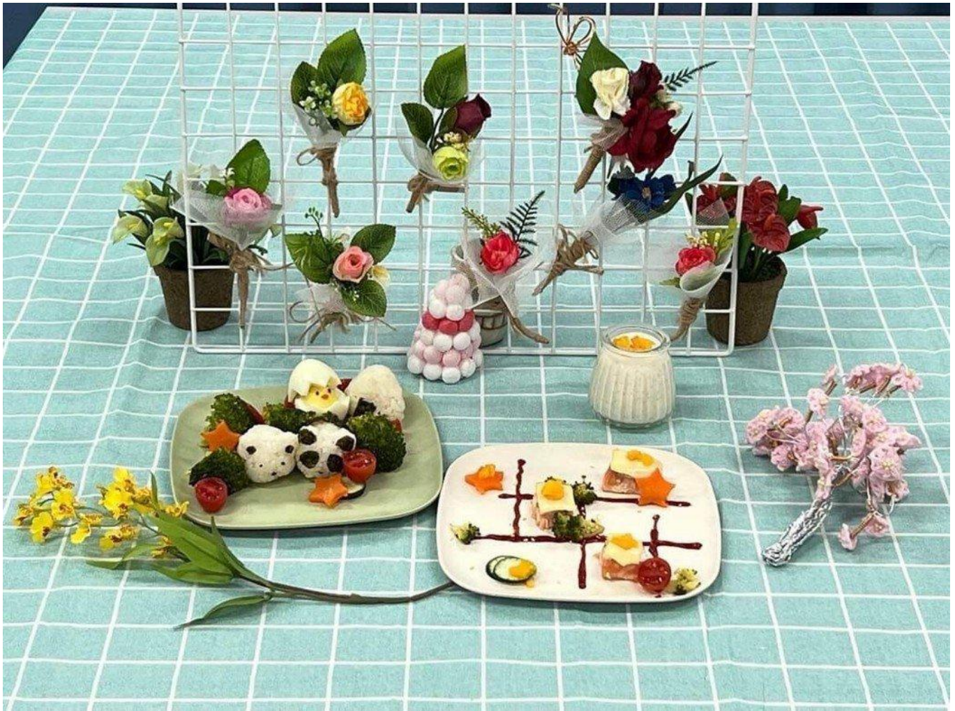
兒童創意套餐除樂造型創意也要兼顧營養均衡。