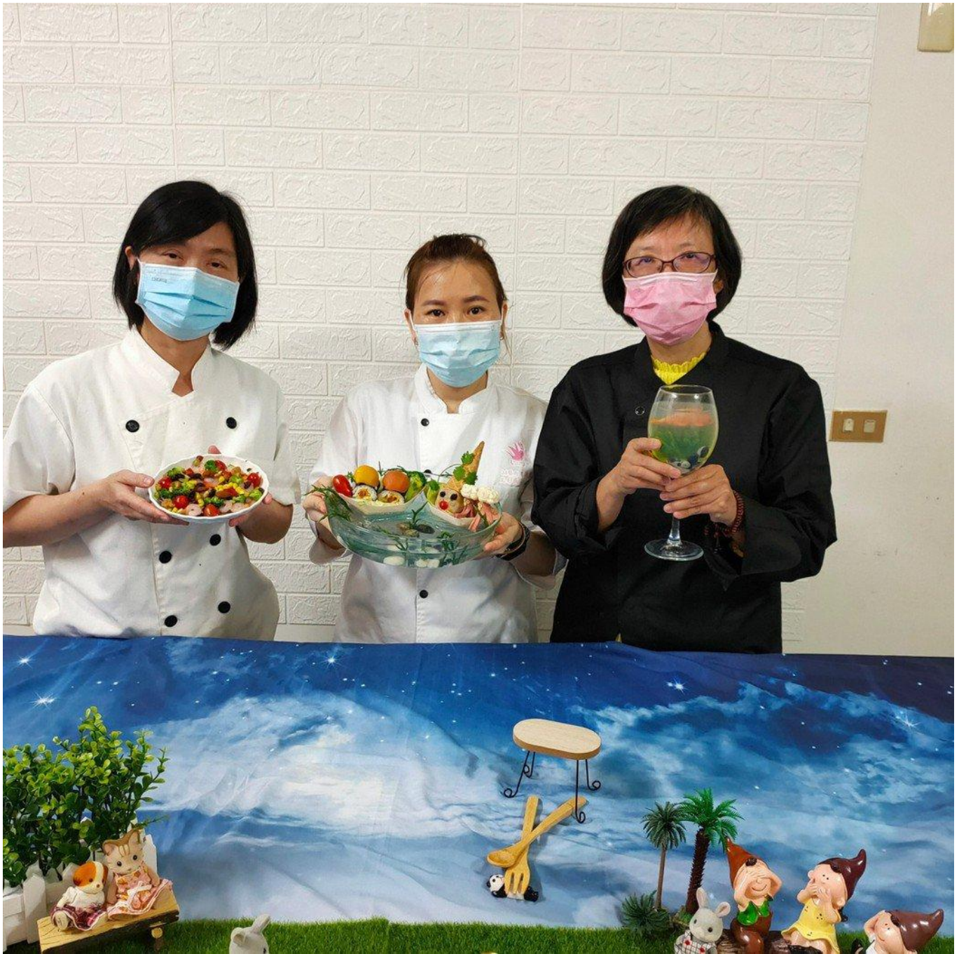
嘉藥幼保系學生在荷蘭國際餐飲挑戰賽獲得14金。