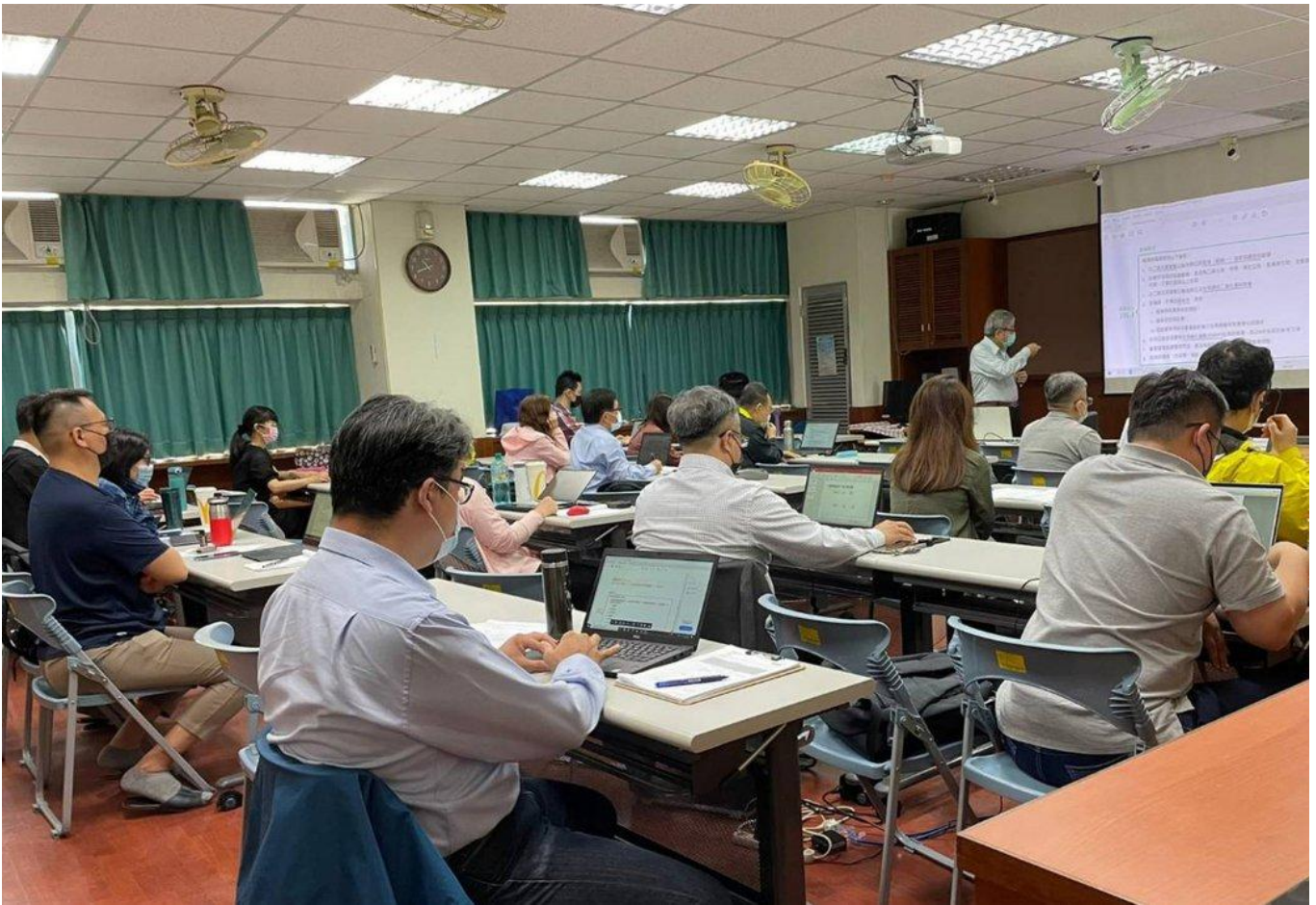
北德技術監護顧問股份有限公司在嘉藥開設相關課程。