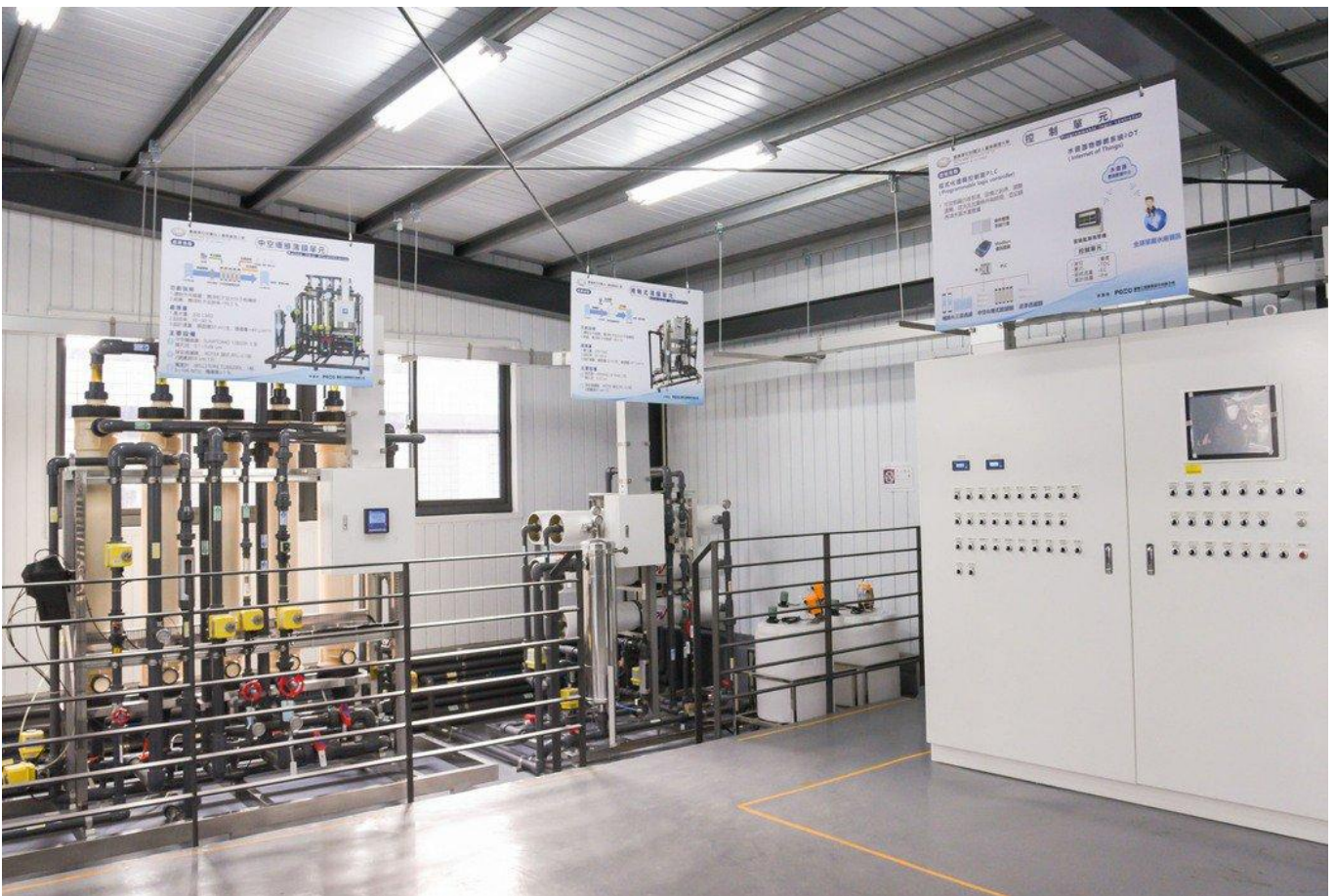
嘉藥校園設立再生水類產線與人才培育基地。