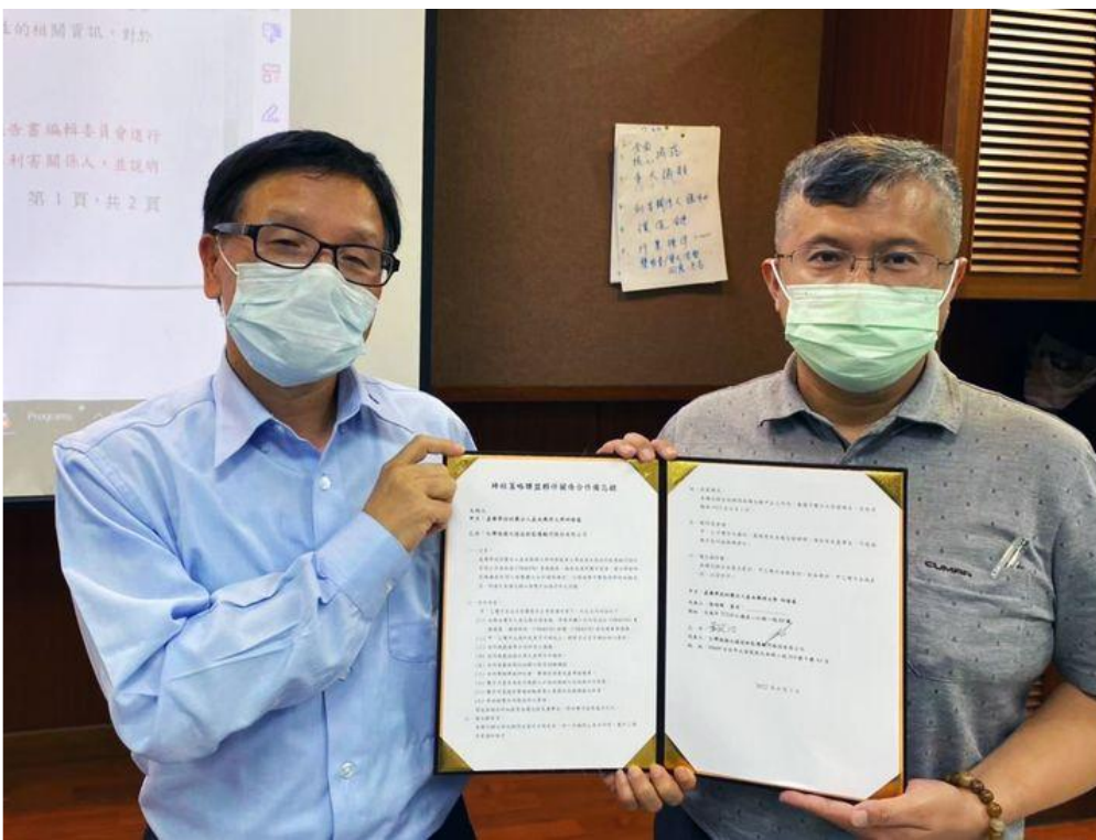
圖/ 嘉南藥理大學 Chia Nan University of Pharmacy & Science

能力，因而破壞生態平衡與自然景觀，此現象已衝擊國家與社會永續發展，使得我們在保護環境資源與管理議題上比其他國家更具迫切性。自上月「2022 ESG永續論壇-智能減碳與國際經濟發展」論壇後，嘉藥更進一步與世界級夥伴-北德公司簽訂產學合作備忘錄，除了展現培育ESG專業力的決心外，也希冀在北德協助下，完成企業ESG報告書與碳盤查等查證的一條龍產學合作服務，與企業一起努力、邁向地球與人類的共同永續發展。