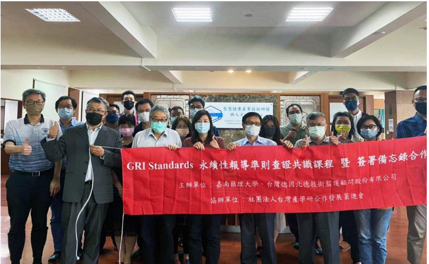
嘉藥與台灣德國北德技術監護顧問股份有限公司簽署產學合作備忘錄。