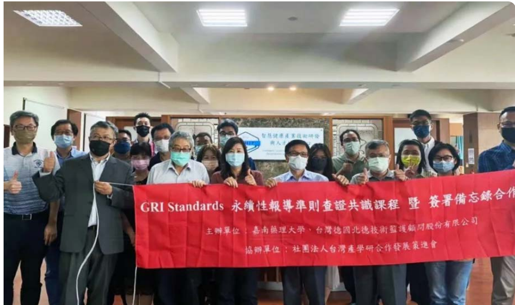
嘉南藥理大學與北德公司產學合作。