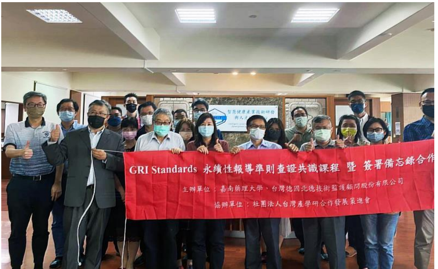
嘉藥與台灣德國北德技術監護顧問股份有限公司簽署產學合作備忘錄

(中央社訊息服務20220616 13:57:50)嘉南藥理大學日前與台灣德國北德技術監護顧問股份有限公司(TUV NORD Taiwan Co., Ltd.) 共同簽署產學合作備忘錄，成為台灣北德公司的第一家學術界合作夥伴，借重其超過150年來，在全球對產品、商業流程的驗證等專業服務經驗，結合嘉藥深耕台灣環境資源的實務背景及社團法人台灣產學研合作發展策進會在地企業基礎，希望能提供ESG相關產學一條龍服務，加速協助企業佈局的永續發展，如企業碳盤查、淨零碳排規劃、綠色設計等建置工作。