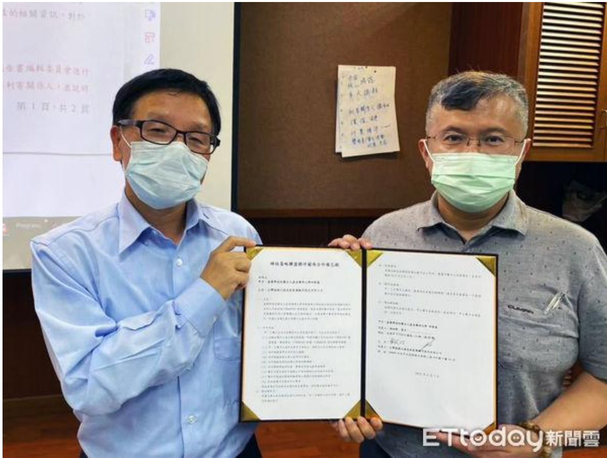
▲嘉南藥理大學日前與台灣德國北德技術監護顧問股份有限公司，共同簽署產學合作備忘錄。