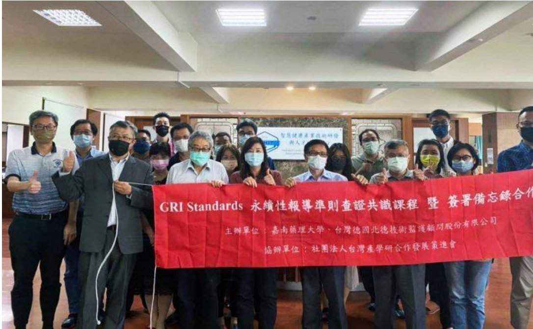
嘉南藥理大學與北德公司產學合作。