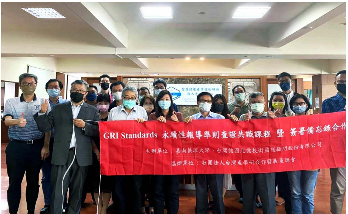
圖說：嘉南藥理大學與TUV-NORD北德技術監護顧問公司合作，簽定產學合作備忘錄。

【記者黃鐘毅 / 台南報導】嘉南藥理大學與台灣德國北德公司共同簽署產學合作備忘錄，成為該公司的第一家學術界合作夥伴，借重其超過150年來，在全球對產品、商業流程的驗證等專業服務經驗，結合嘉藥深耕台灣環境資源的實務背景及台灣產學研合作發展策進會在地企業基礎，希望能提供ESG相關產學一條龍服務，加速協助企業佈局的永續發展。