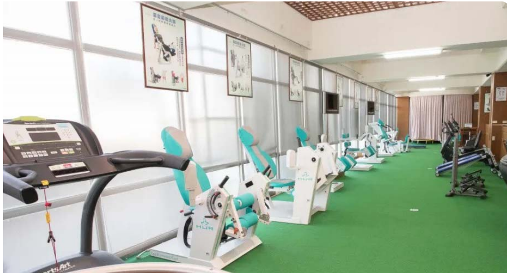
嘉南藥理大學的「銀髮健身俱樂部」，歡迎銀髮來運動健身。