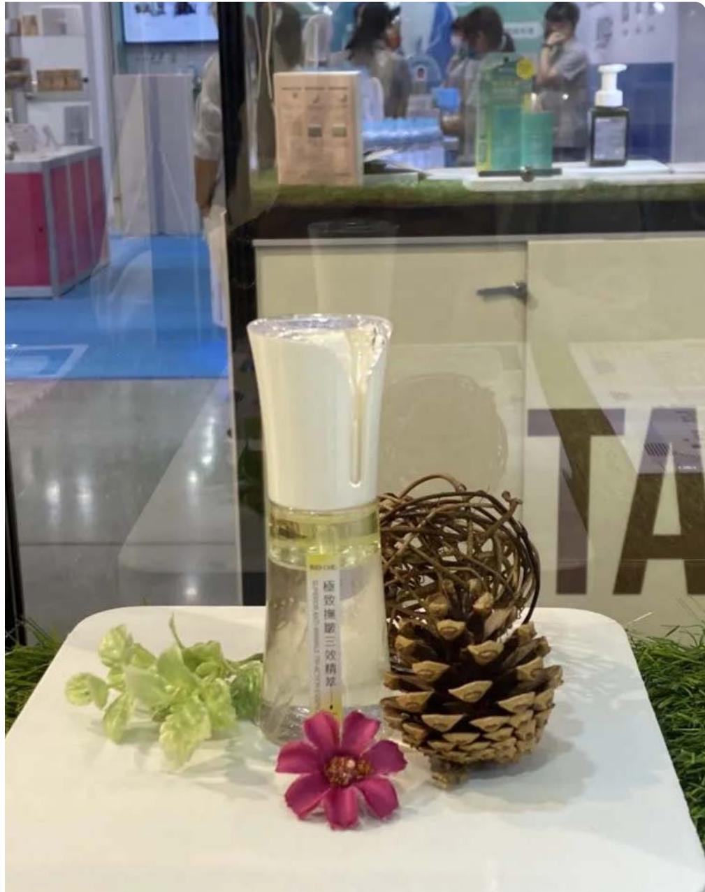
嘉藥以「彩虹米精萃」專利性成分開發的「時光魔力系列-極致撫皺三效精萃」，獲選嘉誠微笑盃競賽中的配方設計獎創新社會組銀牌。