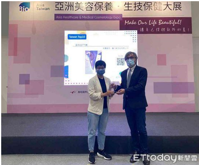
▲嘉南藥理大學化粧品應用與管理系，參加SMILE UP嘉誠微笑盃競賽，獲選配方設計獎創新社會組第2名，再次為嘉藥研發成果商品化邁出一大步。