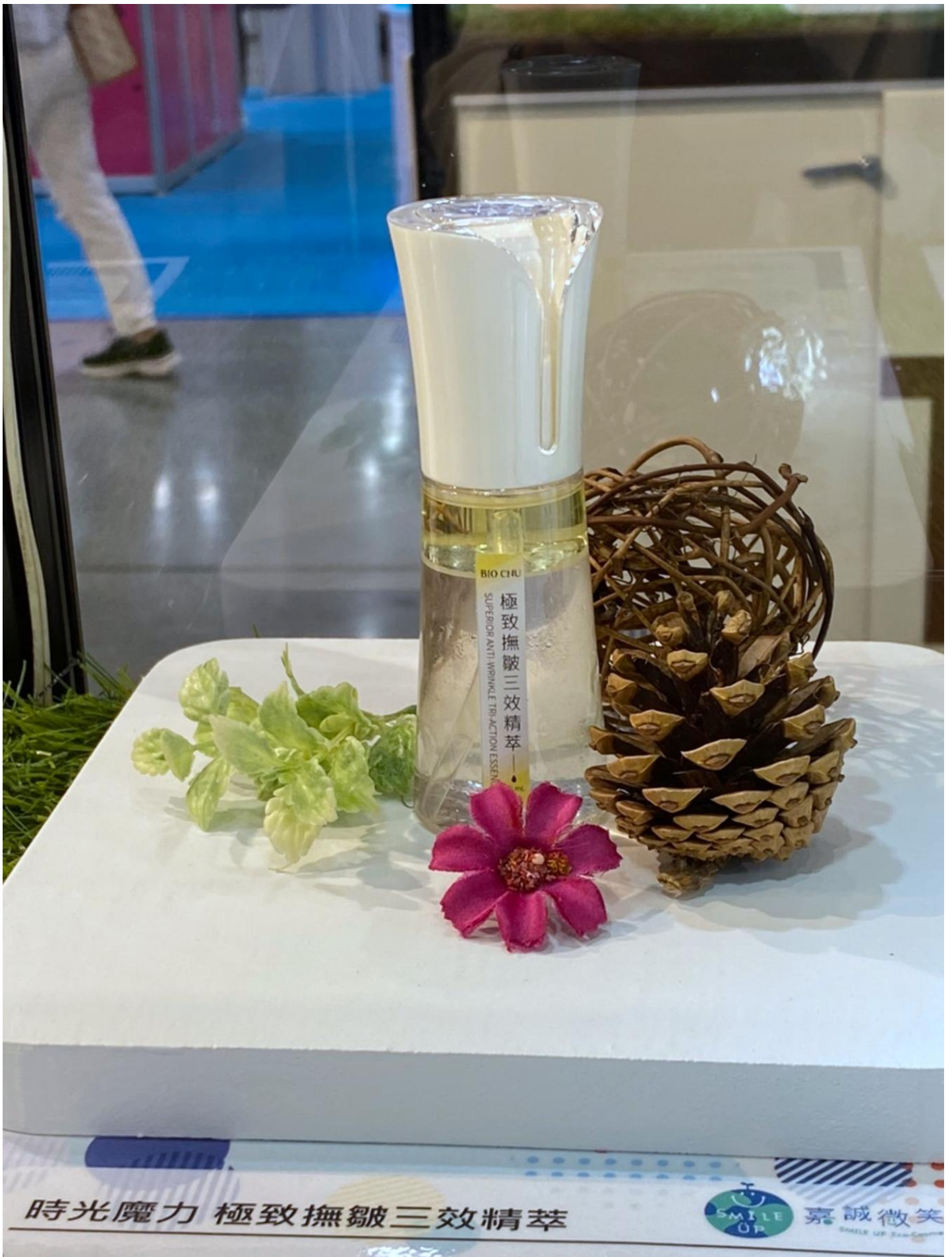
圖說：嘉藥用「彩虹米精萃」專利性成分開發的「時光魔力系列-極致撫皺三效精萃」。