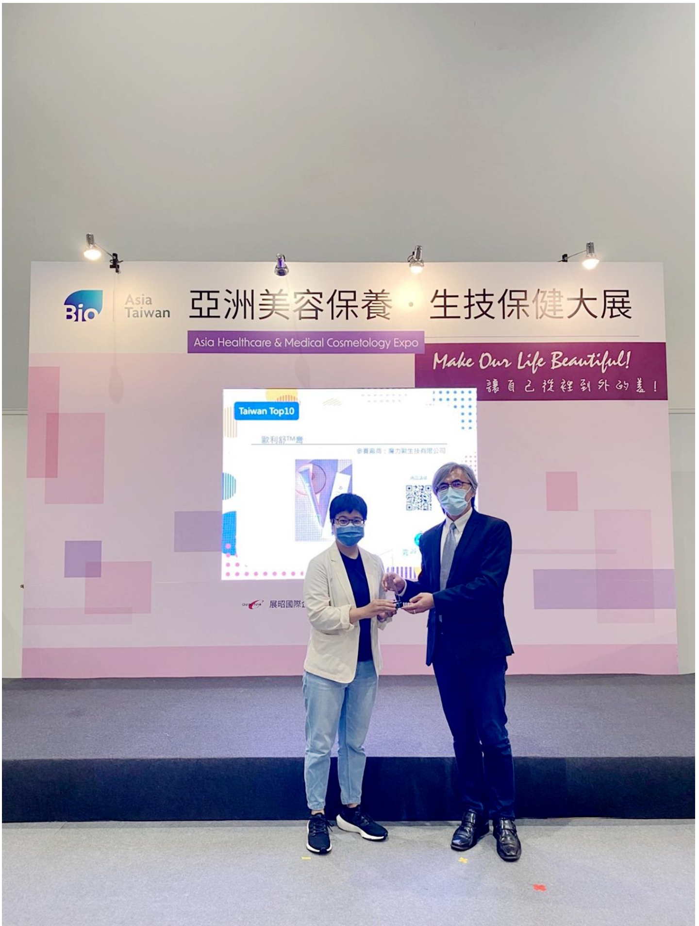
圖說：嘉藥粧品系榮獲微笑盃配方設計獎創新社會組第二名。