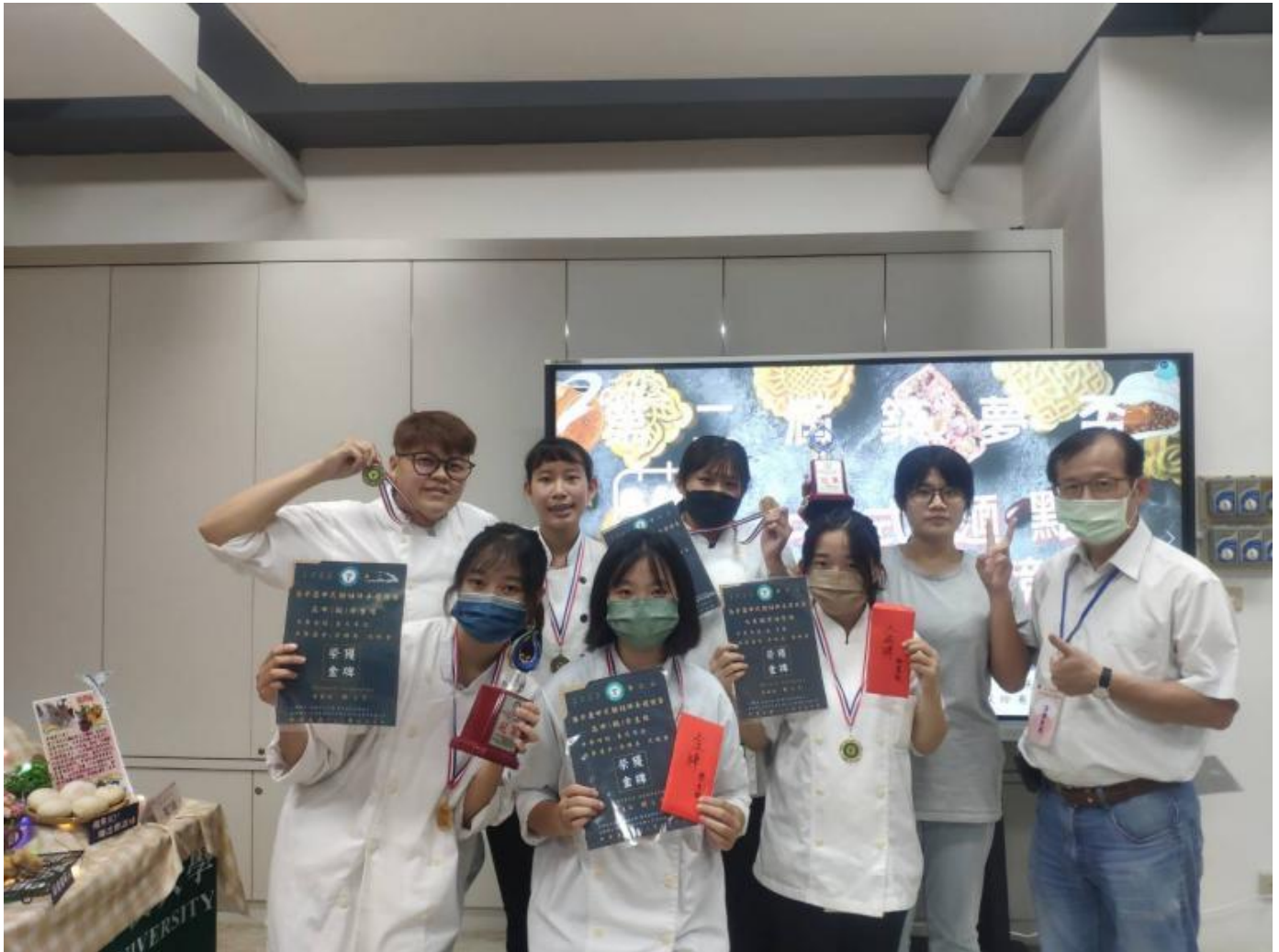
▲嘉藥畢業系友指導高職團隊榮獲高中職組金牌。