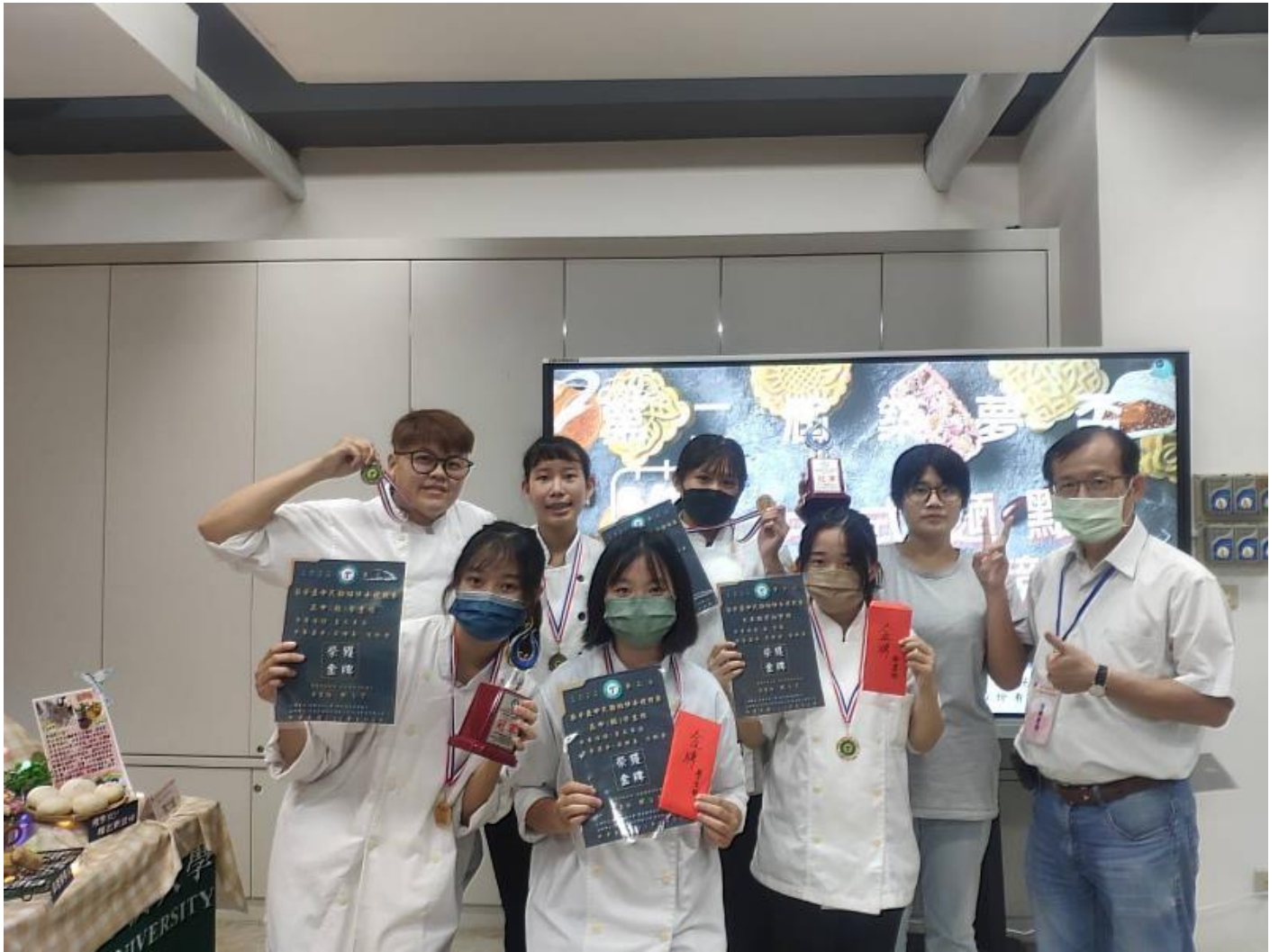
嘉藥餐旅系2022第二屆築夢盃中式麵點伴手禮競賽獲得佳績