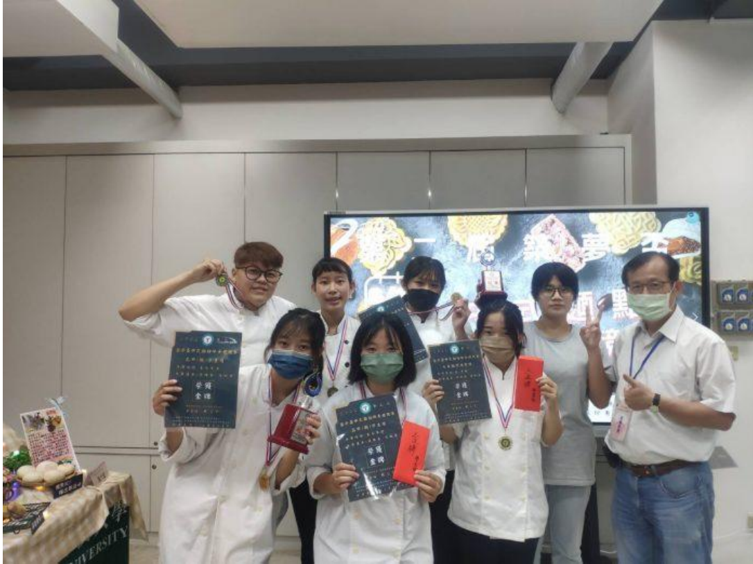
嘉藥餐旅系學生及系友在第二屆築夢盃中式麵點伴手禮競賽獲得佳績。