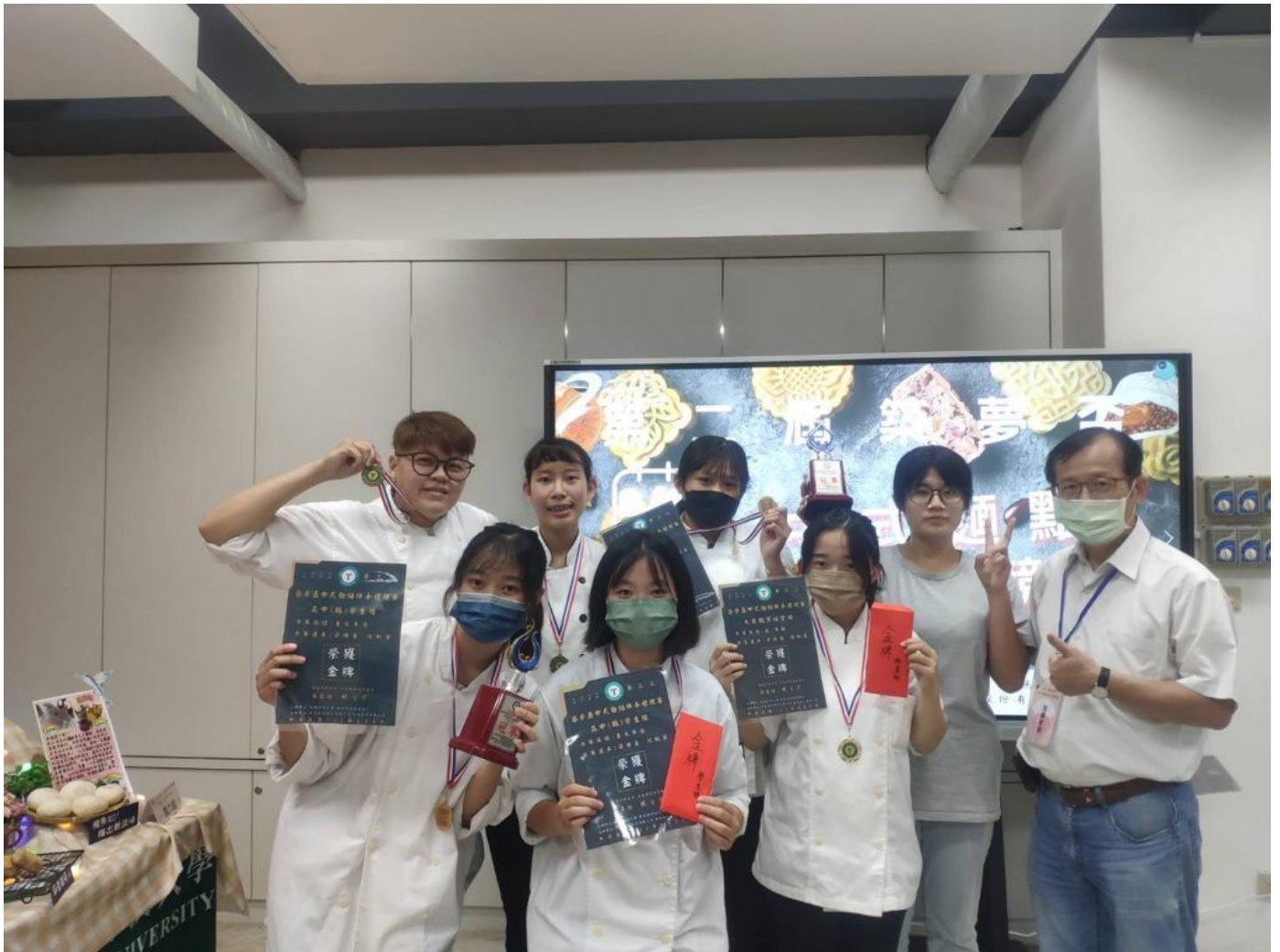
嘉藥餐旅系2022第二屆築夢盃中式麵點伴手禮競賽獲得佳績。

嘉南藥理大學餐旅管理系於日前參加「2022第二屆築夢盃中式麵點伴手禮競賽」勇奪大專社會組金牌、銅牌，與畢業系友指導的高職團隊榮獲高中職組金牌，嘉藥校方表示，未來也會在培育優秀餐飲業人才之餘，向下傳承扎根，持續創造優異成績。