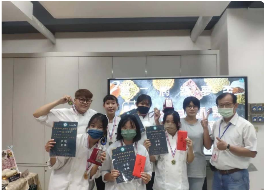
嘉藥餐旅系學生及系友在第二屆築夢盃中式麵點伴手禮競賽獲得佳績。(記者黃文記攝)