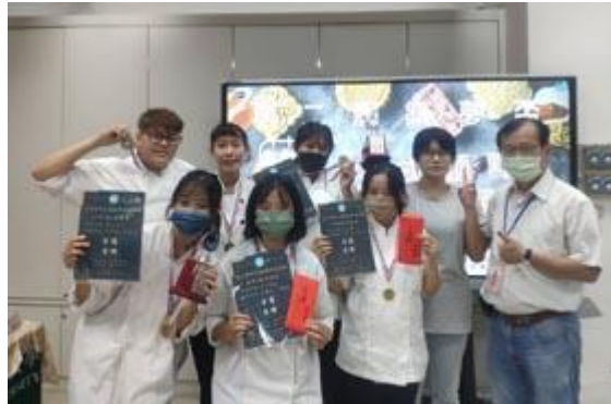
嘉藥餐旅系2022第二屆築夢盃中式麵點伴手禮競賽獲得佳績。

【記者孫宜秋 / 南市報導】嘉南藥理大學餐旅管理系於日前參加「2022第二屆築夢盃中式麵點伴手禮競賽」勇奪大專社會組金牌、銅牌，及由畢業系友指導的高職團隊榮獲高中職組金牌，證明該系在培育優秀餐飲業人才之餘，向下傳承扎根，持續創造優異成績。