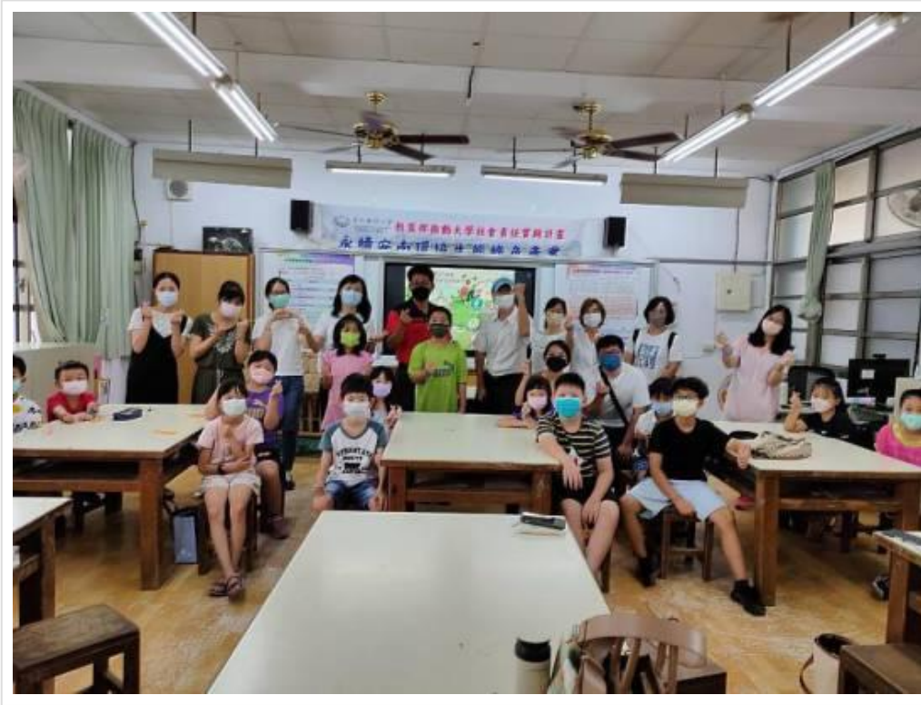
▲嘉藥環境學院與南興國小合辦「環境教育繪本工作坊」達到環境教育從小紮根

(中央社訊息服務20220727 11:00:56)嘉南藥理大學環境永續學院7/25-26於台南市安南區南興國小辦理「安南環境教育學堂～環境教育繪本工作坊」，結合在地的機關、學校、企業、社區等單位，共同執行教育部大學社會責任實踐計畫—「永續安南環境生態與綠色產業」計畫，深化民眾對在地環境生態與產業發展的關懷與重視，達到「優質教育」之永續發展目標(SDGs)。