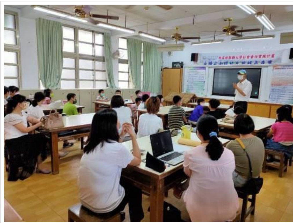
▲嘉藥執行教育部計畫辦理「安南環境教育學堂」邀請專家學者及社區耆老一同分享