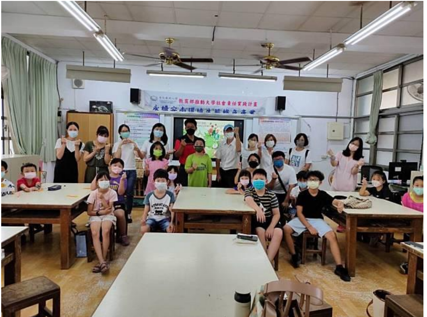
嘉南藥理大學環境永續學院開辦環境教育學堂。