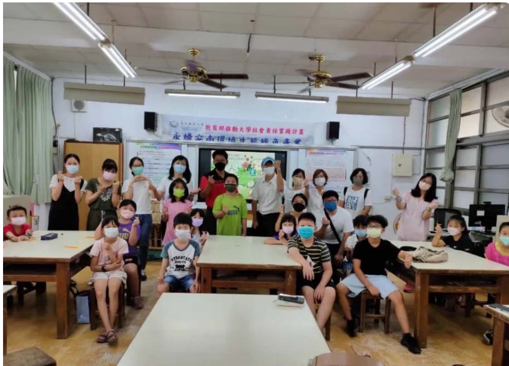
嘉南藥理大學環境永續學院開辦環境教育學堂。