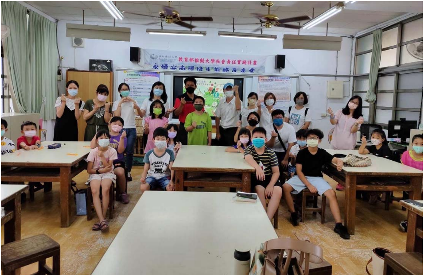
圖說：嘉藥環境學院辦「安南環境教育學堂」活動，邀請專家學者及社區耆老一同分享。

【記者黃鐘毅 / 台南報導】嘉南藥理大學環境永續學院今26日在南興國小舉辦「安南環境教育學堂～環境教育繪本工作坊」，結合在地的機關、學校、企業、社區等單位，共同執行教育部大學社會責任實踐計畫—「永續安南環境生態與綠色產業」計畫，深化民眾對在地環境生態與產業發展的關懷與重視，達到「優質教育」之永續發展目標(SDGs)。