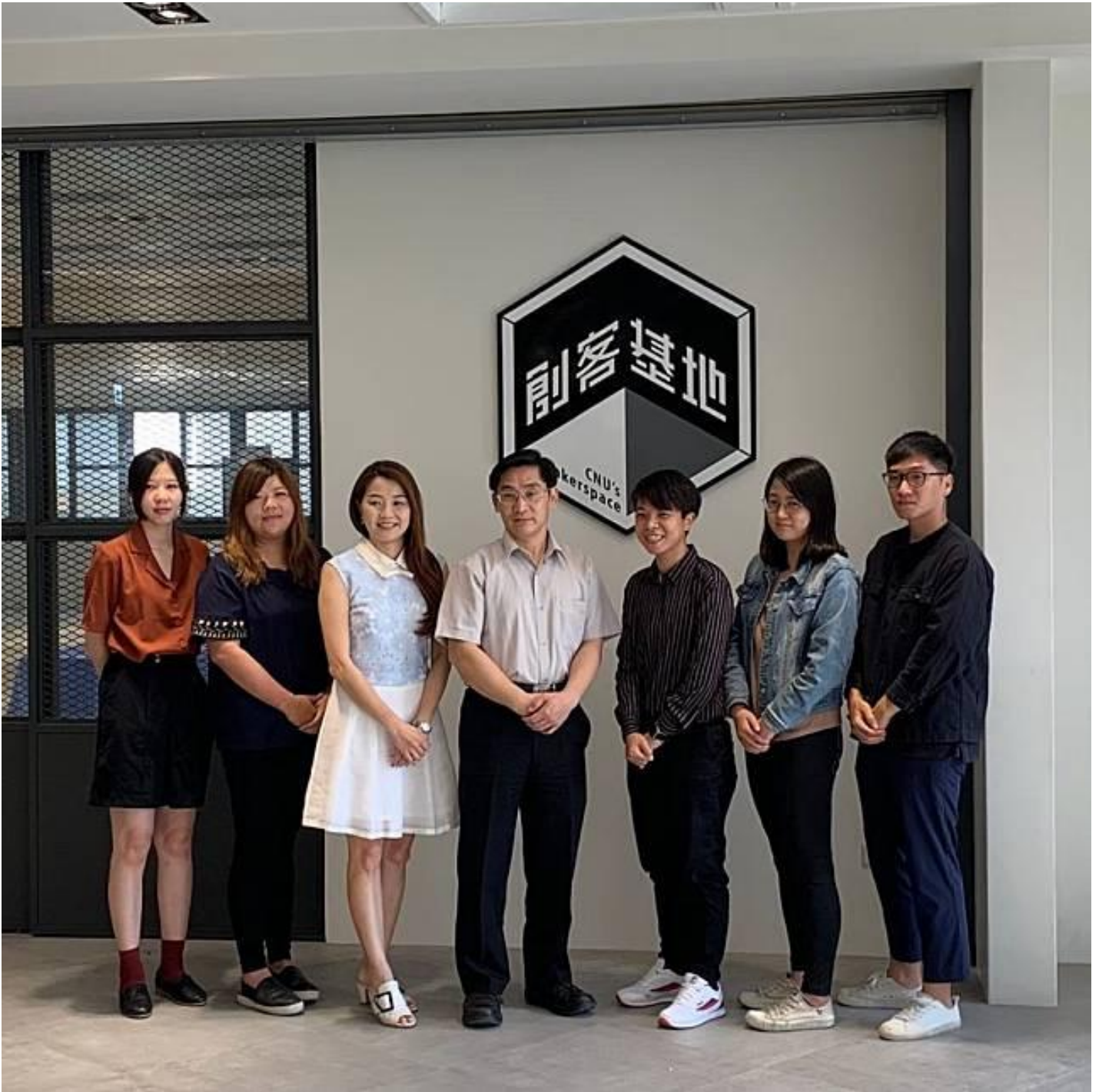
嘉藥創新育成中心榮獲經濟部金育獎雙項大獎。