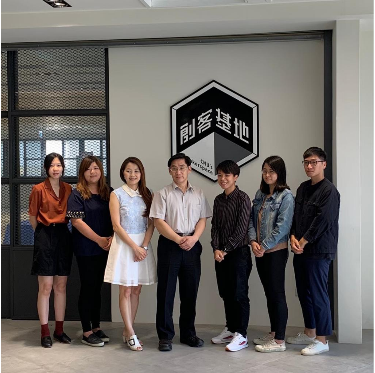
嘉南藥理大學研究發展處創新育成中心榮獲績優創育機構及績優經理人獎雙項肯定。

經濟部中小企業處日前公布111年度「金育獎-績優創育機構及績優經理人」得獎名單，嘉南藥理大學研究發展處創新育成中心榮獲績優創育機構及績優經理人獎雙項肯定，金育獎旨在表揚具高度服務熱忱及輔導能量之創育機構及經理人，肯定與鼓勵其在輔導及服務中小企業卓越表現，此次一舉獲得雙料獎項，足以顯示嘉藥培育企業能量受到肯定。