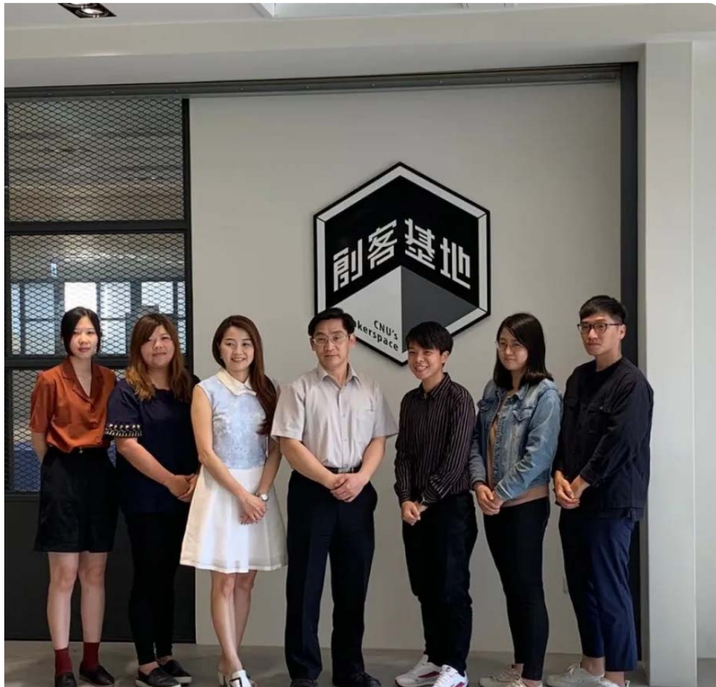
嘉藥創新育成中心榮獲經濟部金育獎雙項大獎。