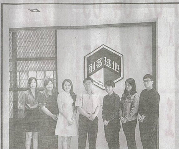
嘉藥培育企業創新轉型有成，榮獲經濟部金育獎雙項大獎。

【記者孫曉倫／南市報導】經濟部中小企業處日前公布二二年度「金育獎」績優創育機構及績優經理人」得獎名單，嘉南藥理大學研究發展處創新育成中心榮獲績優創育機構及績優經理人獎雙項肯定，金育獎旨在表揚具高度服務熱忱及輔導能量之創育機構及經理人，肯定與鼓勵其在輔導及服務中小企業卓越表現，此次一舉獲得雙料獎項，足以顯示嘉藥培育企業能力受到肯定。