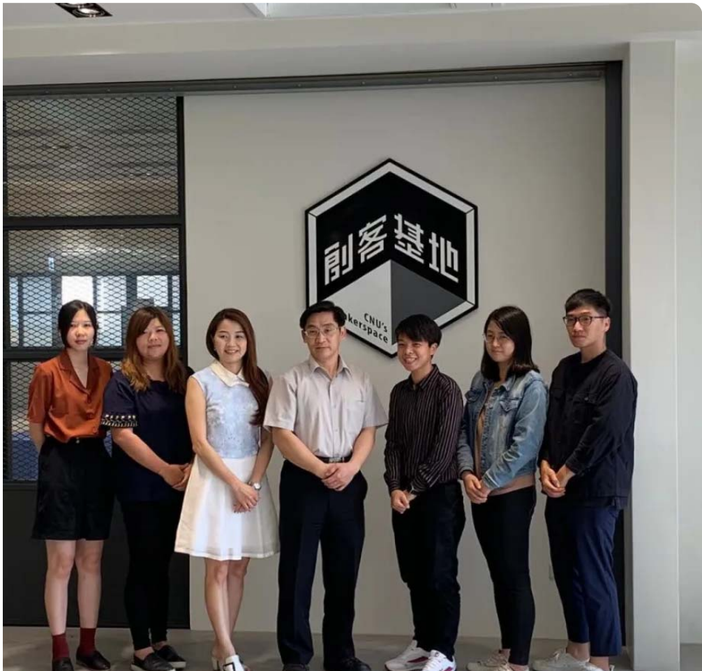
嘉藥創新育成中心榮獲經濟部金育獎雙項大獎。