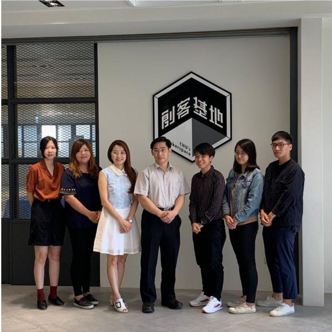
嘉藥創新育成中心榮獲經濟部金育獎雙項大獎。