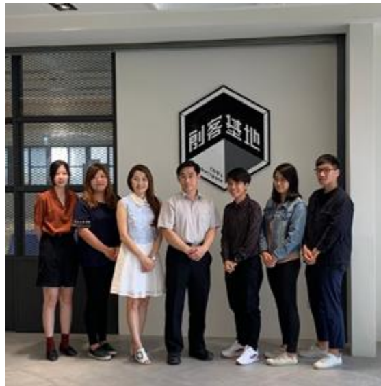
嘉藥培育企業創新轉型有成，榮獲經濟部金育獎雙項大獎。

【記者孫曉倫 / 南市報導】經濟部中小企業處日前公布111年度「金育獎-績優創育機構及績優經理人」得獎名單，嘉南藥理大學研究發展處創新育成中心榮獲績優創育機構及績優經理人獎雙項肯定，金育獎旨在表揚具高度服務熱忱及輔導能量之創育機構及經理人，肯定與鼓勵其在輔導及服務中小企業卓越表現，此次一舉獲得雙料獎項，足以顯示嘉藥培育企業能量受到肯定。