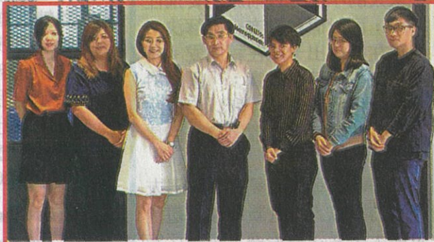
嘉藥培育企業創新轉型有成，榮獲經濟部金育獎雙項大獎！