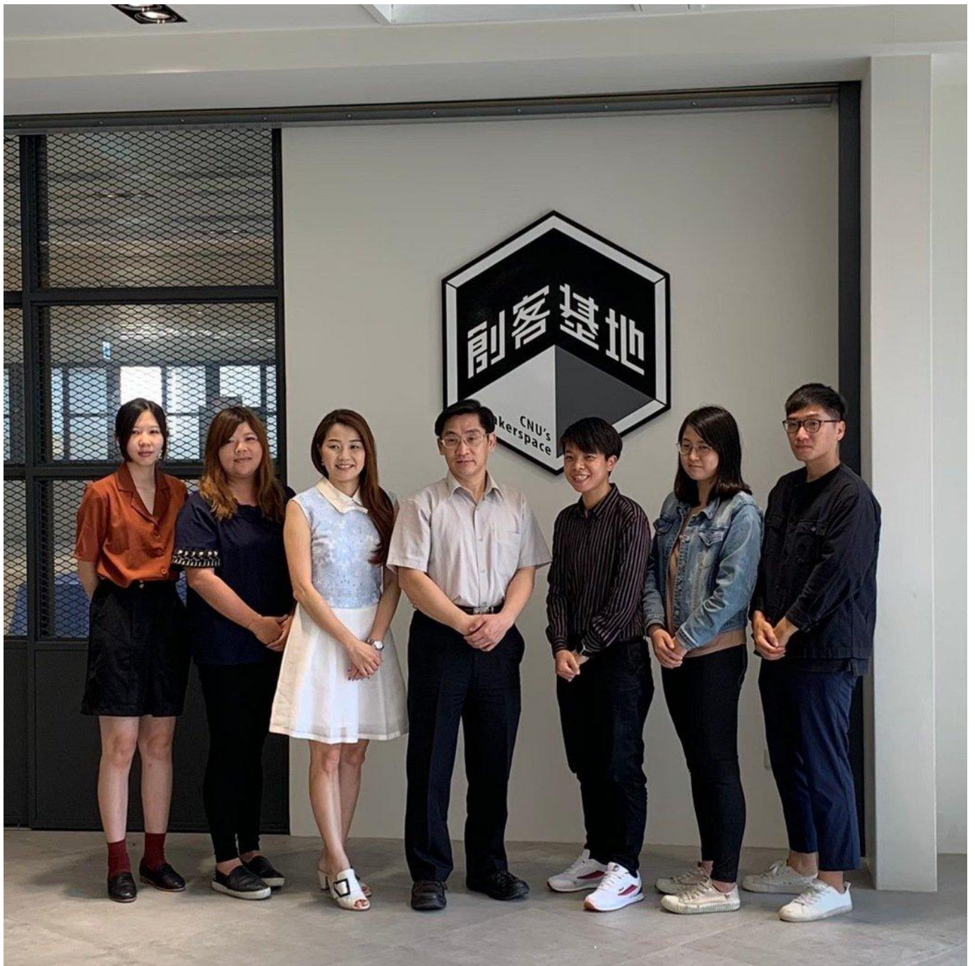
嘉藥培育企業創新轉型有成 榮獲經濟部金育獎雙項大獎。