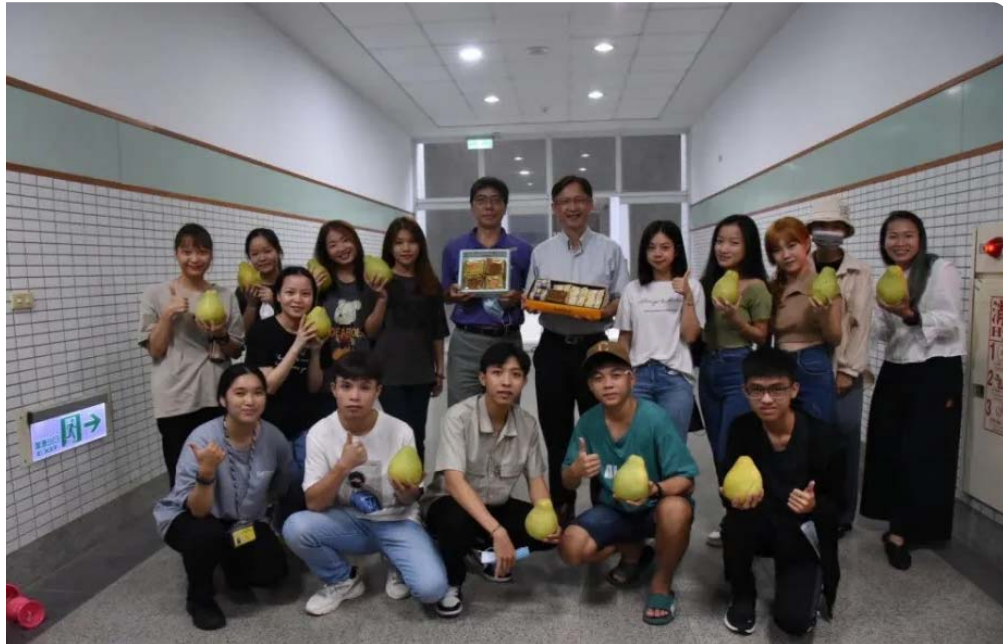
嘉南藥理大學為國際生舉辦一場快閃慶中秋，人人都有柚子、月餅一同分享。