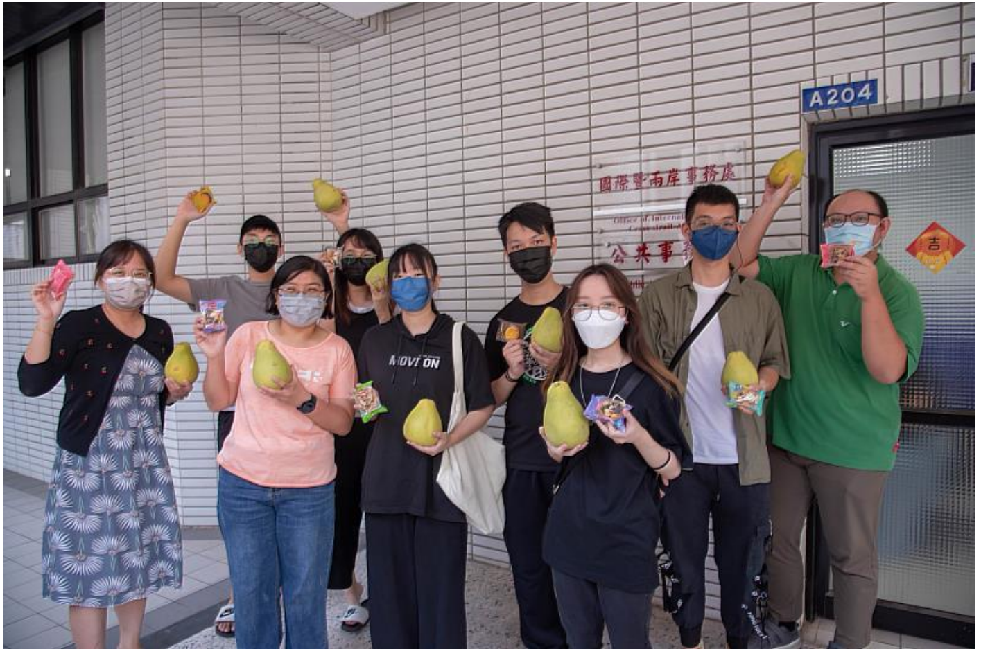
嘉藥港澳國際生謝謝學校準備中秋應景物品讓他們在異鄉也覺得很溫暖