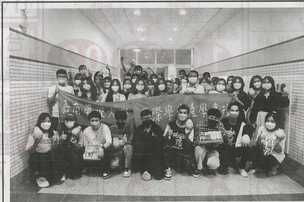
嘉藥準備道地的麻豆柚子等中秋禮品，讓同學感受滿滿祝福及如同在家鄉過節的感覺。

【記者孫紹逸／南市報導】中秋月圓人團圓，嘉南藥理大學國際事務處為讓留在台灣，無法與家人團聚的國際生也感受佳節溫暖，特別準備近二百顆柚子及月餅分贈這些離鄉背井來讀書的學生，體驗台灣中秋的過節文化外，也分享在地濃濃人情味。 春節、端午及中秋是台灣三大節慶，中秋節更是闔家團圓的節日，對身處台灣的外國學生來說，可能因為疫情或剛成為大學新鮮人而無法返國團圓，因此，嘉藥國際事務處為讓這群初次來台灣的國際越南學生瞭解在地文化，體驗傳統台灣過中秋節的氣氛，特別舉辦「中秋快閃活動」，每位同學都可以獲得學校準備台南麻豆的柚子，現場還準備了不同的台式月