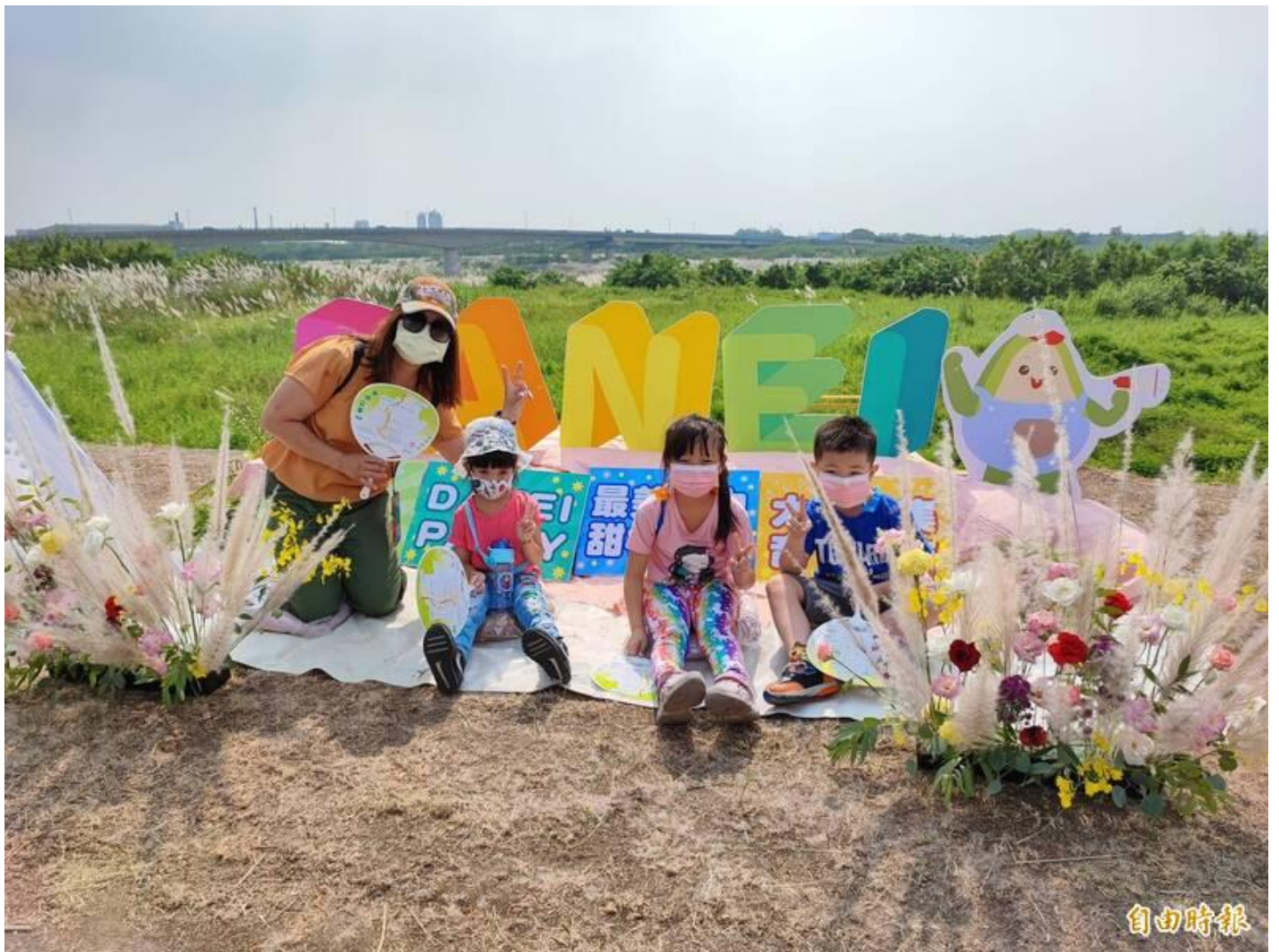
台南大內區曾文溪畔甜根子草盛開，公所舉辦雪花季活動，行銷地方觀光。