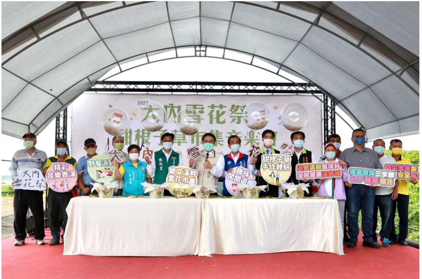
圖說：市長黃偉哲出席大內雪花祭，邀請人來探訪大內獨特的人文風情，感受大內之美。

【記者黃鐘毅 / 台南報導】「2022大內雪花祭-甜根子草市集音樂會暨政令宣導」活動，今1日下午在大內橋旁曾文溪畔石子瀨水防道路熱鬧舉行，市長黃偉哲、立委郭國文等民代特到場參加，開心與現場民眾一起賞景，黃偉哲特別推薦甜根子草花海是可媲美國外楓紅的台南秋季最美觀光景點。