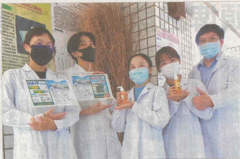
→嘉藥師生將於大內雪花祭帶領民眾DIY甜根子草洗手乳及沐浴乳。

產品開發」列入計畫項目之一，讓甜根子草在為生質能源和商業棉紗的替代品之外，也開發出作為化粧品特色材料的新用途。