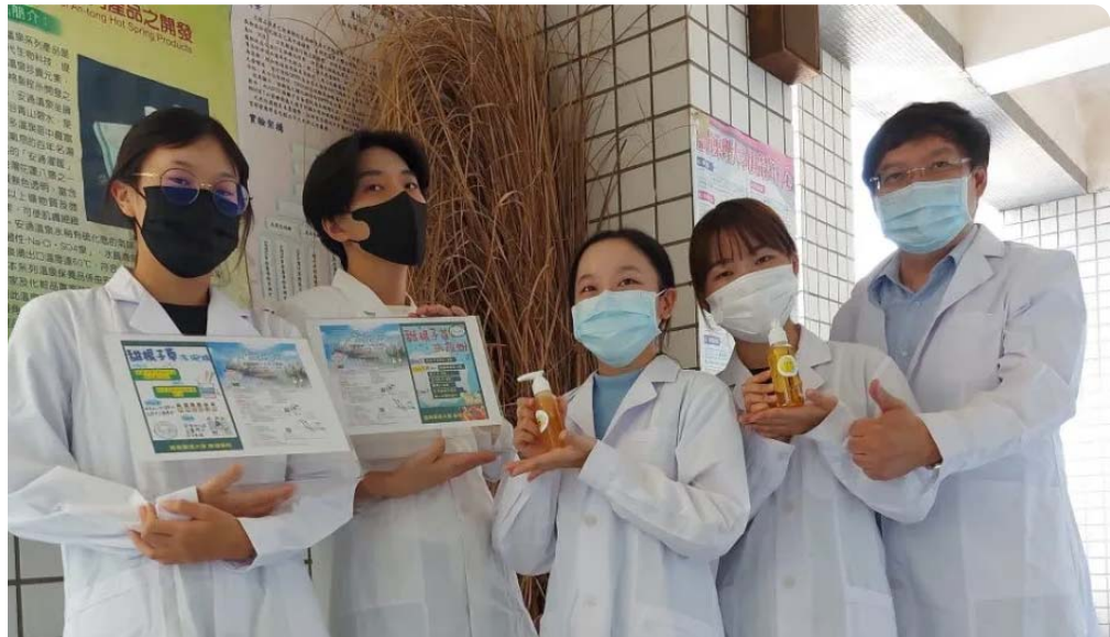
嘉藥師生將於大內雪花節帶領民眾DIY甜根子草洗手乳及沐浴乳。