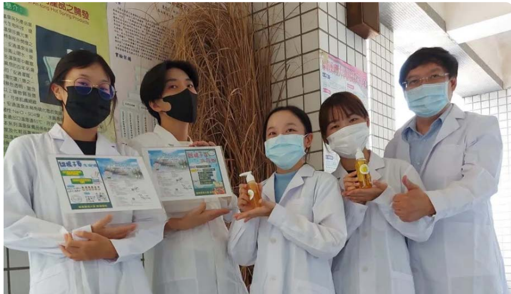
嘉藥師生將於大內雪花節帶領民眾DIY甜根子草洗手乳及沐浴乳。(記者黃文記攝)