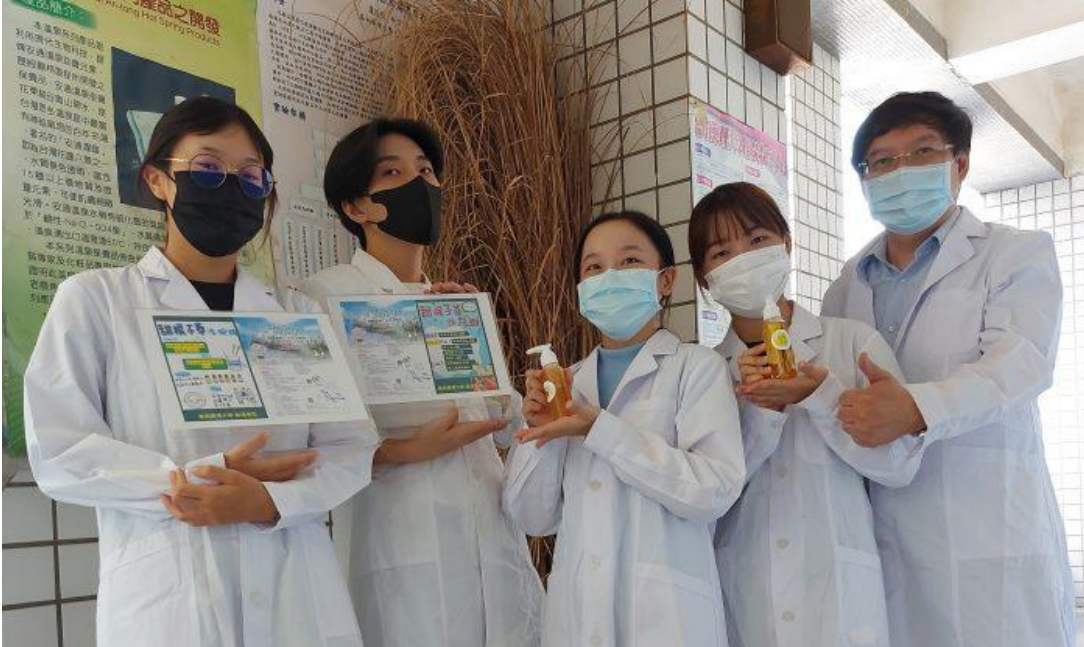
嘉藥師生將於大內雪花節帶領民眾DIY甜根子草洗手乳及沐浴乳。