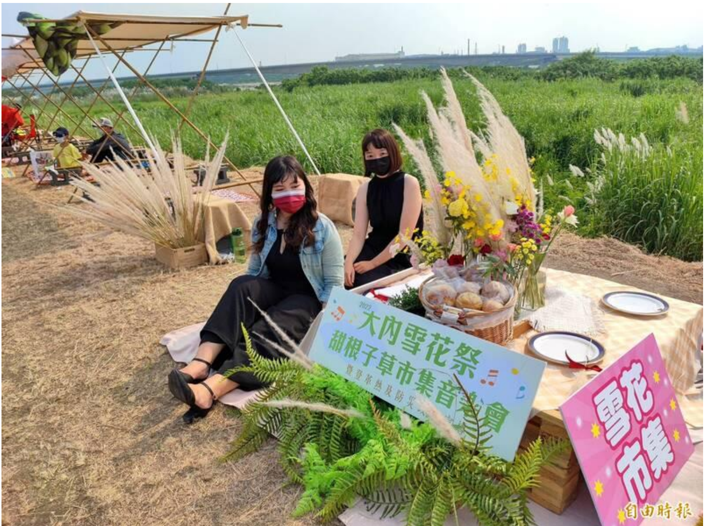
台南大內區曾文溪畔甜根子草盛開，公所舉辦雪花季活動，行銷地方觀光。

今年的活動也特地結合嘉南藥理大學社會責任USR，由化妝品應用與管理系林清宮師生團隊進駐，讓民眾體驗製作甜根子草抗菌洗手乳與甜根子草抗菌沐浴乳，將植物天然再利用，提倡資源循環、永續的理念。