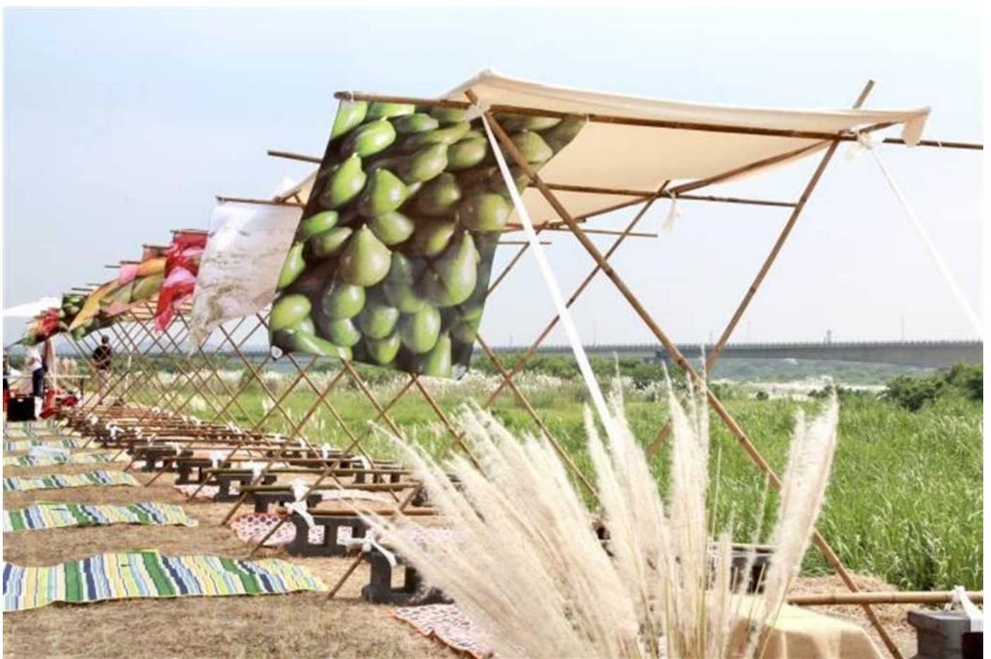
大內區公所舉辦「雪花祭」，以音樂市集、野餐派對、手作體驗等活動，讓民眾能與親朋好友在這幅美好的大自然景色中。