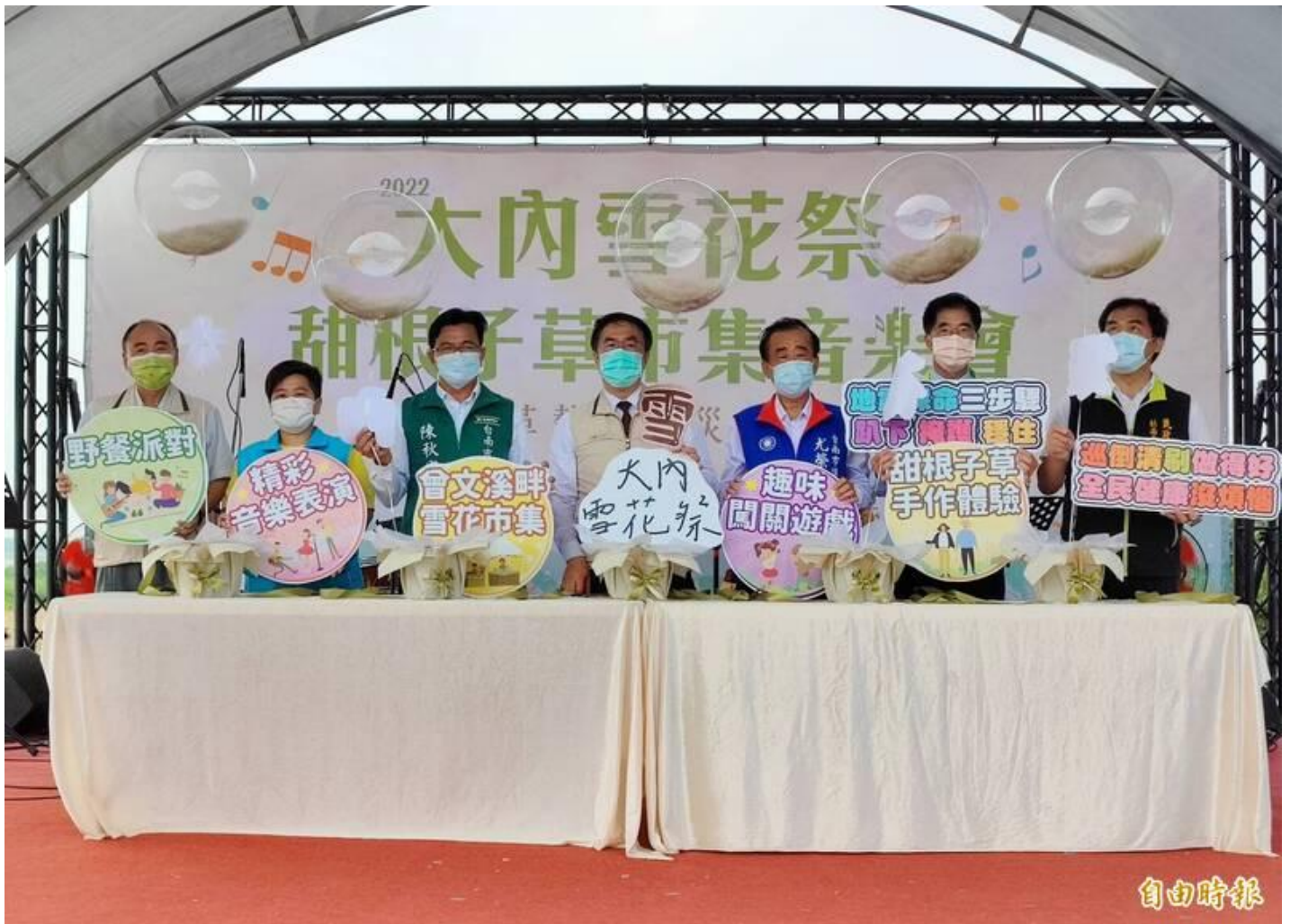
台南大內區曾文溪畔甜根子草盛開，公所舉辦雪花季活動，行銷地方觀光。