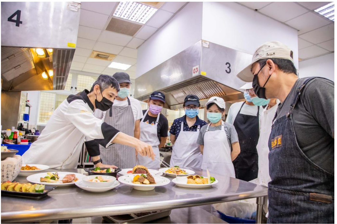
活動反應熱烈，吸引了近60位民眾報名參加。

近年來受疫情影響造成民眾失業或休無薪假者遽增，為協助待業者能以最短的時間學到專業實用的技能順利重返職場，嘉南藥理大學承接辦理勞動部失業者職業訓練班，含括專業服務、餐飲、咖啡等多樣化專業課程，都是符合產業趨勢人才需求的熱門課程，培養失業者第二專長，提升返回職場競爭力。