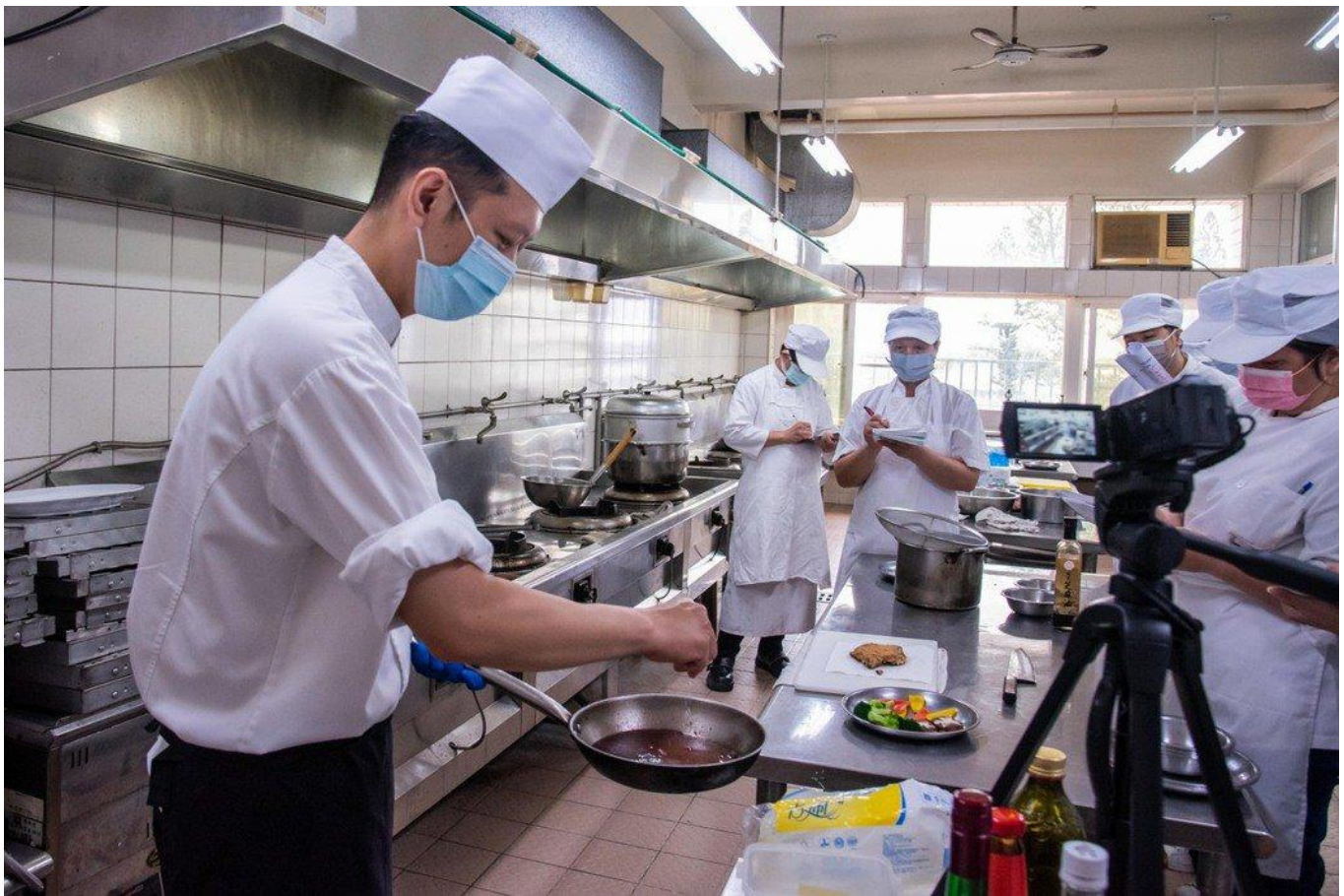
課程中學員認真作筆記學校也同步錄影提供學員課後複習使用。