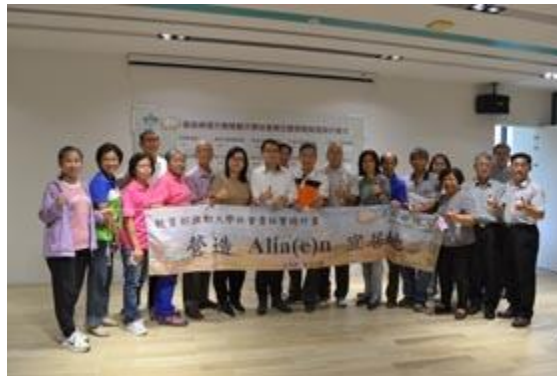
嘉藥與USR社區簽訂策略聯盟。

【記者孫宜秋 / 南市報導】嘉南藥理大學日前於該校英傑六舍二樓創客講堂辦理推動大學社會責任（USR）暨策略聯盟簽約儀式，為能善盡大學社會責任，嘉藥會中邀請多個在地社團，透過分享「大學社會責任實踐計畫」（USR計畫）的執行經驗，為USR提出貼近社區需求的願景與方針，更簽署合作意願書，為有效共享產、官、學、研、社之資源及落實在地連結、