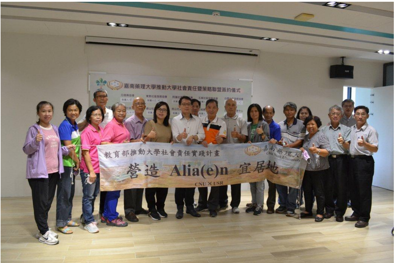
嘉藥與USR社區簽訂策略聯盟。