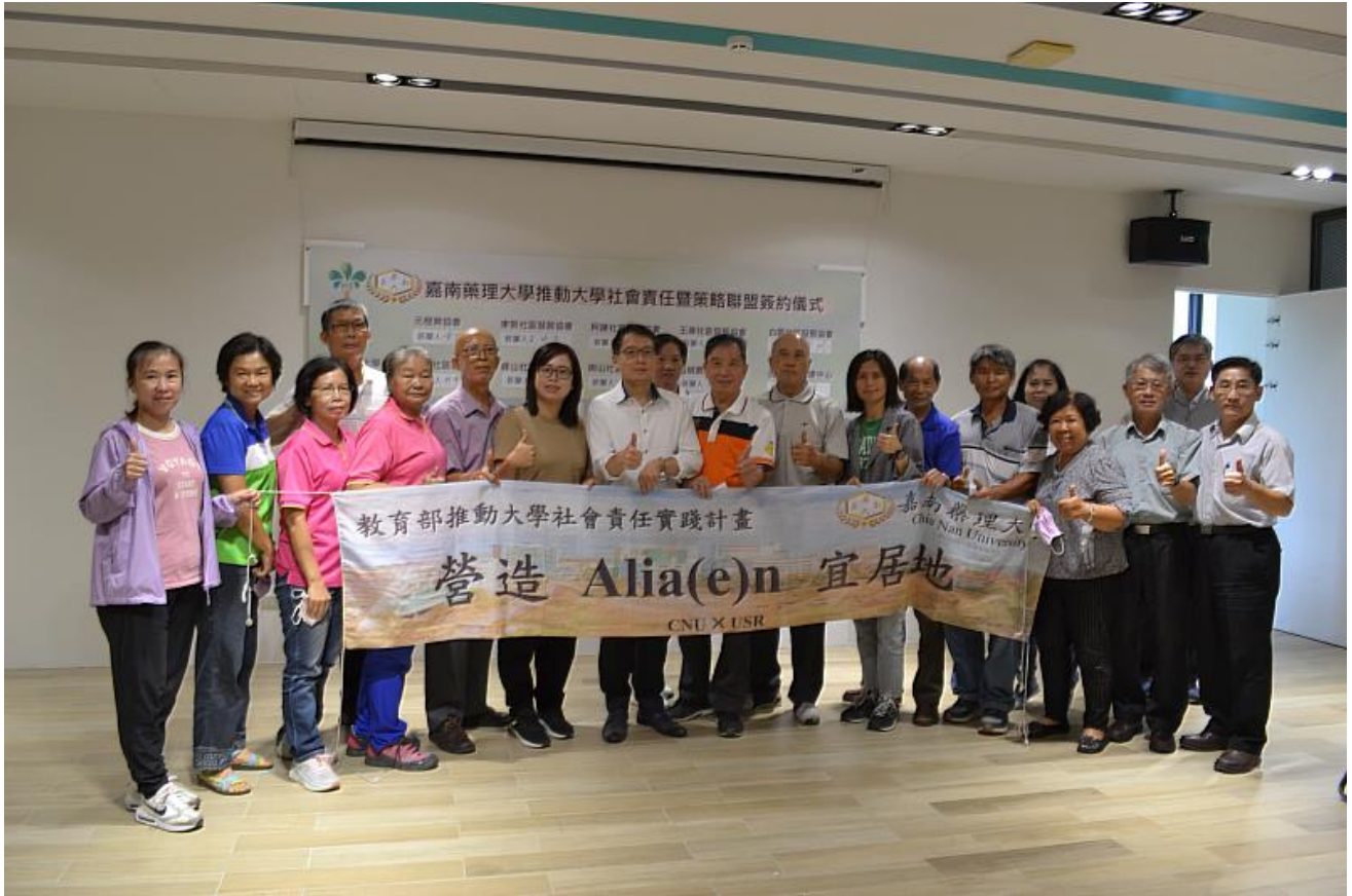
嘉藥與USR社區簽訂策略聯盟