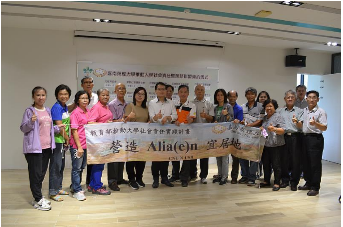
嘉藥與USR社區簽訂策略聯盟