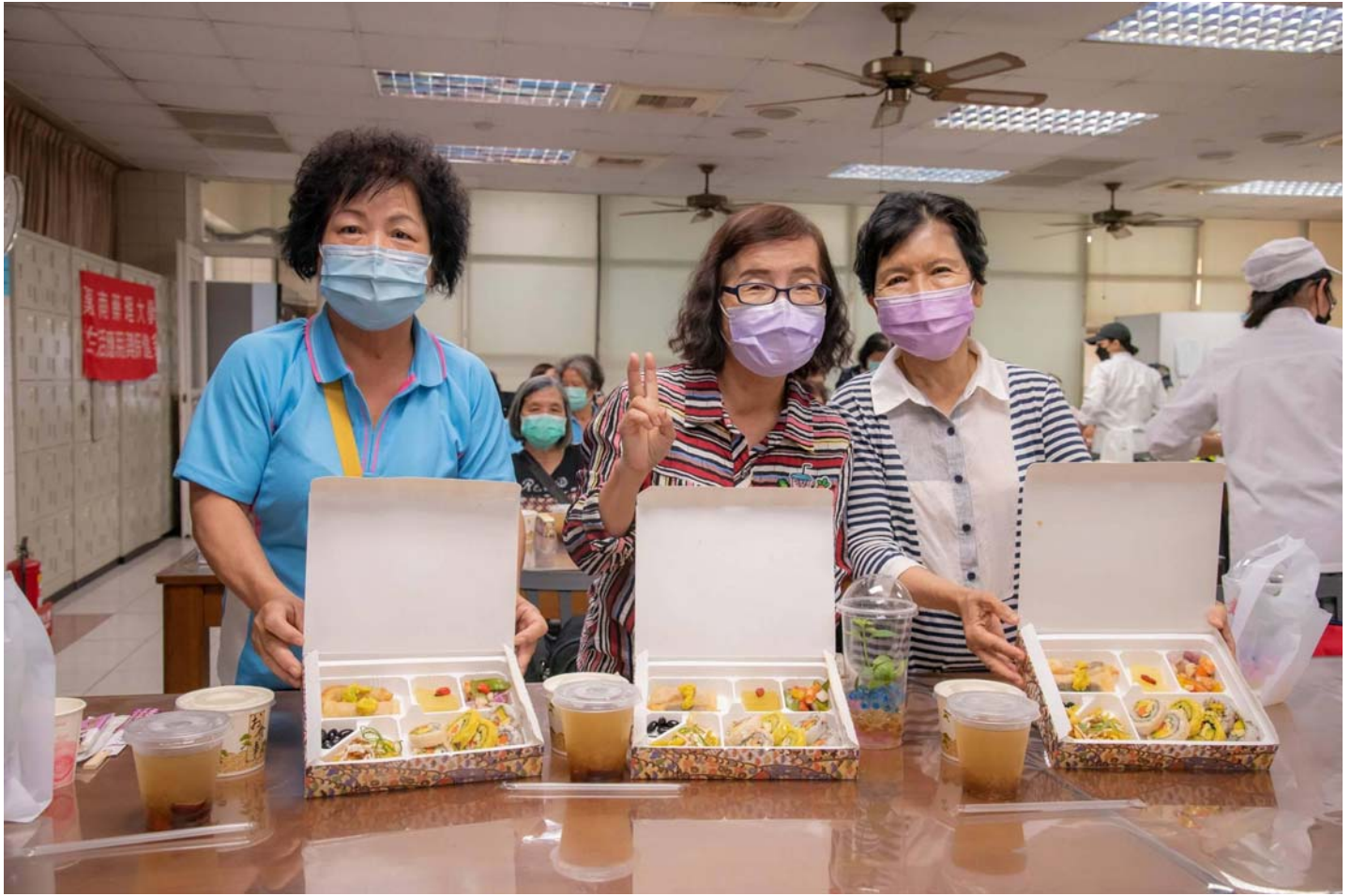
圖說：嘉藥生活系學生特別以大內地區特產製作出適合長輩的餐食。

【記者黃鐘毅 / 台南報導】嘉南藥理大學今12日邀請大內區的長輩們到學校體驗大學生日常，由該校「樂守內庄 活絡共生」USR計畫師生團隊設計了專屬高齡者的體驗課程，帶領長者們認識香藥草、簡易的DIY手作及品嚐特色風味餐，青銀共學的世代融合，長者們展現出絕佳的學習態度，積極參與各項活動，活力完全不輸年輕人。