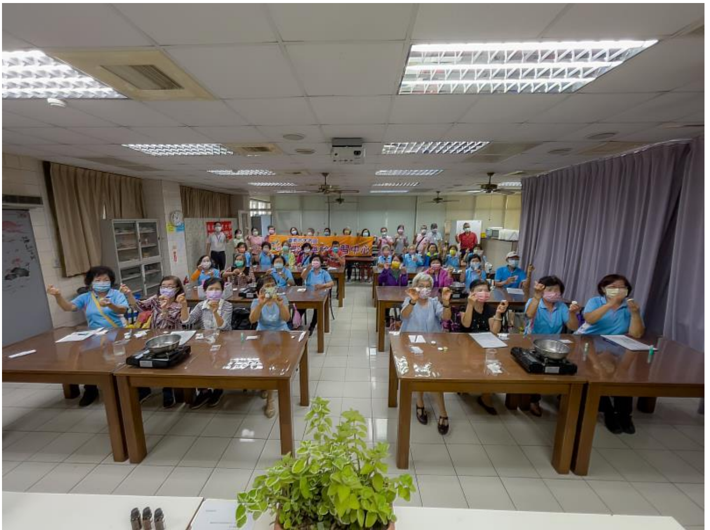
大內區長輩開心享受嘉藥一日大學生

(中央社訊息服務20221013 09:20:43)嘉南藥理大學於12日邀請台南市大內區的長輩們到學校體驗大學生日常，該校「樂守內庄 活絡共生」USR計畫師生團隊設計了專屬高齡者的體驗課程，帶領長者們認識香藥草、簡易的DIY手作及品嚐特色風味餐，青銀共學的世代融合，長者們展現出絕佳的學習態度，積極參與各項活動，活力完全不輸年輕人，最後讓阿公阿嬤們穿上學士袍一起合影留念，為一日大學生體驗劃下難忘的句點。