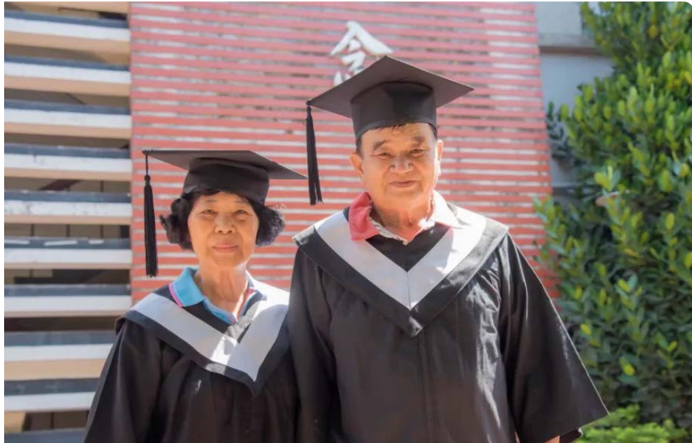
嘉南藥理大學讓阿公、阿嬤們穿上學士袍一起合影留念。