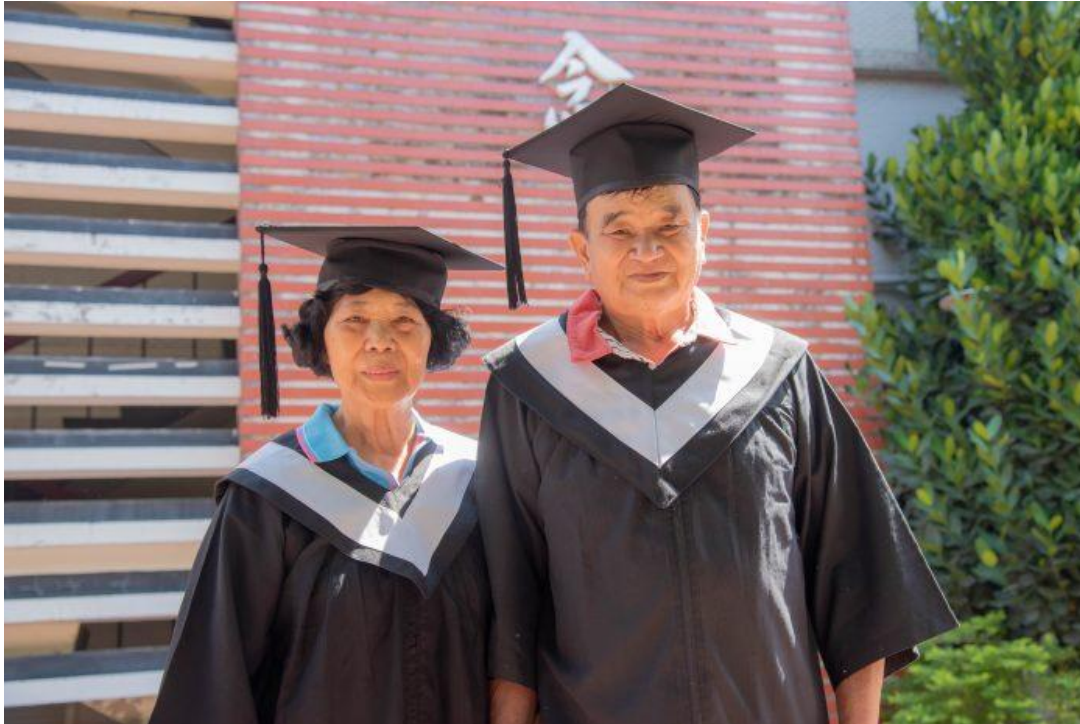
嘉南藥理大學讓阿公、阿嬤們穿上學士袍一起合影留念。