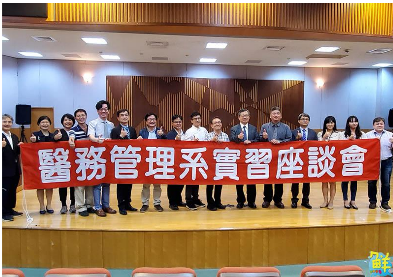
▲參與「2022醫務管理實習教育經驗分享論壇」的專家學者合影