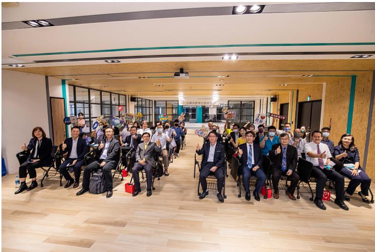
嘉藥攜手台灣產學研合作發展策進會及北中南技專校院、國內外知名產業成立「ESG永續發展產學研合作平台」