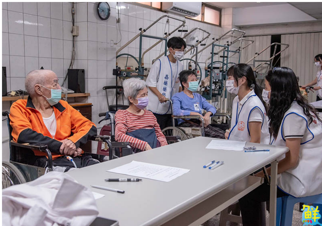
▲嘉藥藥學系社區衛教活動陪伴長者聊天唱歌