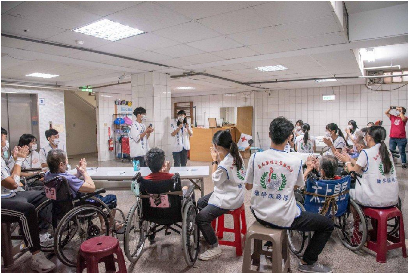
嘉藥學生以台語劇方式教導長輩在日常預防跌倒和三高。