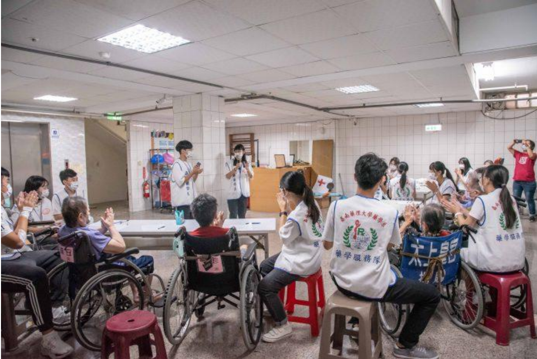
嘉藥藥學系學生以台語劇方式教導長輩在日常預防跌倒和三高。