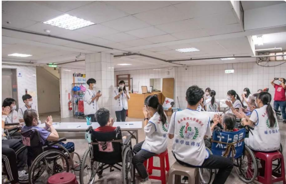
嘉藥藥學系學生以台語劇方式教導長輩在日常預防跌倒和三高。