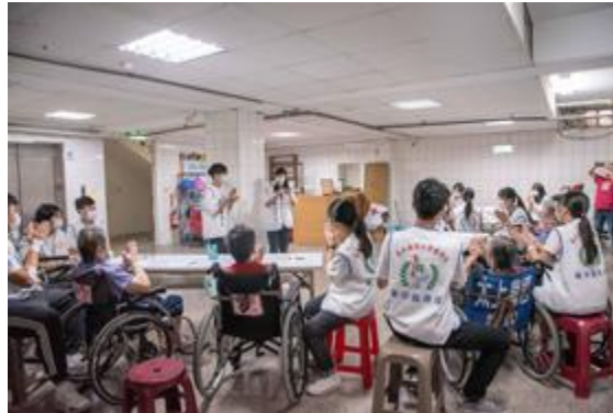
嘉藥學生以台語劇方式教導長輩在日常預防跌倒和三高。

【記者孫曉倫 / 南市報導】嘉南藥理大學藥學系系學會揮別疫情限制，重新啟動社區衛教與藥事服務宣導，沉寂三年後，首站開到臺南市錫安護理之家及仁和幼兒園，為這個嘉藥優良傳統社區衛教活動重新揭開序幕，象徵著疫情減緩，也代表著跨世代的藥事衛教活動再升級，用耐心傾聽及熱情陪伴，讓藥事衛教活動也可以溫暖又有趣。