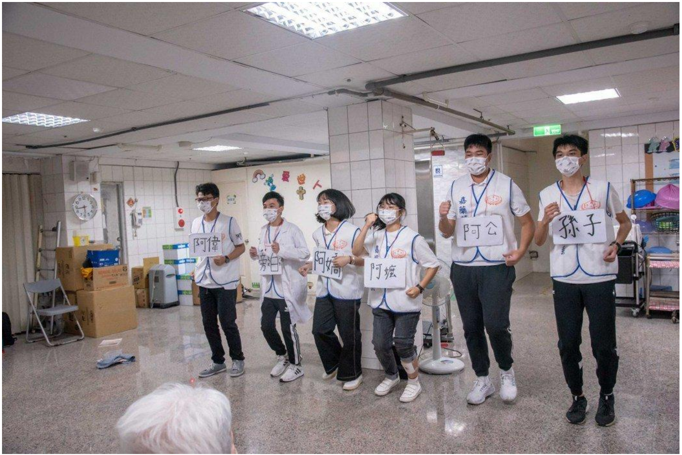
嘉藥藥學系學生用戲劇方式教導年長者預防跌倒。