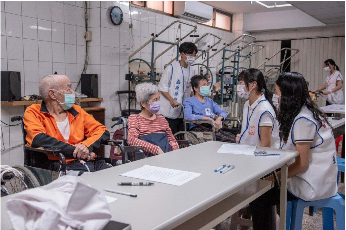
嘉藥藥學系社區衛教活動陪伴長者聊天唱歌。