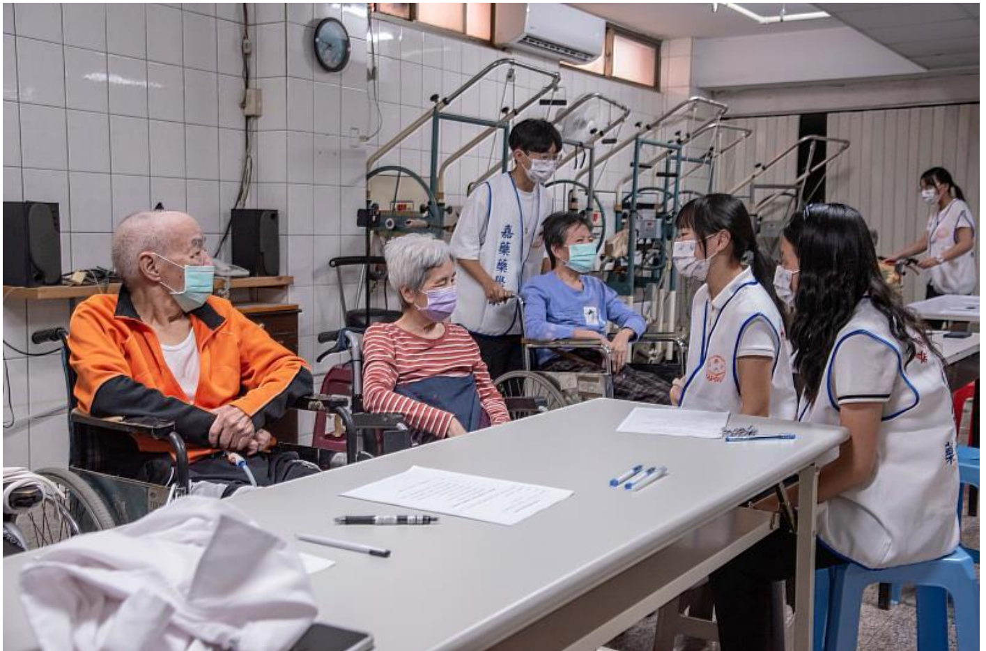
嘉藥藥學系社區衛教活動陪伴長者聊天唱歌

(中央社訊息服務20221116 16:37:46)嘉南藥理大學藥學系系學會揮別疫情限制，重新啟動社區衛教與藥事服務宣導，沉寂三年後，首站開到臺南市錫安護理之家及仁和幼兒園，為這個嘉藥優良傳統社區衛教活動重新揭開序幕，象徵著疫情減緩，也代表著跨世代的藥事衛教活動再升級，用耐心傾聽及熱情陪伴，讓藥事衛教活動也可以溫暖又有趣。