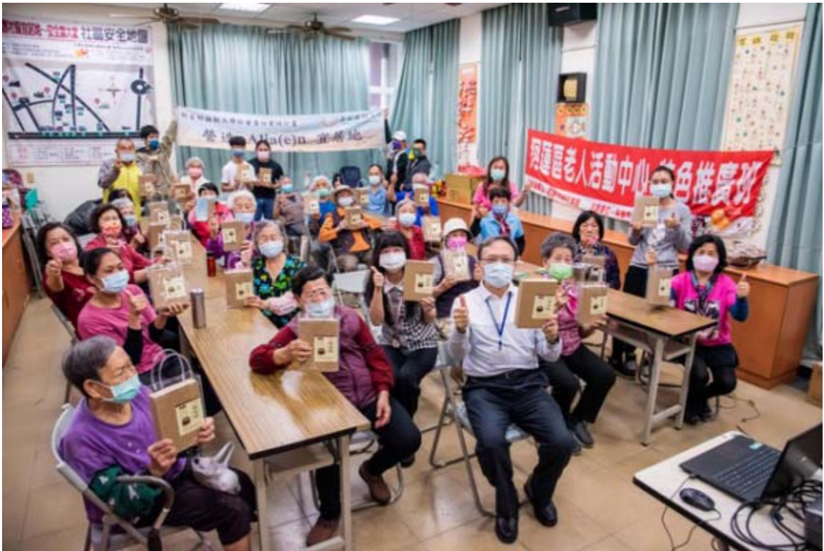
嘉藥研發銀髮族介護食品「銀養粥」贈送偏鄉長備食用。