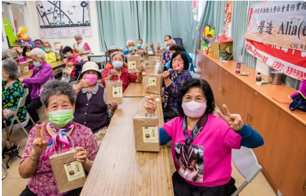
嘉藥為長輩們研發出特別的「銀養粥」。