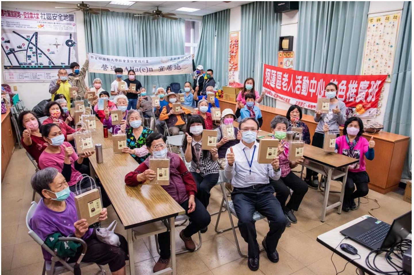
圖說：嘉藥研發銀髮族介護食品「銀養粥」贈送偏鄉長輩備食用。

【記者黃鐘毅 / 台南報導】嘉南藥理大學長期關懷在地社區與偏鄉長者生活，USR「營造 Alia(e)n 宜居地計畫」團隊與高雄阿蓮社區發展協會合作，舉辦「呷健康~呷百二-認識食品標章及飲食質地分級活動」，活動中特別贈送由食品系師生研發的銀髮族介護食品「銀養粥-鮑魚干貝雞蓉粥」，讓阿蓮地區里民及銀髮族長者一同享用嘗鮮。