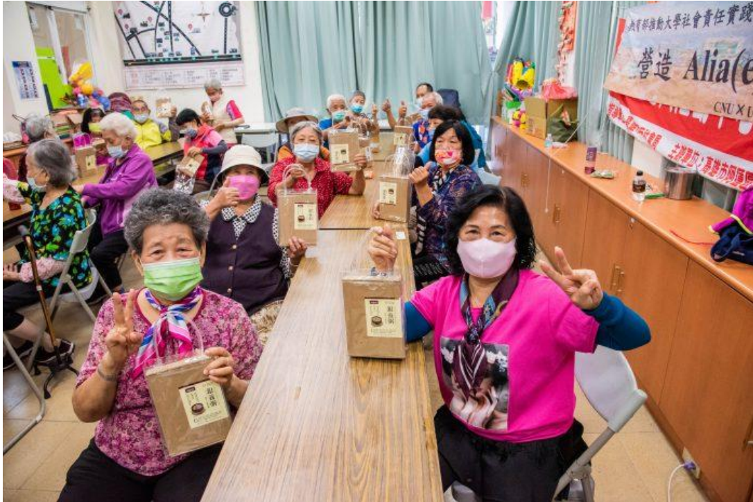
嘉藥為長輩們研發出特別的「銀養粥」。