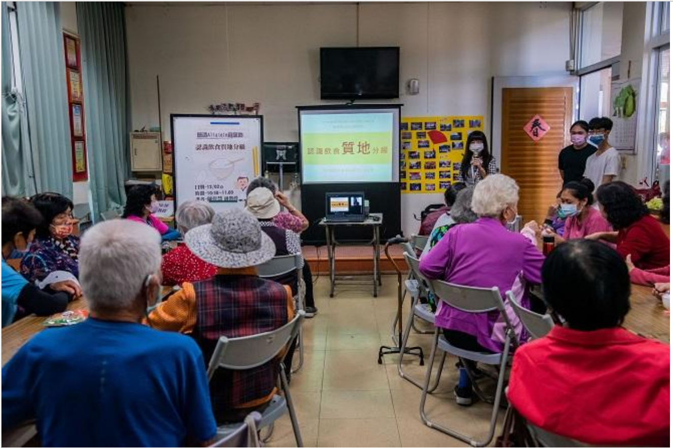
嘉南藥理大學提供