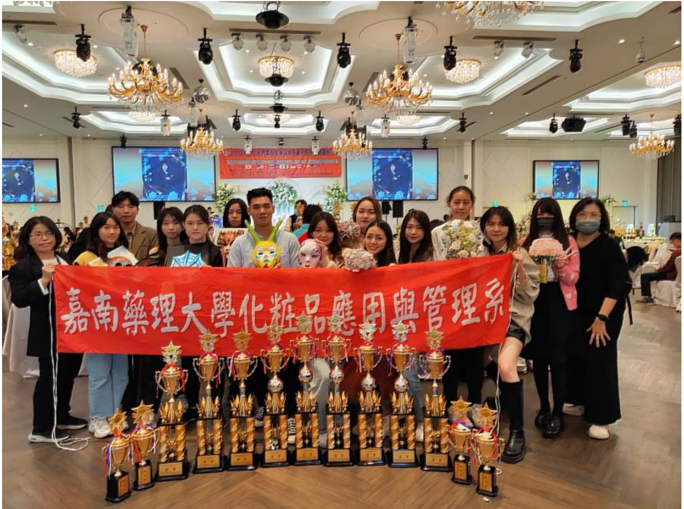
2022年HBC世界盃髮型美容美睫美甲眉藝文創國際比賽嘉藥獲13項獎項