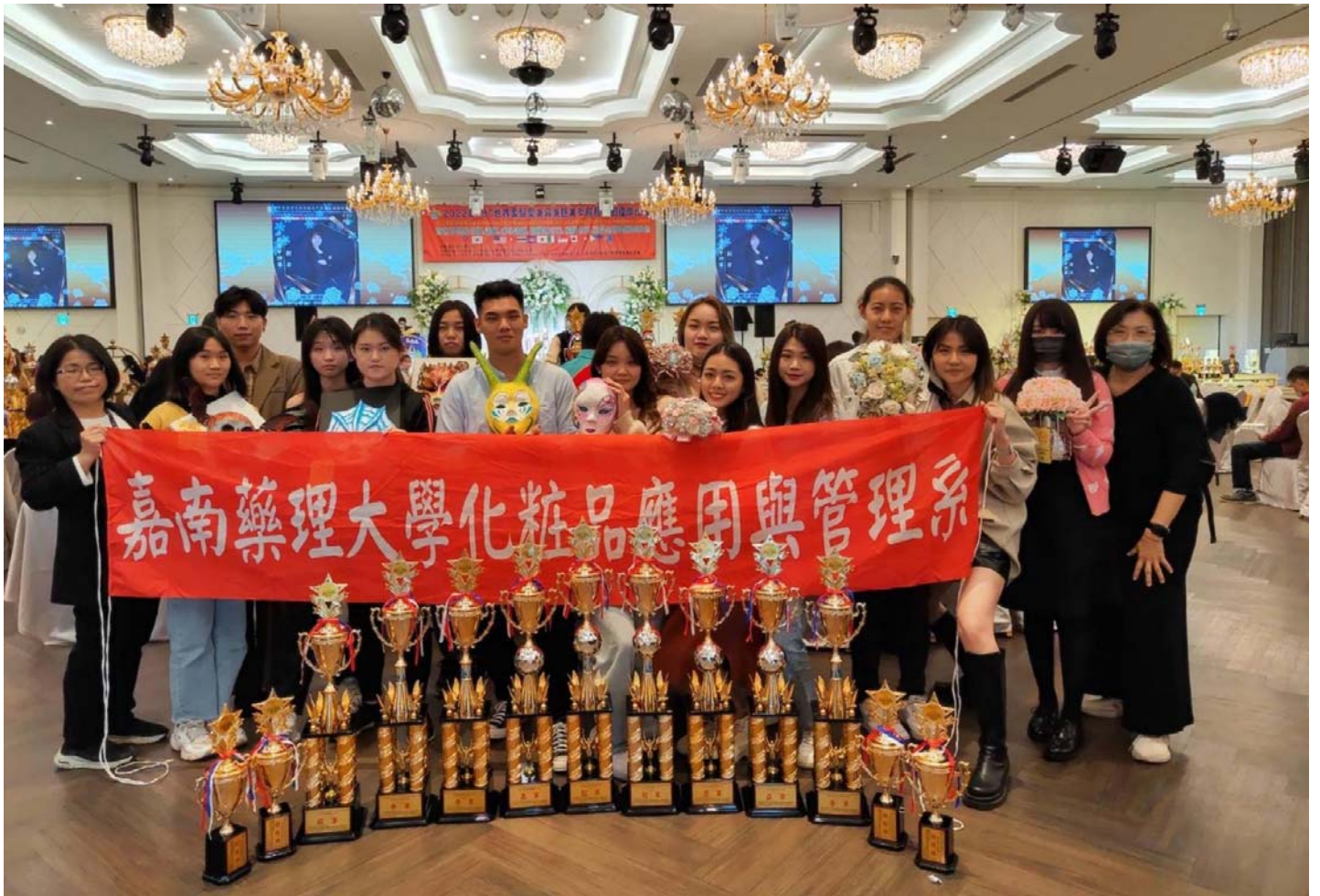
圖說：2022年HBC世界盃髮型美容美睫美甲眉藝文創國際比賽，嘉藥獲13項獎項。

【記者黃鐘毅 / 台南報導】嘉南藥理大學化粧品應用與管理系師生參加「2022年HBC世界盃髮型美容美睫美甲眉藝文創國際比賽」，在來自世界各地技術人員和全國各大專院校參賽團隊近千名好手中脫穎而出，一舉囊括包含「新娘捧花組」、「世界面具組」及「創意面具組」等類組，共2冠軍、3亞軍、3季軍、1殿軍及4特優，計13獎項，成績相當亮眼。