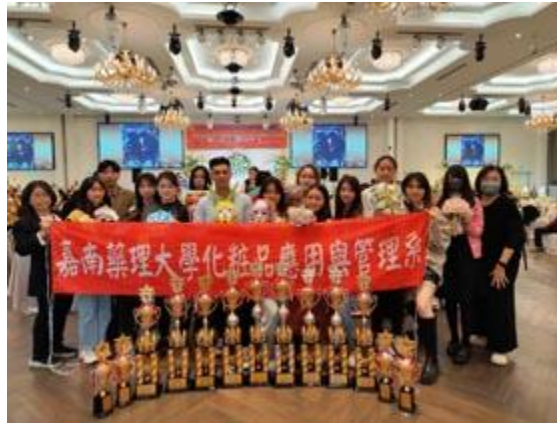
2022年HBC世界盃髮型美容美睫美甲眉藝文創國際比賽嘉藥獲13項獎項。

【記者孫宜秋 / 南市報導】嘉南藥理大學化粧品應用與管理系師生參加「2022年HBC世界盃髮型美容美睫美甲眉藝文創國際比賽」，在來自世界各地技術人員和全國各大專院校參賽團隊近千名好手中脫穎而出，一舉囊括包含「新娘捧花組」、「世界面具組」及「創意面具組」等類組，共2冠軍、3亞軍、3季軍、1殿軍及4特優，計13獎項，成績相當亮眼，對於指導老師及學生都是一大肯定。