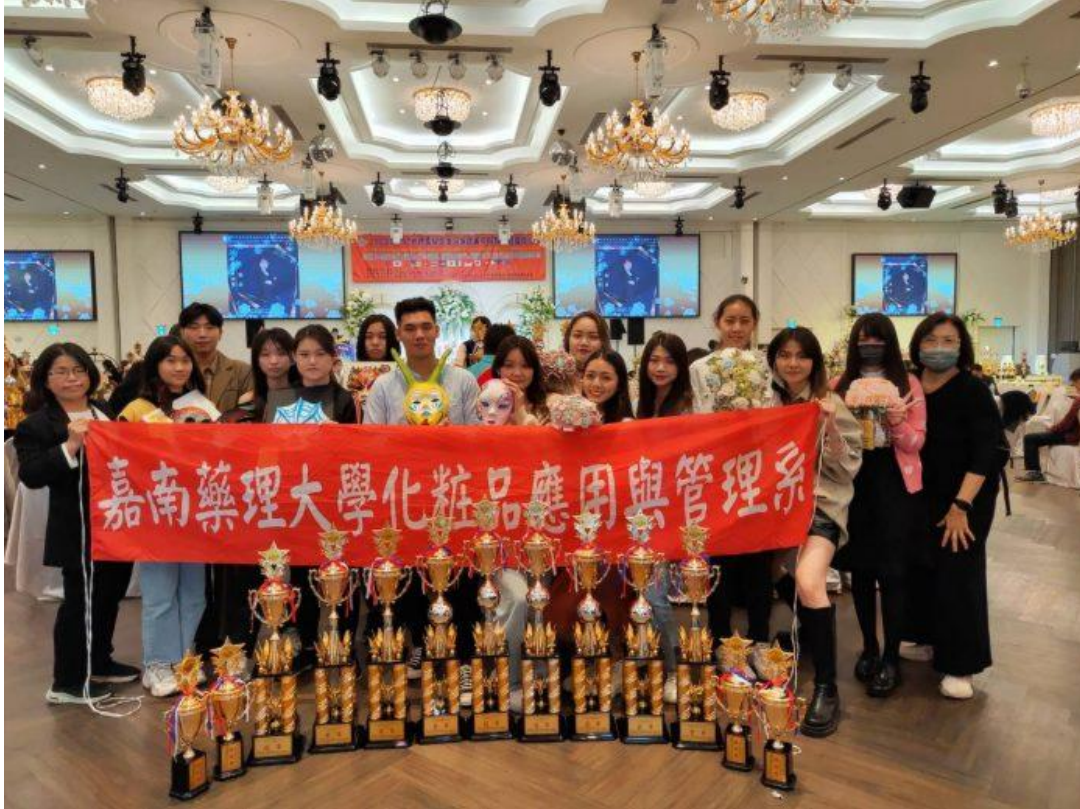
嘉藥粧品系在HBC世界盃髮型美容美睫美甲眉藝文創國際比賽獲十三項獎項。