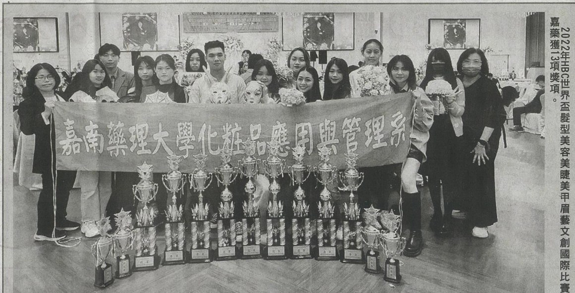
2022年HBC世界盃髮型美容美睫美甲眉藝文創國際比賽 嘉藥獲3項獎項。

【記者孫宜秋／南市報導】嘉南藥理大學化粧品應用與管理系師生參加「2022年HBC世界盃髮型美容美睫美甲眉藝文創國際比賽」，在來自世界各地技術人員和全國各大專院校參賽團隊近千名好手中脫穎而出，一舉囊括包含「新娘捧花組」、「世界面具組」及「創意面具組」等類組，共奪冠、亞軍、3季軍、「殿軍及特優」計3項獎項，成績相當亮眼，對於指導老師及學生都是一大肯定。