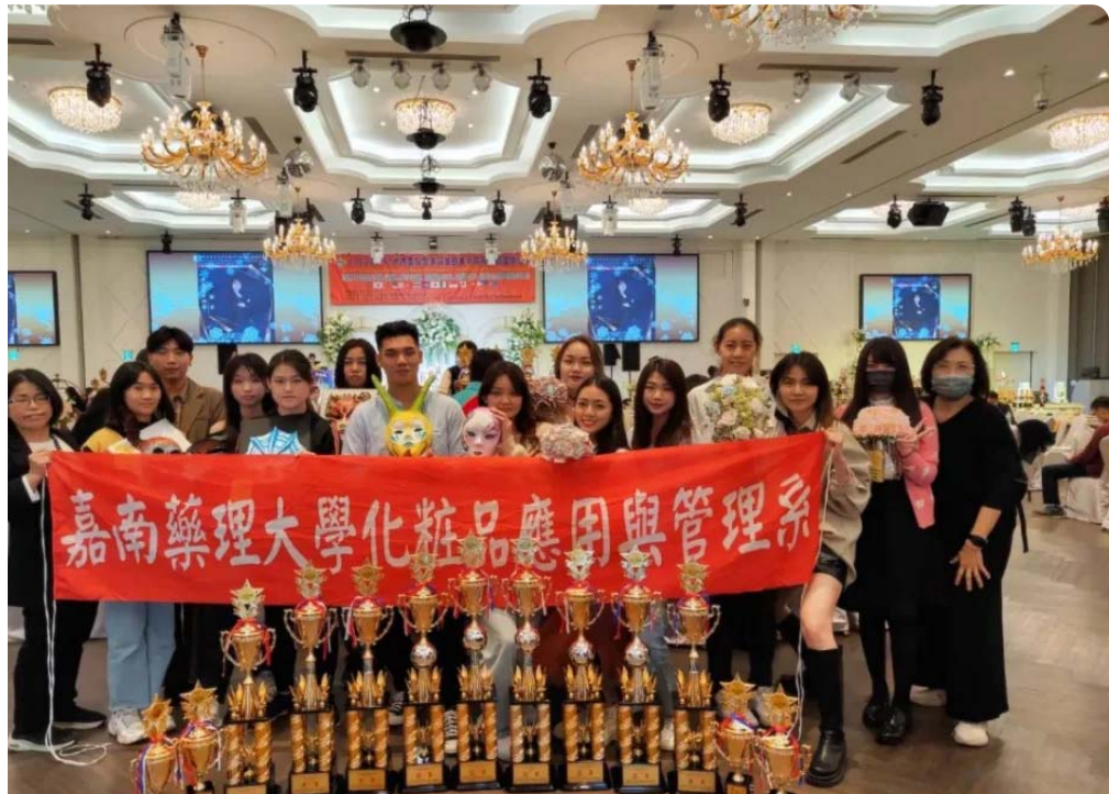
嘉藥粧品系在HBC世界盃髮型美容美睫美甲眉藝文創國際比賽獲十三項獎項。