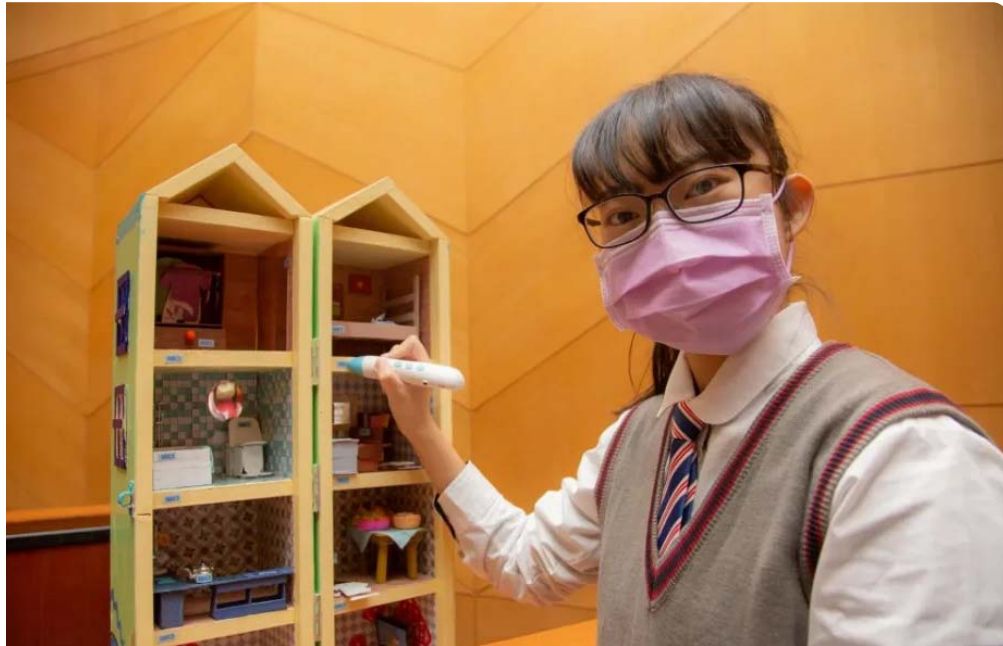
曾文家商的學生利用點讀筆讓幼兒邊玩邊學習語言，獲得兒童教玩具競賽第一名。