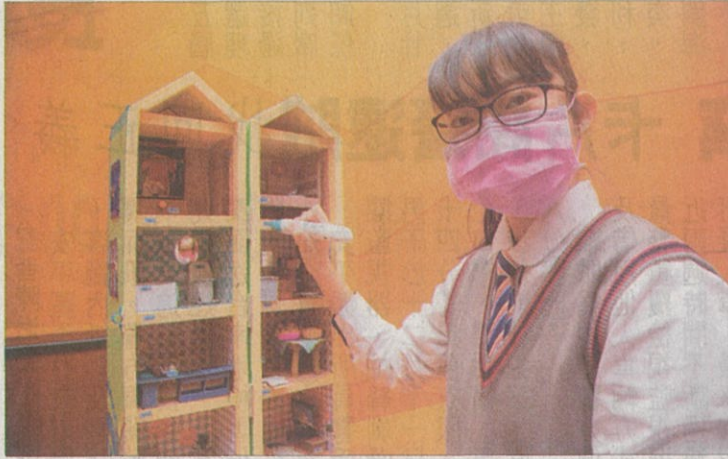
↑曾文家商的學生利用點讀筆讓幼兒邊玩邊學習語言，獲得兒童教玩具競賽第一名。