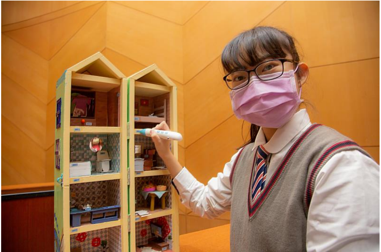
曾文家商同學「認識越南文化」利用點讀筆讓幼兒邊玩邊學習語言獲評審青睞獲得第一名