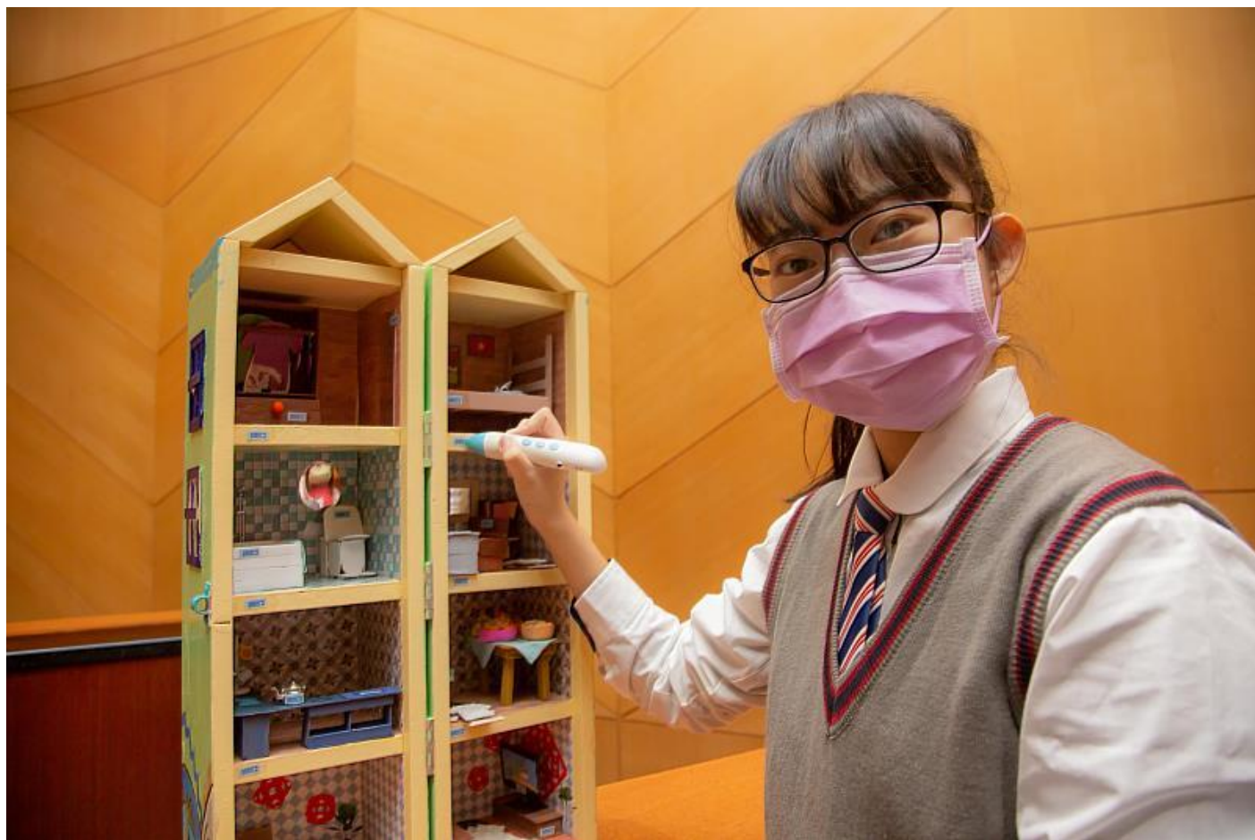
曾文家商同學「認識越南文化」利用點讀筆讓幼兒邊玩邊學習語言獲評審青睞獲得第一名