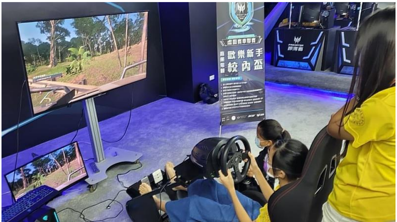
來自阿蓮的學子體驗嘉藥電競黑洞遊戲設備