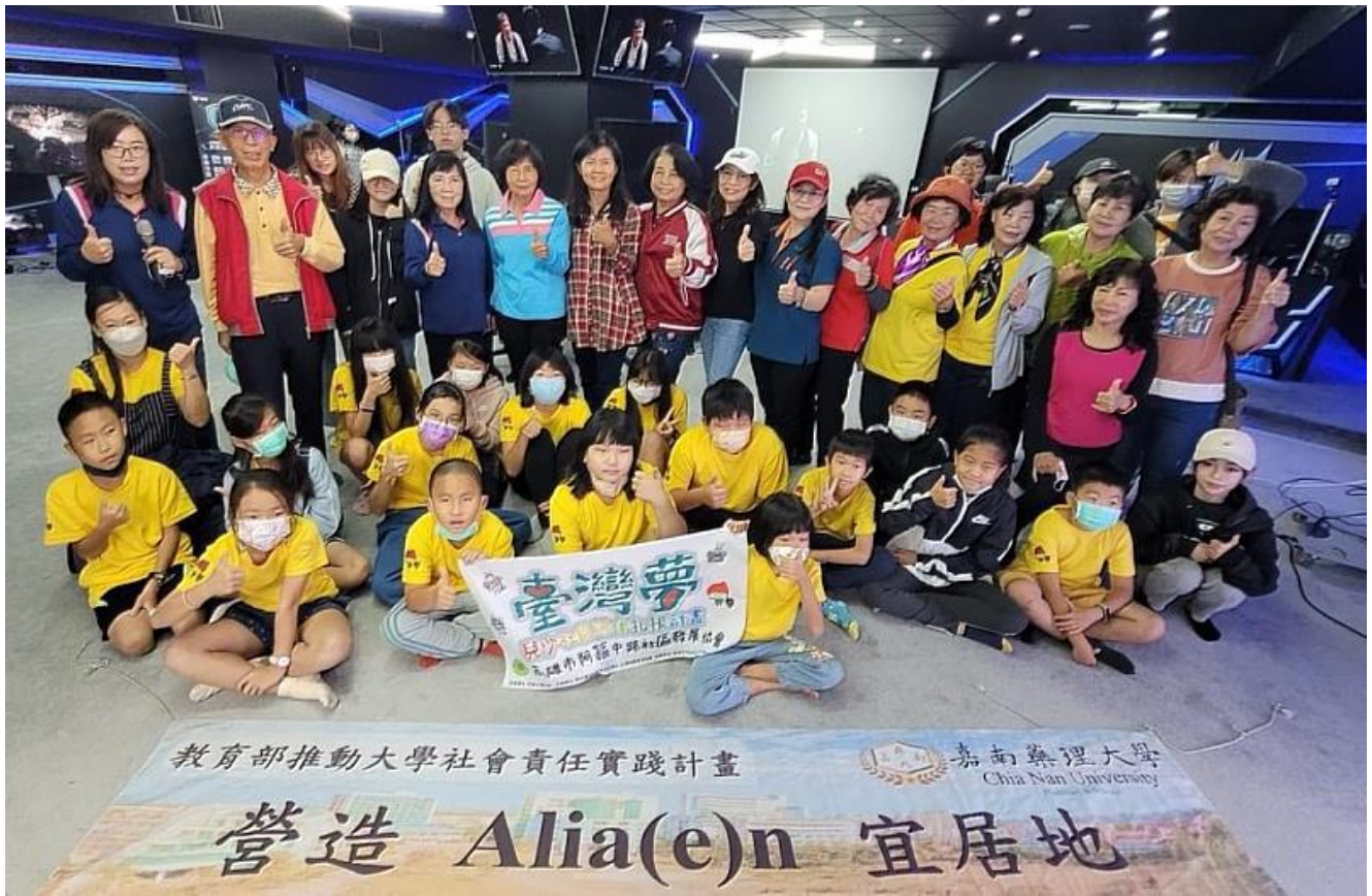
高雄阿蓮區里民參加嘉藥USR計畫世代共學E起來