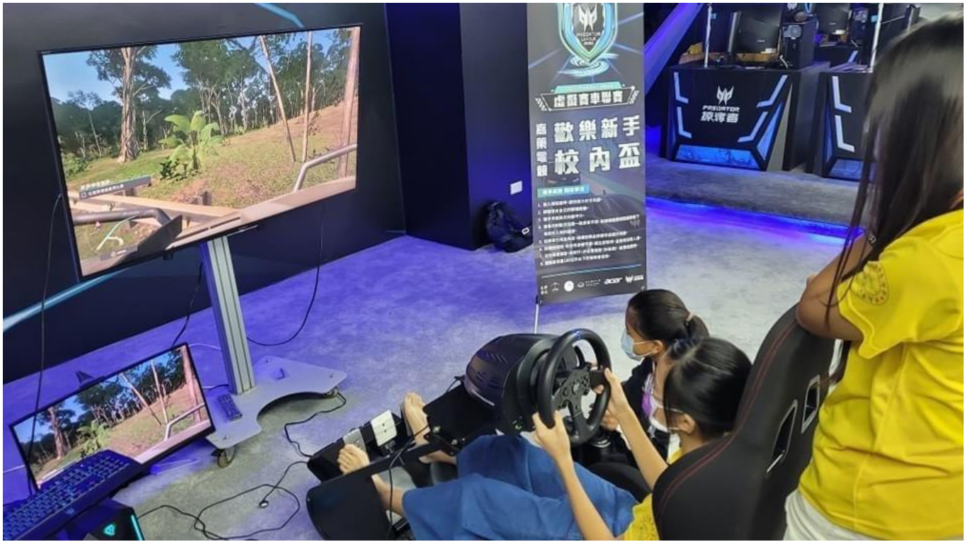
來自阿蓮的學子體驗嘉藥電競黑洞遊戲設備。