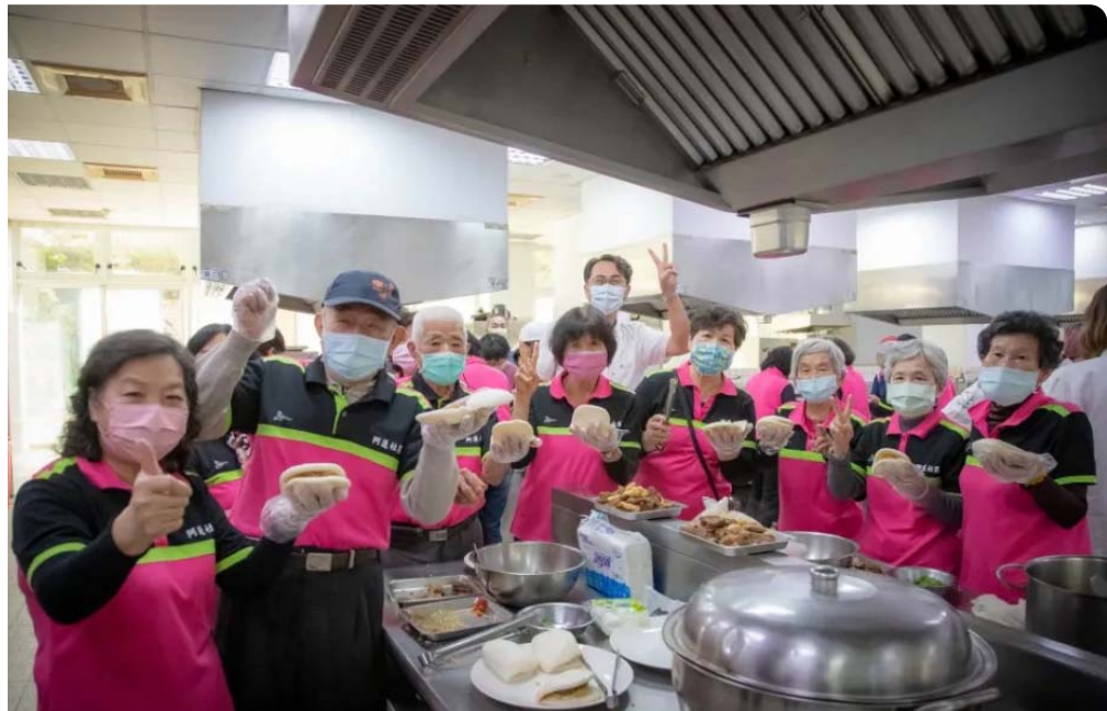
嘉藥青銀共煮創意設計料理，讓阿蓮區的長輩各個滿載而歸。