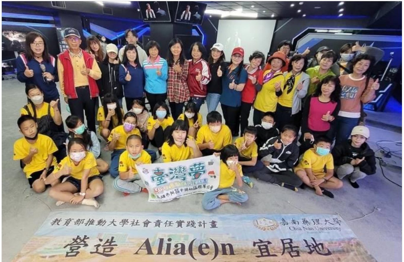
【大成報/記者于郁金/臺南報導】嘉南藥理大學執行「營造 Alia(e)n 宜居地」USR計畫，日前分別與高雄市阿蓮區中路里及阿蓮里攜手辦理「青少年社會企業CEO體驗-世代共學E起來」及「青銀共煮創意設計料理」活動，由嘉藥服務團隊帶領學生邀請在地學子及社區長輩，體驗大學實務課程共創美好生活體驗。