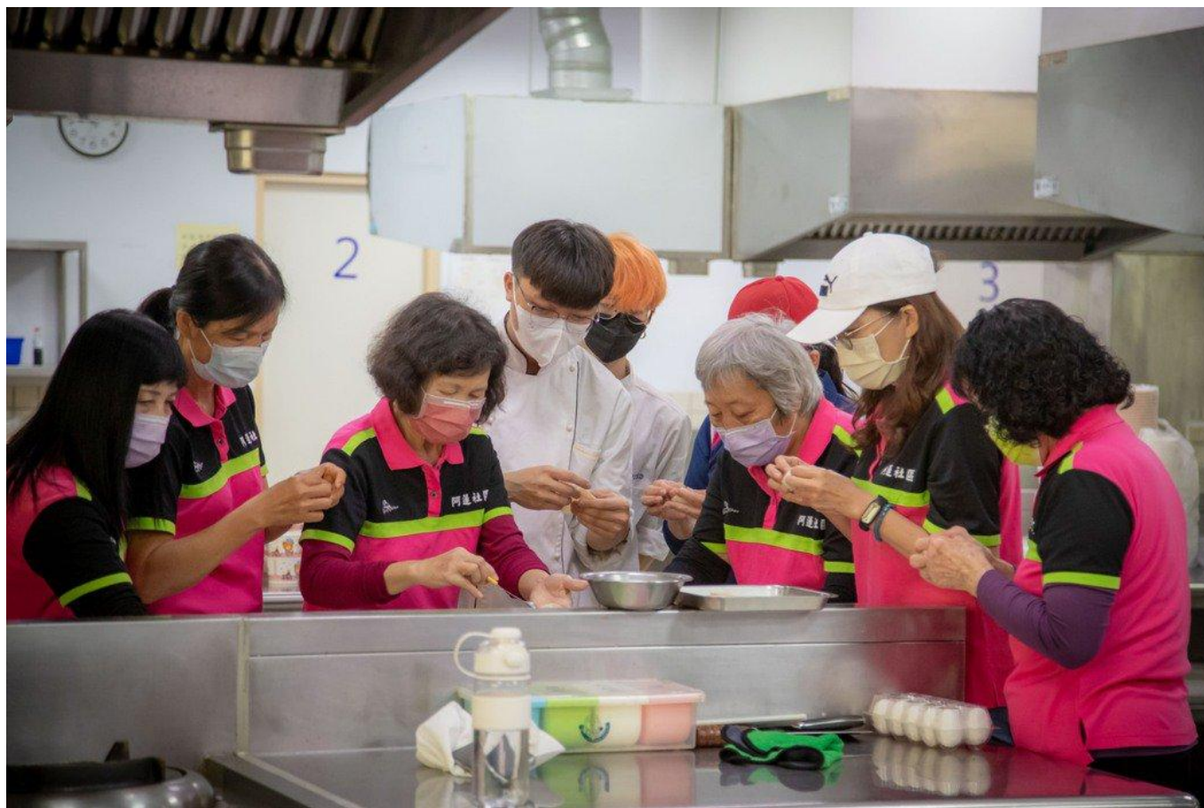
嘉藥餐旅系同學教導阿里區長輩製作低油、低脂、低鹽健康的餃子。