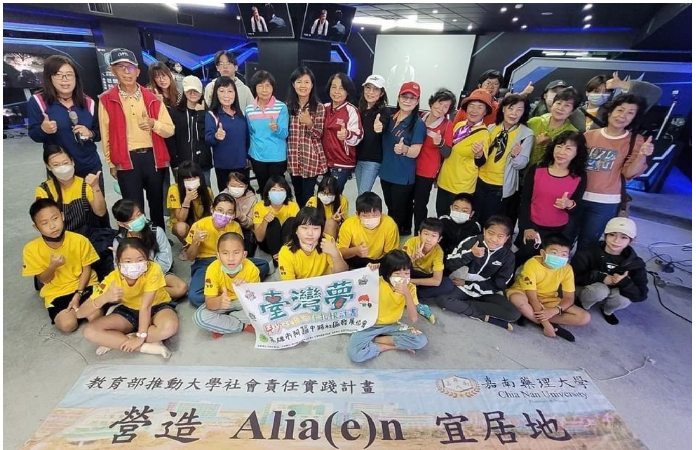
高雄阿里區里民參加嘉藥USR計畫世代共學E起來。

嘉藥副校長兼研發長張翊峰表示，本校已與阿蓮社區配合三年以上，嘉藥除了將資源帶入社區，亦會邀請社區青年學子及長輩來學校體驗活動，使參與之學員們透過豐富的主題課程安排，創造青銀共學，促進三代互動共融，並增加世代間的連結，樂活生活。