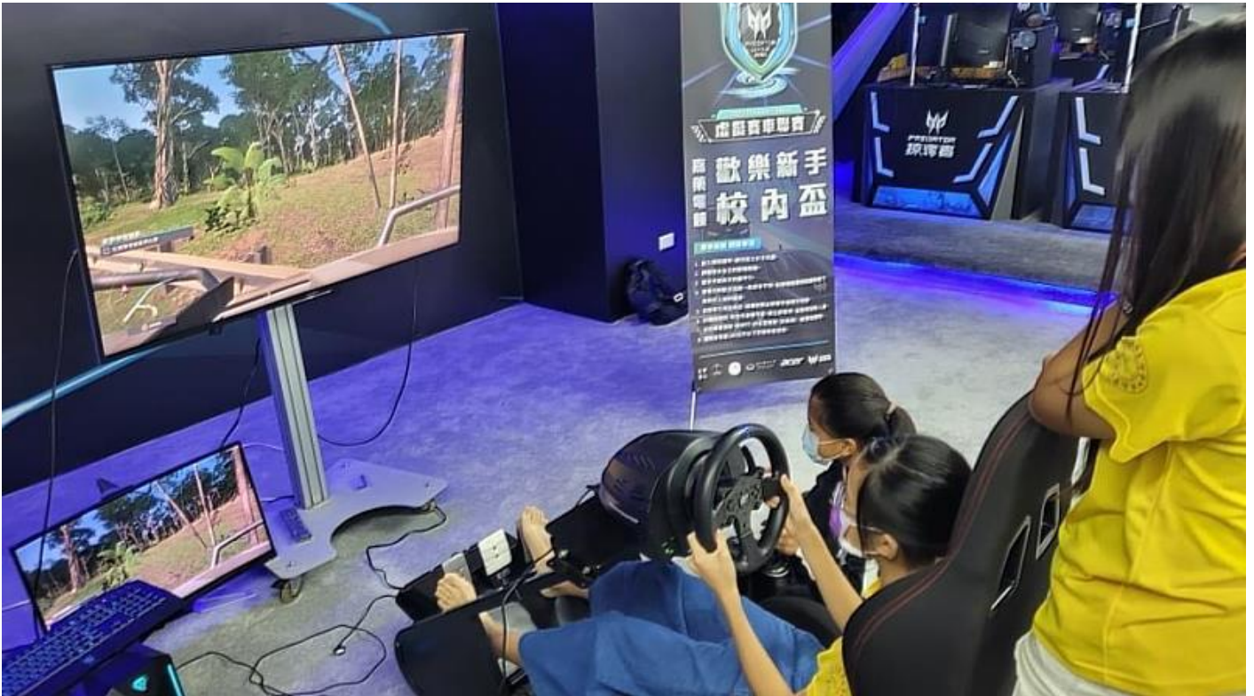
來自阿蓮的學子體驗嘉藥電競黑洞遊戲設備

教育與VR科技學習之成效，也讓學生學習如何帶領社區小朋友體驗創新科技，小朋友們玩得不亦樂乎，活動氣氛歡樂，體現育教於樂精神。