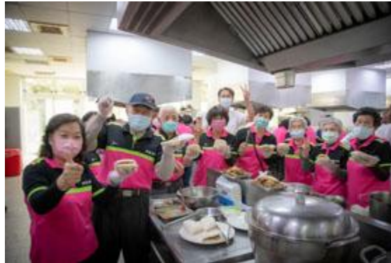
嘉藥青銀共煮創意設計料理讓阿蓮長輩各個滿載而歸。

【記者孫宜秋 / 南市報導】嘉南藥理大學執行「營造 Alia ( e ) n 宜居地」USR計畫，日前分別與高雄市阿蓮區中路里及阿蓮里攜手辦理「青少年社會企業CEO體驗-世代共學E起來」及「青銀共煮創意設計料理」活動，由嘉藥服務團隊帶領學生邀請在地學子及社區長輩，體驗大學實務課程共創美好生活體驗。