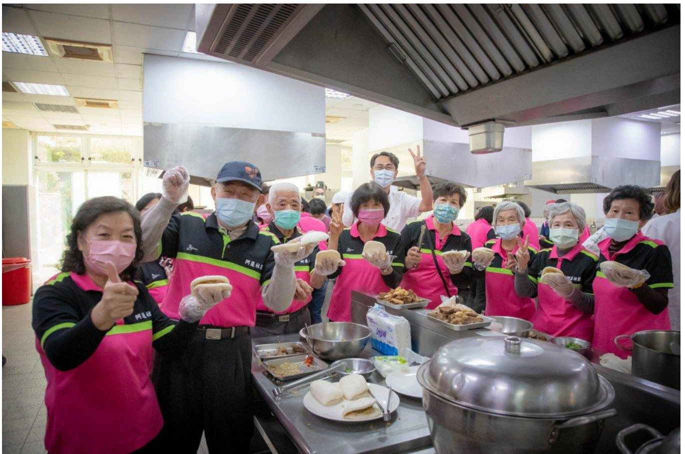
嘉藥青銀共煮創意設計料理讓阿蓮長輩各個滿載而歸街。