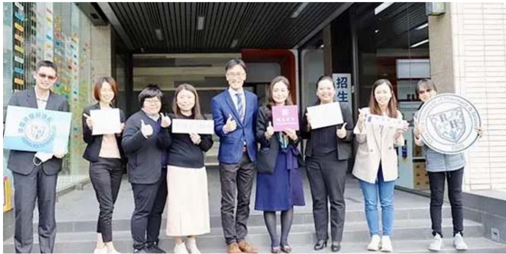
嘉藥休閒系與臺南晶英、臺南遠東香格里拉等六家休閒產業龍頭企業建立產學建教合作聯盟，強強聯手創造產學雙贏。(記者李嘉祥攝)

▲嘉藥休閒系與臺南晶英、臺南遠東香格里拉等六家休閒產業龍頭企業建立產學建教合作聯盟，強強聯手創造產學雙贏。(記者李嘉祥攝)