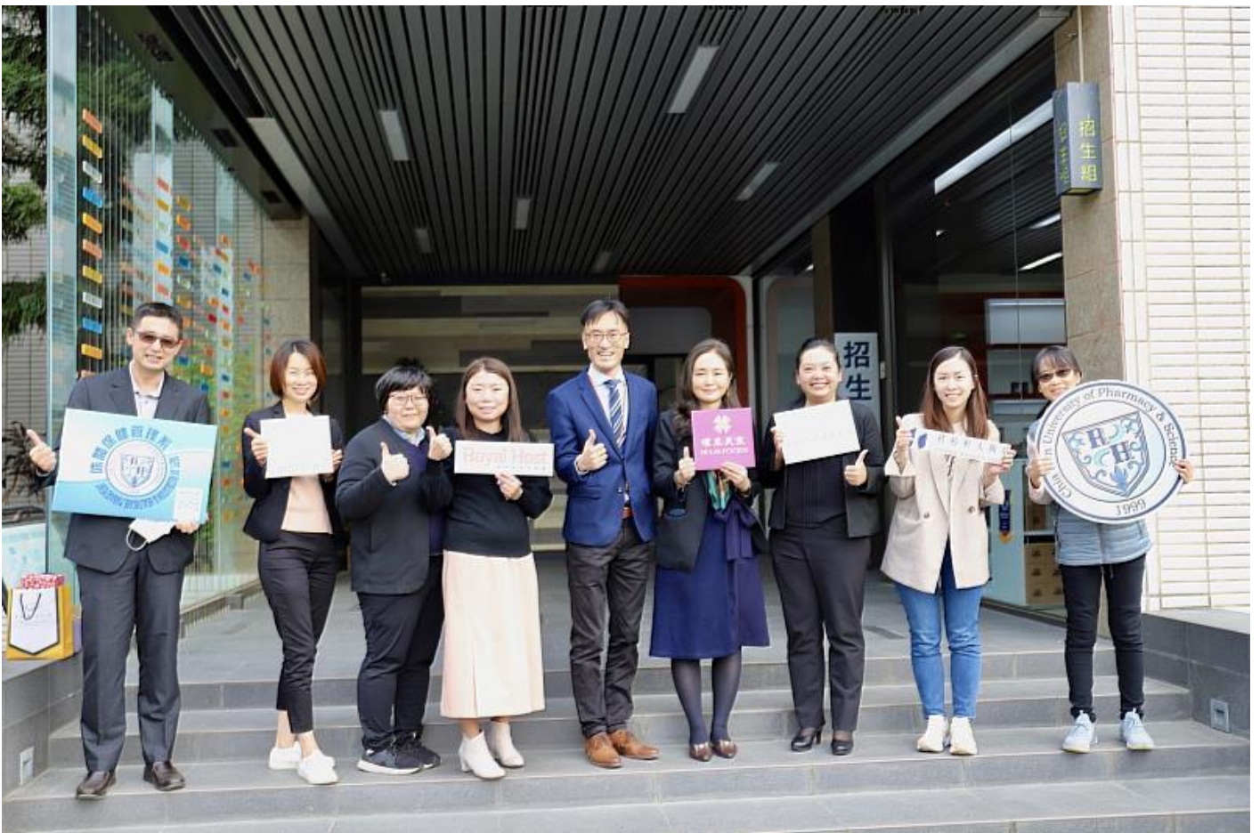
嘉藥休閒系與休閒產業攜手建立產學建教合作聯盟

漸解封，休閒餐旅產業景氣快速回溫，嘉南藥理大學休閒保健管理系特邀集包含晶華國際酒店台南分公司(晶英酒店)、台南遠東香格里拉飯店、禧榕軒大飯店、漢來美食、爭鮮迴轉壽司及樂雅樂食品股份有限公司等六家休閒產業龍頭企業，攜手建立產學建教合作聯盟。此合作聯盟，不僅在實習、工讀及就業媒合能有深度的合作，更進一步將連結高中職端的產學攜手合作計畫2.0，共同向下紮根培育新才，創造休閒餐飲產學雙贏的新局面。