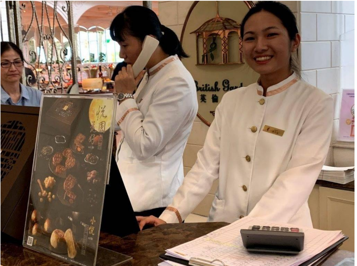
嘉藥學生歡喜學習還順利就業。