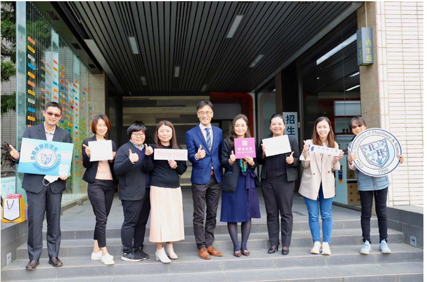
圖說：嘉藥休閒系與休閒產業攜手建立產學建教合作聯盟。

【記者黃鐘毅 / 台南報導】隨著疫情逐漸解封，休閒餐旅產業景氣快速回溫，嘉南藥理大學與台南晶英酒店、遠東香格里拉飯店、禧榕軒大飯店、漢來美食、爭鮮迴轉壽司及樂雅樂食品公司等六家，攜手建立產學建教合作聯盟。不僅在實習、工讀及就業媒合能有深度的合作，更將連結高中職端的產學攜手合作計畫2.0，共同向下紮根培育新才，創造產學雙贏的新局面。