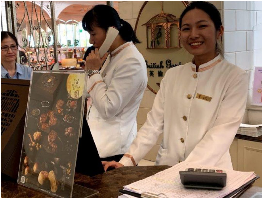
嘉藥學生歡喜學習還順利就業。(嘉藥提供)