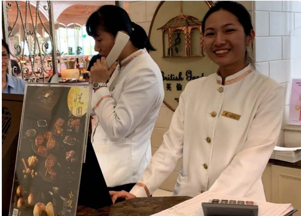
嘉藥學生歡喜學習還順利就業。