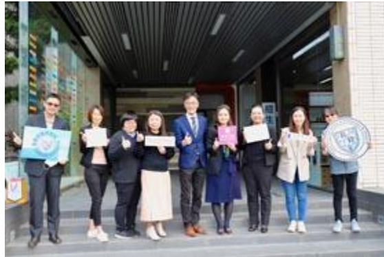
嘉藥休閒系與休閒產業攜手建立產學建教合作聯盟。

【記者孫宜秋 / 南市報導】隨著疫情逐漸解封，休閒餐旅產業景氣快速回溫，嘉南藥理大學休閒保健管理系特邀集包含晶華國際酒店台南分公司（晶英酒店）、台南遠東香格里拉飯店、禧榕軒大飯店、漢來美食、爭鮮迴轉壽司及樂雅樂食品股份有限公司等六家休閒產業龍頭企業，攜手建立產