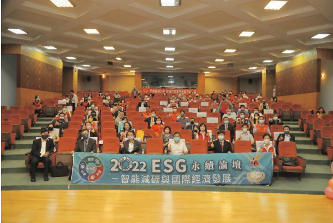
嘉藥辦理「2022 ESG 永續論壇—智能減碳與國際經濟發展」論壇，多位重量級人士熱情參與。

查證稽核則由國際知名第三方查證稽核單位—德國TUV NORD TAIWAN台灣北德公司支持與協助；檢測聲明則與法國Eurofins集團合作，特重於各式環境資源與減碳聲明服務；題庫開發及系統上，除了陸續整合國內北中南各大專校院與學術團體加入外，也邀請國際知名的荷蘭IPOE科教基金會與美國專案管理學會共同參與，產學研3方協調整合支援的工作，則由社團法人台灣產學研合作發展策進會負責，期盼群策群力，發揮綜效，共同為台灣ESG開創新氣象。