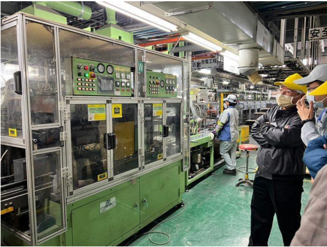
嘉藥ESG暨減碳團隊協助輔導企業組織溫室氣體盤查。