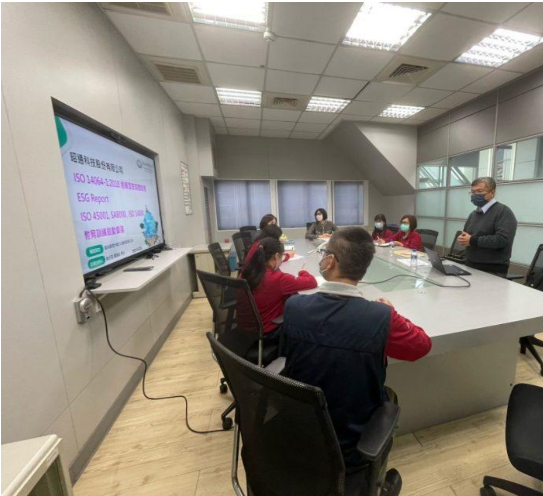
嘉藥ESG暨減碳團隊協助輔導企業ESG報告書製作。