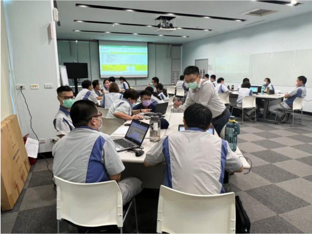
嘉藥ESG暨減碳團隊協助輔導企業組織進行溫室氣體盤查。

嘉南藥理大學創校56年來，深植產、官、學3方實力，培養在地社區與產業人脈，擁有超過千家的實習合作廠商，了解台灣中小企業需求，尤其環境永續學院長期深耕台灣環境資源實務，在與公私立法人、企業交流經驗中，深知台灣許多自然資源的開發利用已超過環境負荷能力，自然景觀與生態平衡都遭到破壞，因而台灣企業在保護環境資源與管理議題上比其他國家更具迫切性。