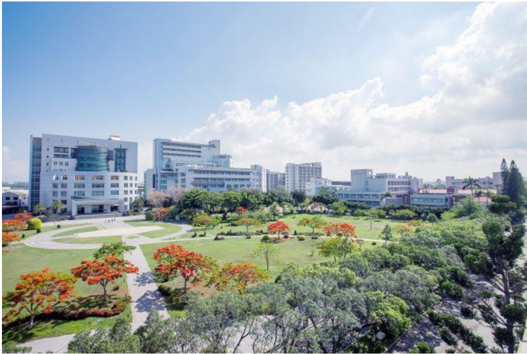
嘉南藥理大學一直以來對於環境保育方面都十分用心。