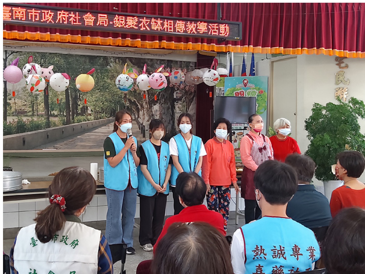
▲ 嘉南藥理大學社工系學生參加銀髮衣鉢相傳活動