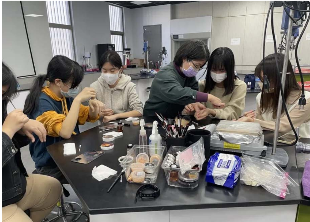
嘉藥「美粧科學探索營」的學員學習電影演員的傷疤粧畫法。(記者黃文記攝)