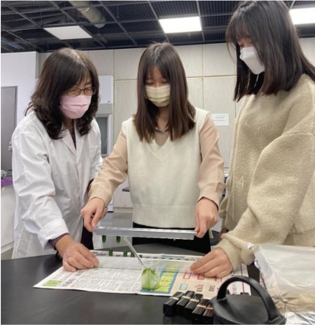
學員調製適合自己膚色的變色口紅