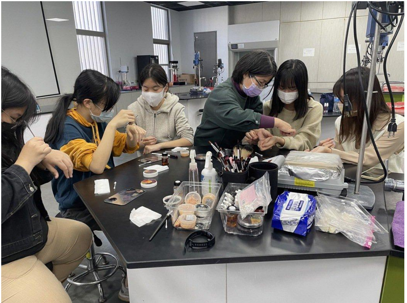
學習電影演員的傷疤粧畫法。