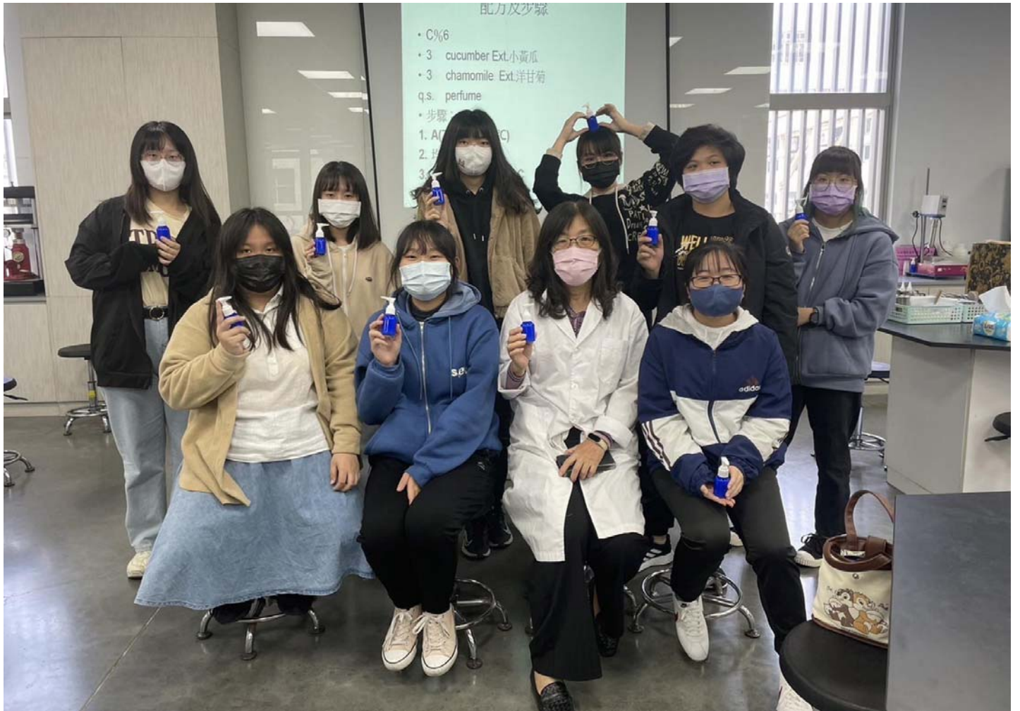
圖說：參加嘉藥「美粧科學探索營」學員開心展示DIY保濕乳液。

【記者黃鐘毅 / 台南報導】由嘉南藥理大學舉辦的「美粧科學探索營」，吸引許多想一窺化粧品科學奧秘的高中學子參與，為期兩天活動，該校化粧品應用與管理系菁英盡出，老師們精心規劃並使出渾身解數，以一系列豐富多樣的課程，讓參加學員驚喜連連，也對粧品系有了更多的了解。