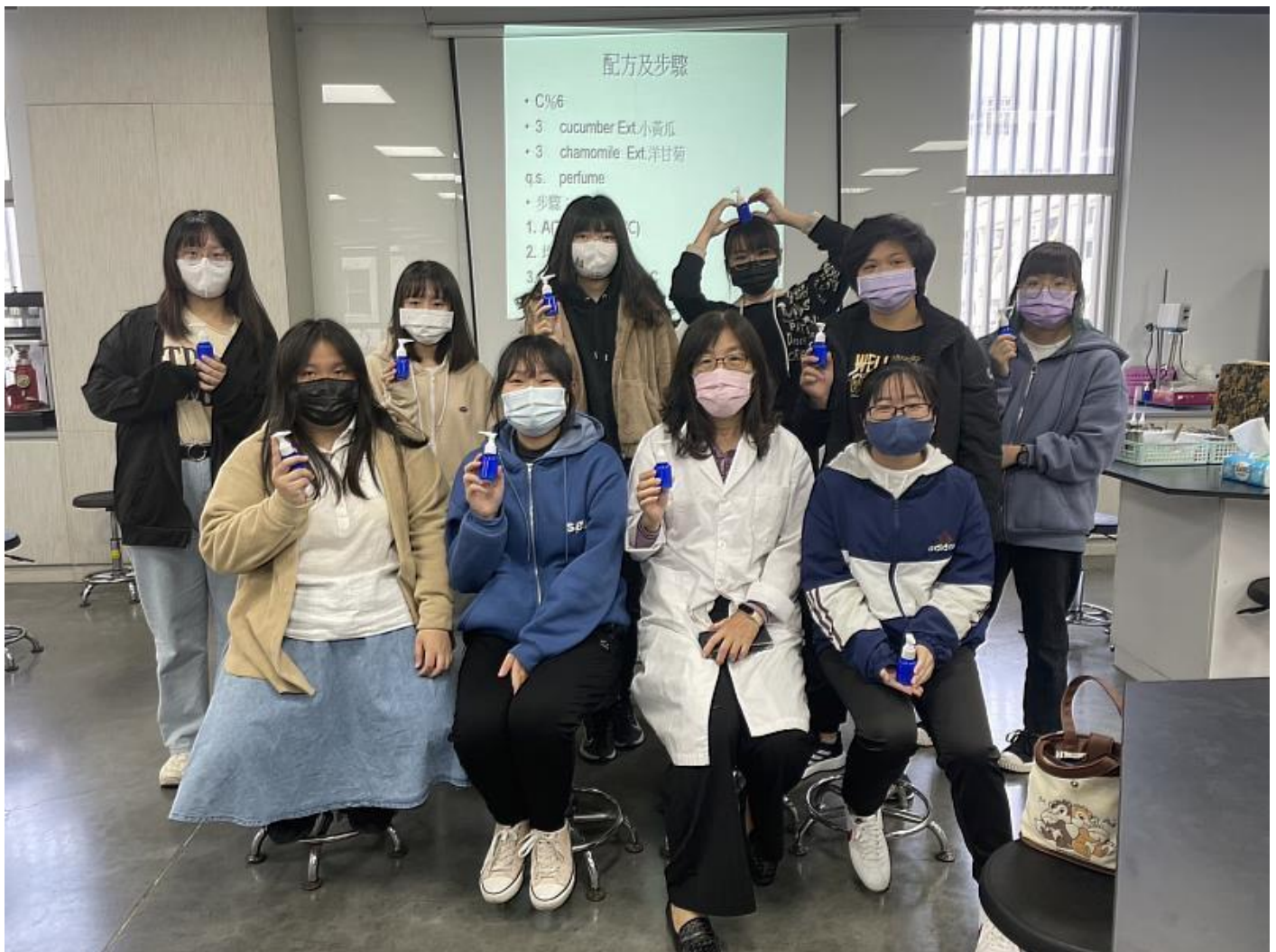
參加嘉藥美粧營學員開心展示DIY保濕乳液

(中央社訊息服務20230302 15:27:11)涵蓋「皮膚狀況檢測」、「化粧品調製」、「香氛好心情」、「我的香味自己調」、「護膚按摩的應用」以及「恐怖粧容教學」的「美粧科學探索營」日前在嘉南藥理大學熱烈登場，吸引許多想一窺化粧品科學奧秘的高中學子，為期兩天的美粧科學探索營，該校化粧品應用與管理系菁英盡出，老師們精心規劃並使出渾身解數，以一系列豐富多樣的課程，讓參加學員驚喜連連，也對粧品系有了更多的了解。