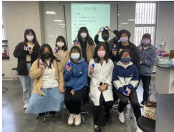
參加嘉藥美粧營學員開心展示DIY保濕乳液。

【記者孫宜秋 / 南市報導】涵蓋「皮膚狀況檢測」、「化粧品調製」、「香氛好心情」、「我的香味自己調」、「護膚按摩的應用」以及「恐怖粧容教學」的「美粧科學探索營」日前在嘉南藥理大學熱烈登場，吸引許多想一窺化粧品科學奧秘的高中學子，為期兩天的美粧科學探索營，該校化粧品應用與管理系菁英盡出，老師們精心規劃並使出渾身解數，以一系列豐富多樣的課程，讓參加學員驚喜連連，也對粧品系有了更多的了解。