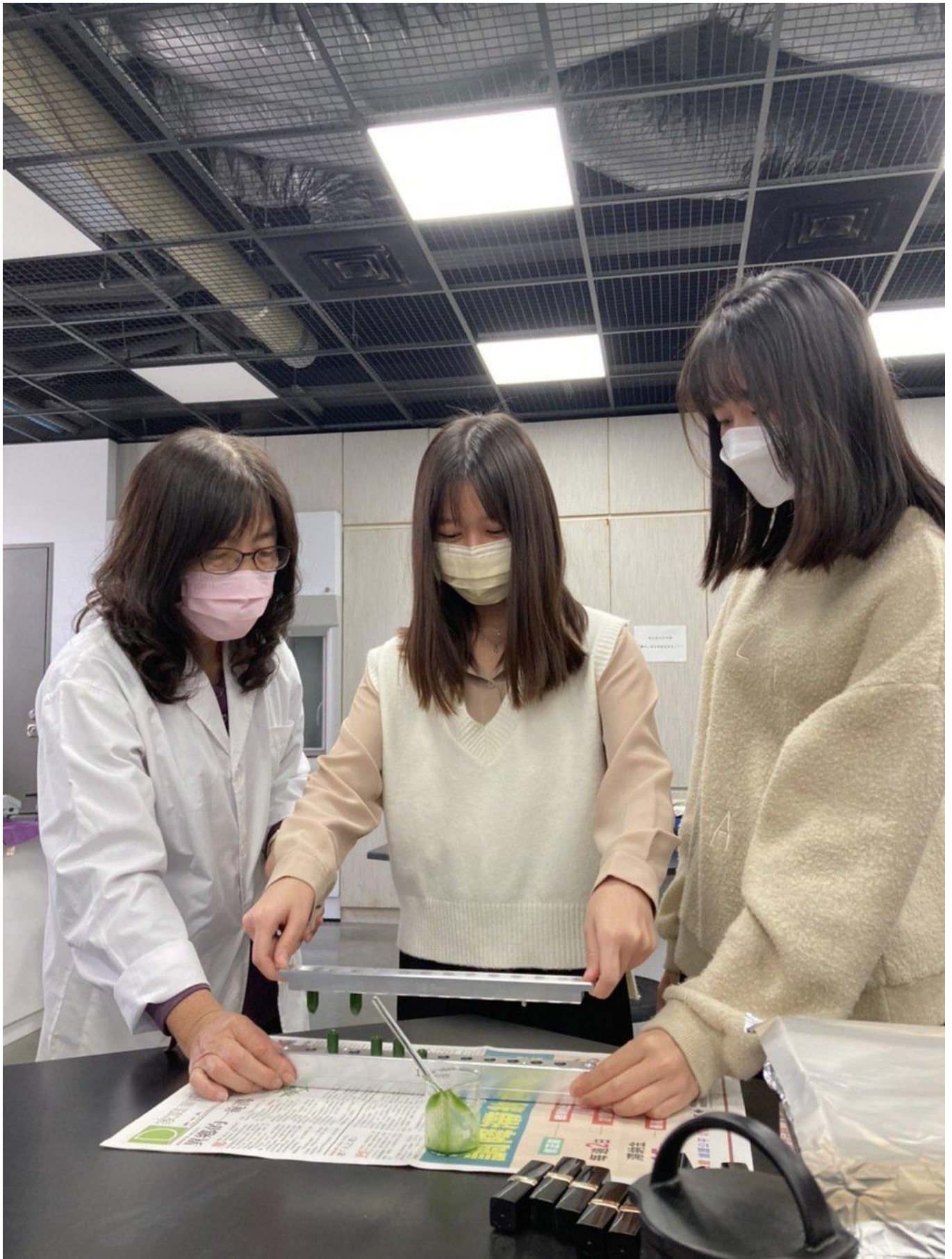
學員調製適合自己膚色的變色口紅。