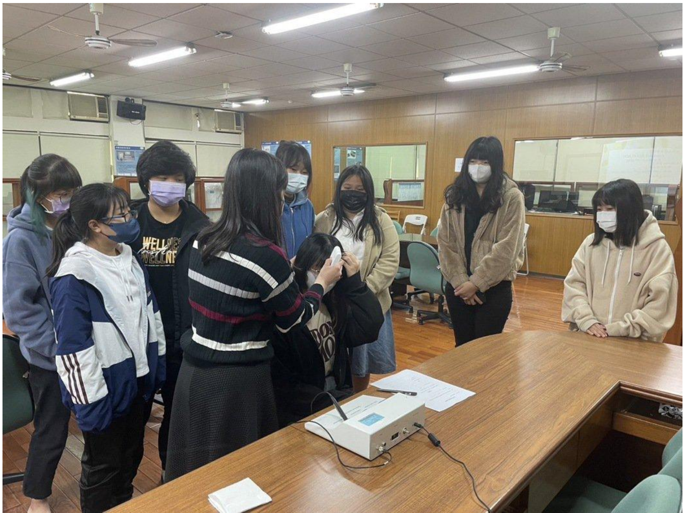
以皮膚檢測儀器來了解自己皮膚的狀態。