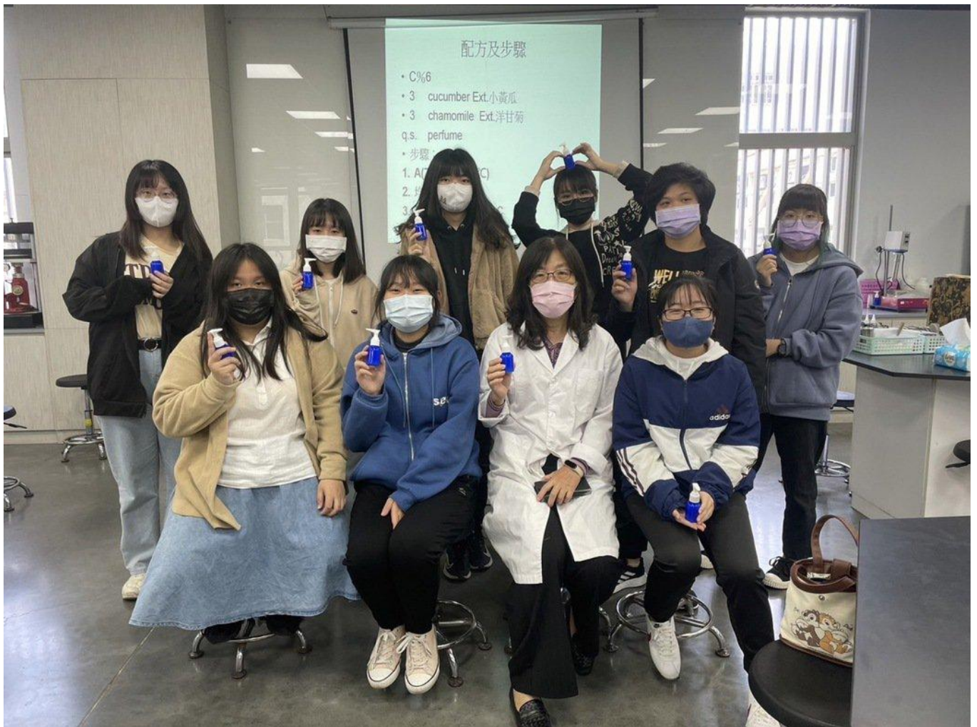
參加嘉藥美粧營學員開心展示DIY保濕乳液。