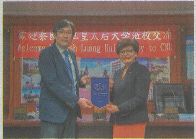
● 泰國皇太后大學與嘉南藥理大學進行學術交流。

該校指出，嘉藥與泰國清邁大學一直以來合作密切，於2017年兩校即簽訂合作備忘錄，該校粧品系並與清邁大學藥學院化粧品科技碩士學程簽訂雙聯學制。今年2月初，清邁大學在藥學院長帶隊下，至嘉藥進行學術訪問，不只共同為雙聯學制的交換學生加油，也就雙方更深化的學術交流進行實質意