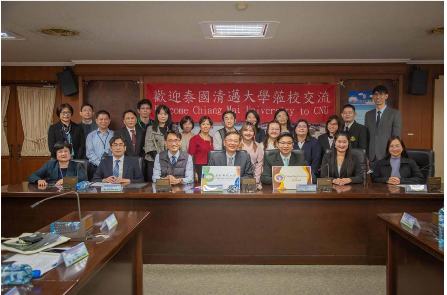
圖說：泰國皇太后大學至嘉南藥理大學進行學術交流，並簽訂合作備忘錄。 ( 記者黃鐘毅 / 翻攝 )

【記者黃鐘毅 / 台南報導】泰國富有盛名的皇太后大學，日前校長 Chayaporn Wattanasiri率團至嘉南藥理大學進行學術交流，參觀嘉藥粧品系特色實驗室、分析檢測人才培育暨區域技術聯盟基地、和生大樓及水療館等，更進一步對於締結姊妹校、簽署MOU合作備忘錄，此次來訪不只增進雙方了解，也開啟未來緊鑼密鼓的合作契機。