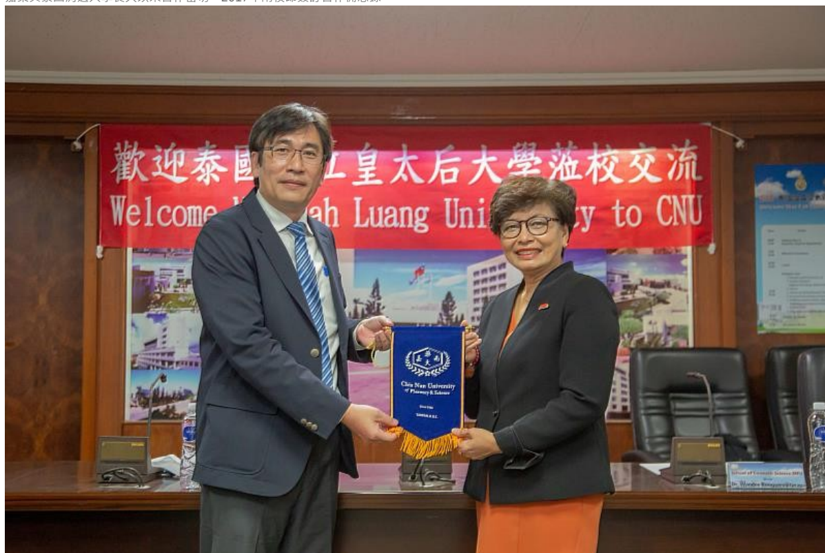
泰國皇太后大學前往嘉南藥理大學進行學術交流拜會