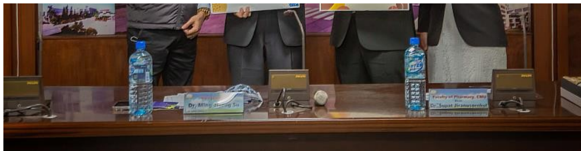
嘉藥與泰國清邁大學長久以來合作密切，2017年兩校即簽訂合作備忘錄