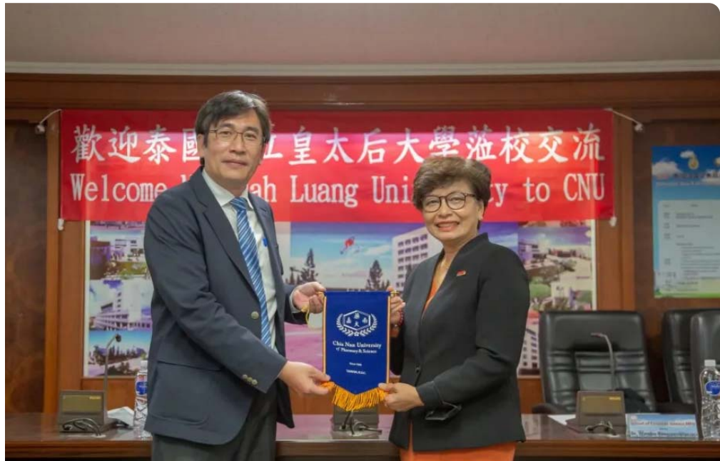
泰國知名的皇太后大學校長（右）到嘉南藥理大學進行學術交流拜會。