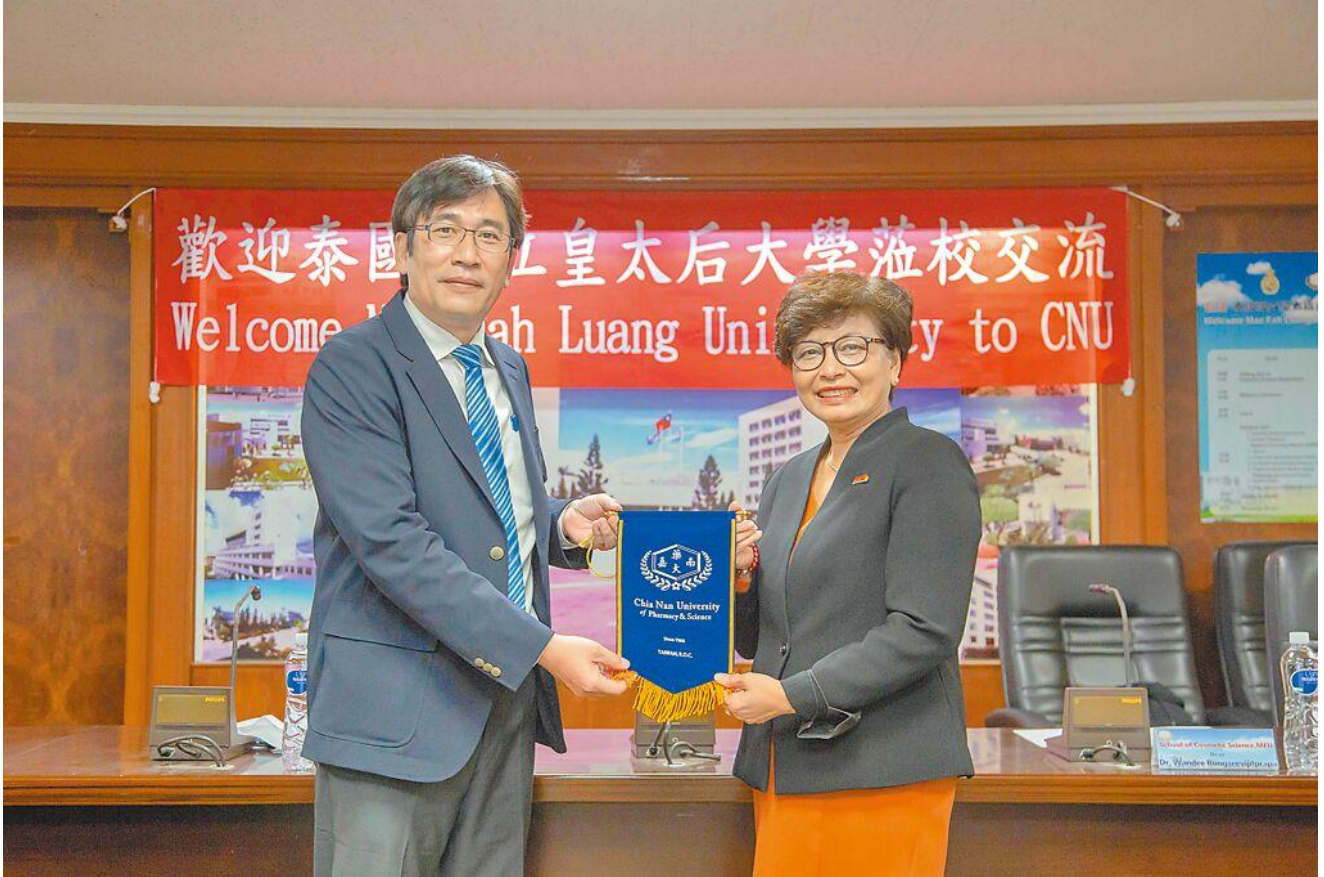
泰國皇太后大學與嘉南藥理大學進行學術交流。

在泰國富有盛名的皇太后大學，日前前往嘉南藥理大學進行學術交流拜會，並對於締結姊妹校以及簽署MOU合作備忘錄進行交換意見。