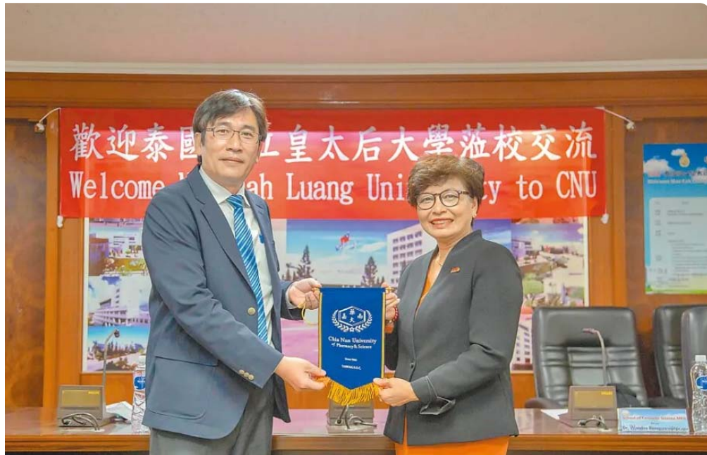
泰國皇太后大學與嘉南藥理大學進行學術交流。

在泰國富有盛名的皇太后大學，日前前往嘉南藥理大學進行學術交流拜會，並對於締結姊妹校以及簽署MOU合作備忘錄進行交換意見。