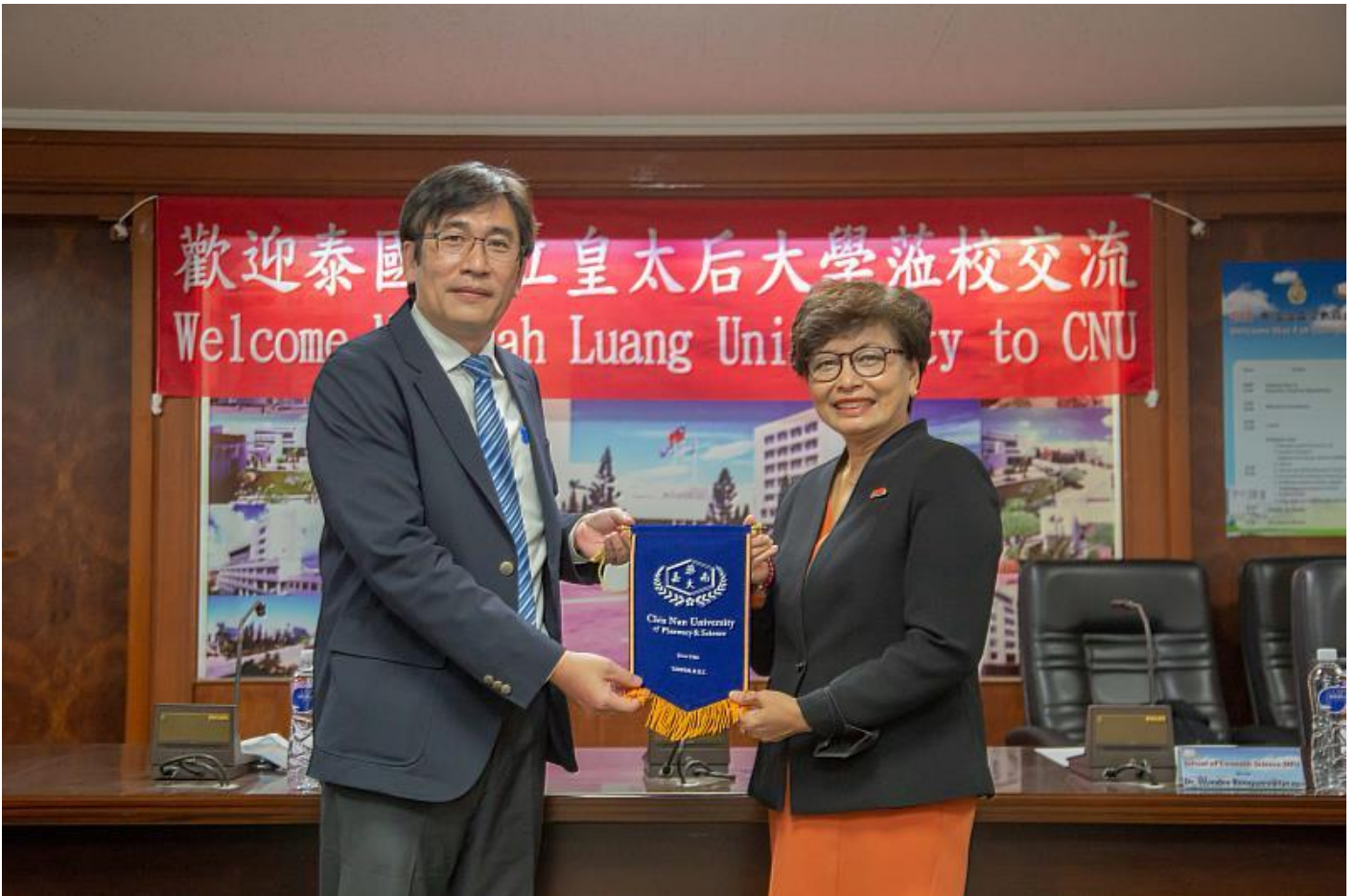
泰國皇太后大學前往嘉南藥理大學進行學術交流拜會

(中央社訊息服務20230308 09:25:26)在泰國富有盛名的皇太后大學，日前前往嘉南藥理大學進行學術交流拜會，在校長Chayaporn Wattanasiri率領下前往參觀嘉藥粧品系特色實驗室、分析檢測人才培育暨區域技術聯盟基地、和生大樓及水療館等，隨後更進一步對於締結姊妹校、簽署MOU合作備忘錄交換意見。泰國皇太后大學在國際深具學術地位，多次入選泰晤士高等教育泰國排名第一之優秀學府，此次來訪不只增進雙方了解，也開啟未來緊鑼密鼓的合作契機。