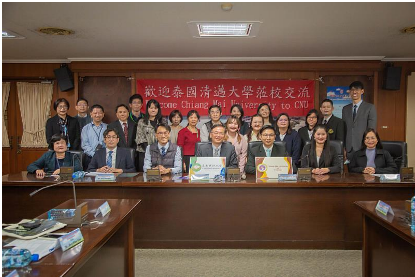
嘉藥深耕國際學術交流 海外知名學府接續來訪

學院等學術訪問團陸續到訪，顯示嘉藥推動國際學術與文化交流、活絡國際合作成效驚人。