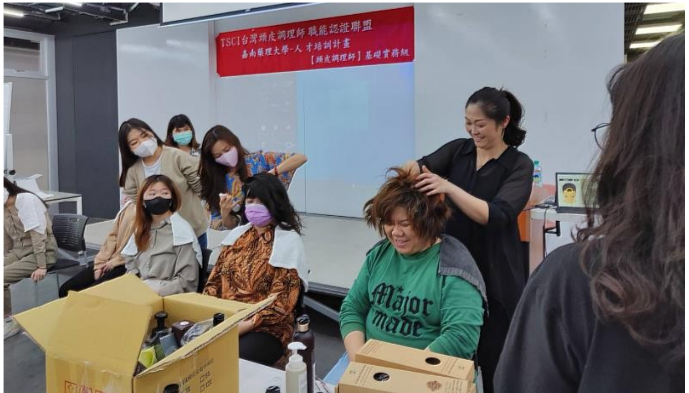
頭皮健康照護管理是未來市場新趨勢