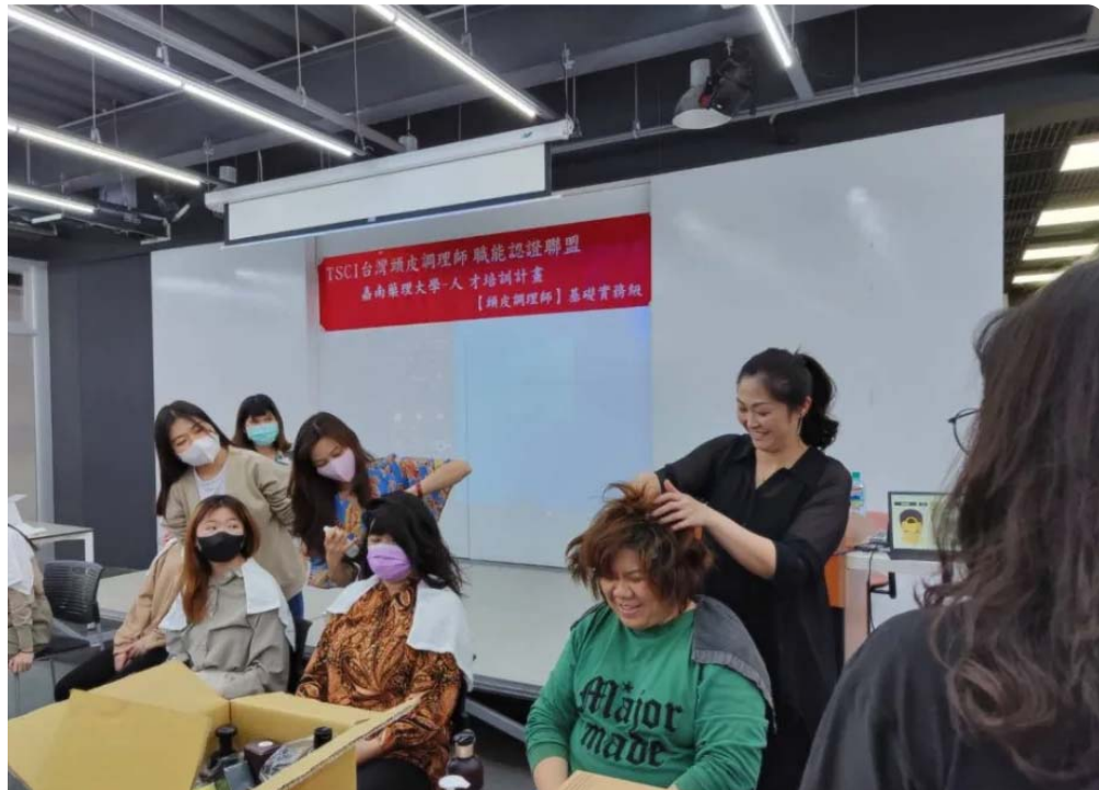
嘉藥粧品系開辦頭皮調理師實務課程。