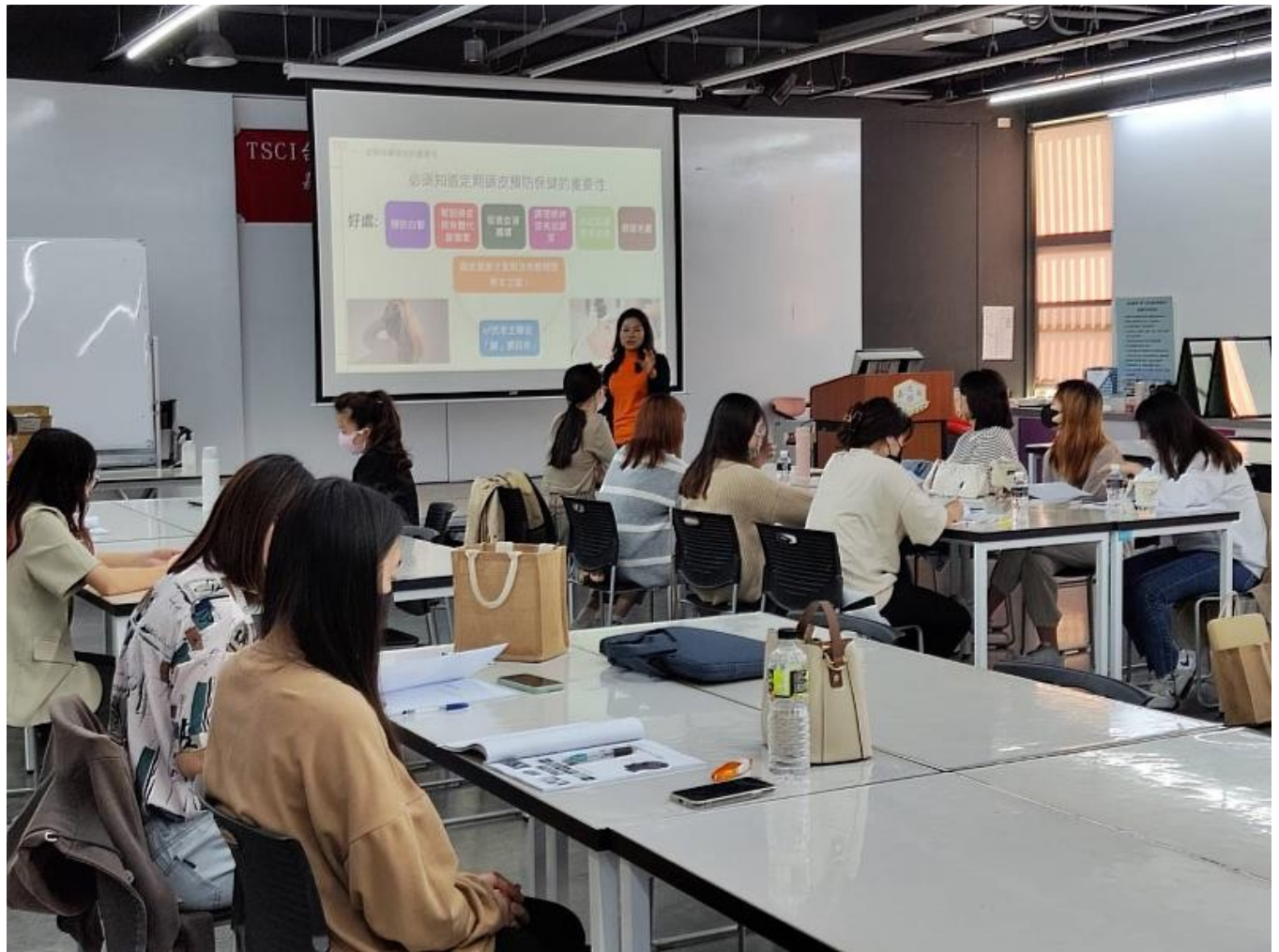
完成「頭皮調理師基礎實務級」課程並通過筆試就可以取得iCAP頭皮調理師證照