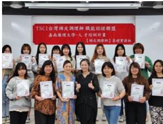
嘉藥粧品搶攻就業新藍海，辦理「頭皮調理師基礎實務級」課程。

【記者孫宜秋 / 南市報導】要美麗也要健康已經是當今美粧產業的新共識，美髮造型的同時，頭皮健康照護管理的觀念備受重視，「頭皮管理師」成為美髮產業新藍海。嘉南藥理大學化粧品應用與管理系為了讓學生具有美粧產業領先優勢，畢業後能順利銜接就業職場，日前特別邀請社團法人中華美容美髮技能協會，合作辦理「頭皮調理師基礎實務級」課程，讓學生在校就能學習市場重點發展技術，為畢業即就業做更充分的準備。