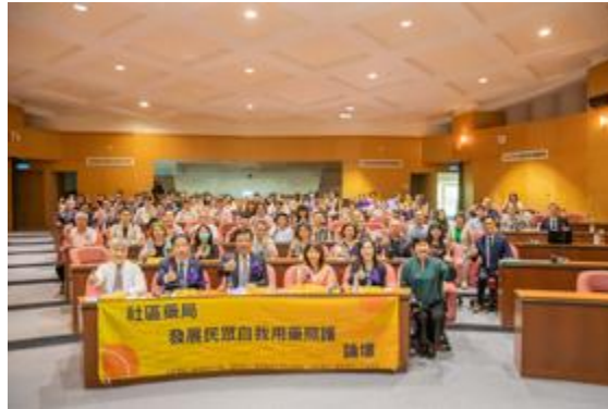
嘉南藥理大學舉辦「社區藥局發展民眾自我用藥照護論壇」。

【記者孫宜秋 / 南市報導】嘉南藥理大學3月18日舉辦「社區藥局發展民眾自我用藥照護論壇」，由校長李孫榮主持開幕，會中邀請到前中華民國藥師公會全聯會古博仁理事長、和信治癌中心醫院藥學進階教育中心陳昭姿主任、成大藥學系高雅慧教授，及英商葛蘭素史克消費保健用品（股）