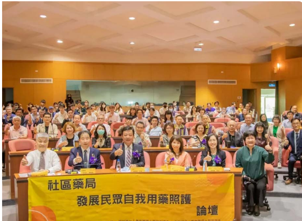
嘉南藥理大學舉辦「社區藥局發展民眾自我用藥照護論壇」。

台灣即將邁入超高齡社會，銀髮照護需求逐步增加，社區藥局是民眾最容易取得基本健康照護資訊的第一線醫療專業窗口，嘉南藥理大學舉辦「社區藥局發展及民眾自我用藥照護論壇」，希望因應未來社區藥局的急速發展，帶動民眾具備自我用藥的意識，讓第一線的社區藥局成為民眾的健康溝通平台。