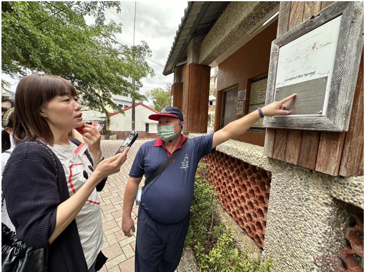
▲ 9日上午嘉南藥理大學觀光事業管理系暨溫泉產業碩士班師生特地南下屏東縣車城鄉四重溪，走訪現地進行戶外教學一日遊，了解國境之南的溫泉特色與觀光發展效益、參觀該區公共浴池。