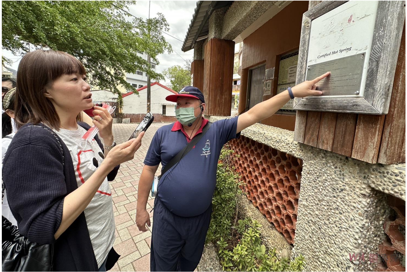
▲9日上午嘉南藥理大學觀光事業管理系暨溫泉產業碩士班師生特地南下屏東縣車城鄉四重溪，走訪現地進行戶外教學一日遊，了解國境之南的溫泉特色與觀光發展效益、參觀該區公共浴池。