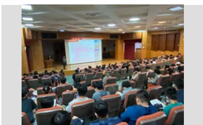
交通部觀光局跨界尋找旅宿業人才-紮根說明會