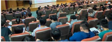
才-紮根說明會現場