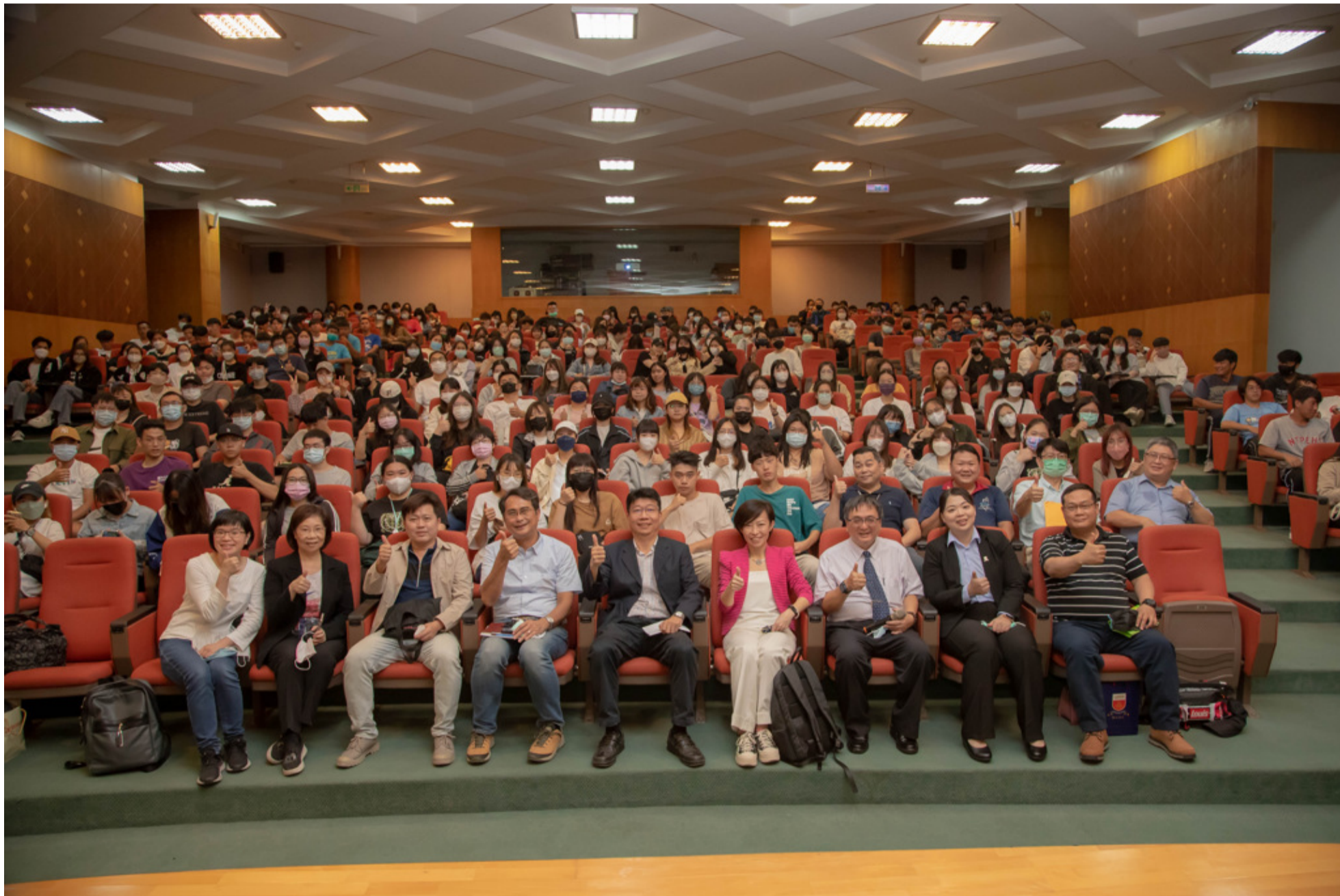
嘉藥與交通部觀光局攜手舉辦旅宿人才紮根說明會。

交通部觀光局攜手嘉南藥理大學於4月19日辦理旅宿人才紮根說明會，邀請全國知名企業，如：雲朗集團及凱撒集團，分享飯店品牌特色、職缺與相關福利說明及旅宿業成功職涯案例等，希望透過旅宿業說明會，讓非觀光相關科系的學生都能了解其未來的職涯規劃，同時也為旅宿業的徵才觸角開拓更多場域，活動當天吸引嘉藥跨學院眾多學生到場共襄盛舉，也讓與會學生對旅宿業前景及實務工作均有更深一層的認識。