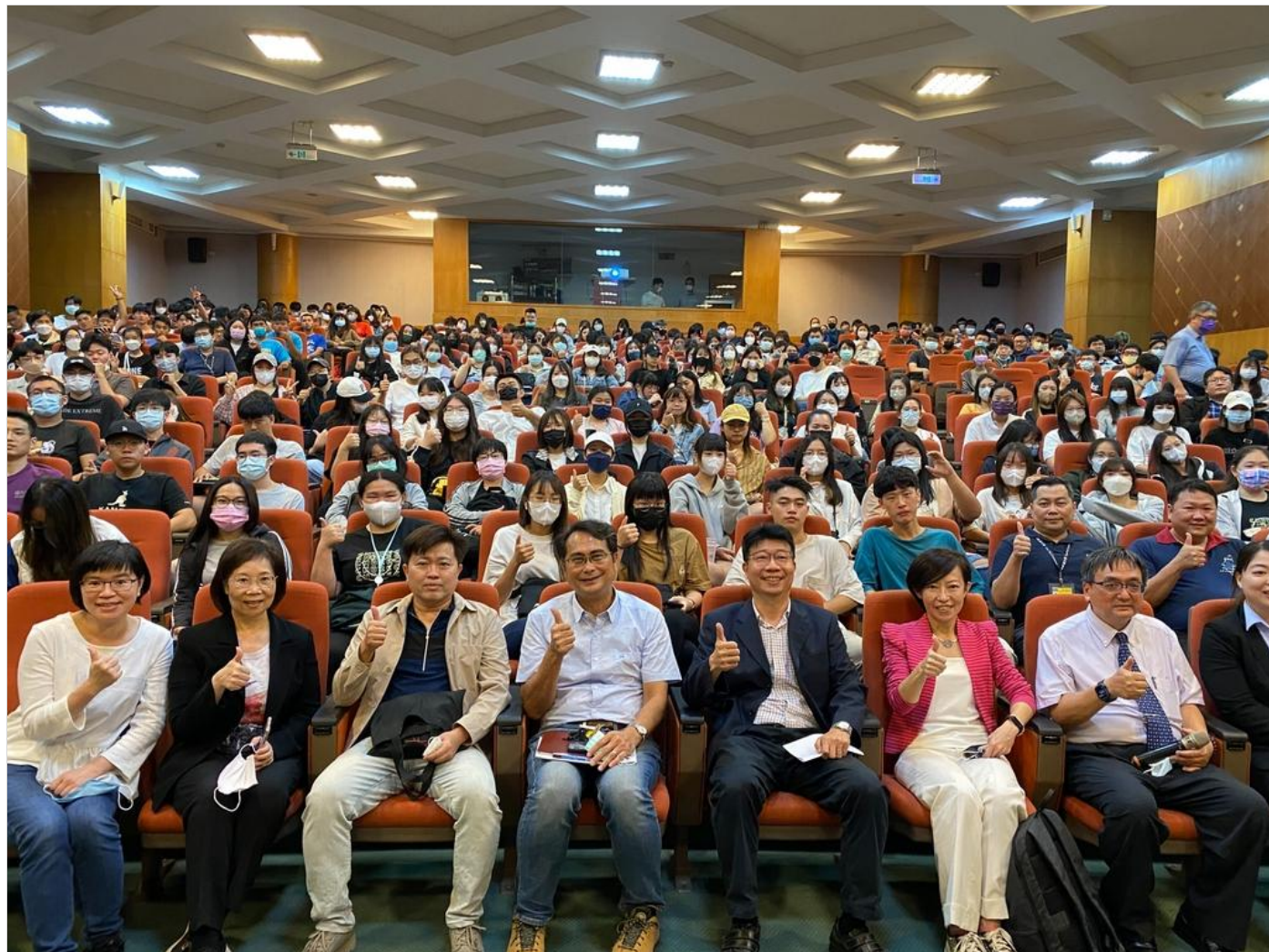
交通部觀光局跨界尋找旅宿業人才