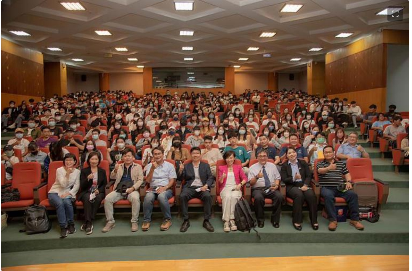
嘉藥與交通部觀光局攜手舉辦旅宿人才紮根說明會

(中央社訊息服務20230420 09:42:10)交通部觀光局攜手嘉南藥理大學於19日辦理旅宿人才紮根說明會，邀請全國知名企業，如：雲朗集團及凱撒集團，分享飯店品牌特色、職缺與相關福利說明及旅宿業成功職涯案例等，希望透過旅宿業說明會，讓非觀光相關科系的學生都能了解其未來的職涯規劃，同時也為旅宿業的徵才觸角開拓更多場域，活動當天吸引嘉藥跨學院眾多學生到場共襄盛舉，也讓與會學生對旅宿業前景及實務工作均有更深一層的認識。