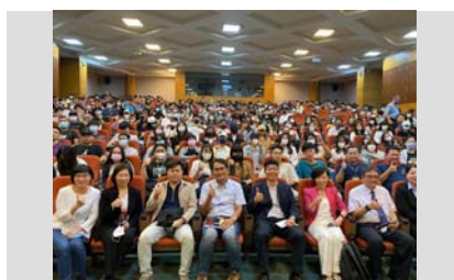
交通部觀光局跨界尋找旅宿業人才-紮根說明會