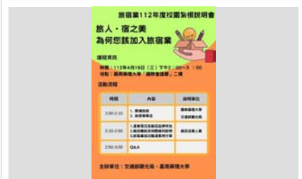
交通部觀光局跨界尋找旅宿業人才-紮根說明會