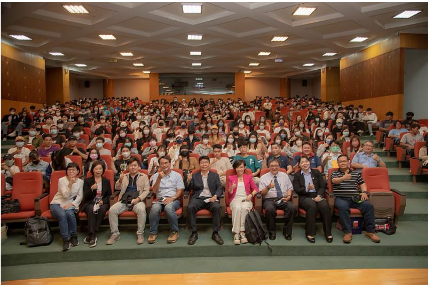
嘉藥與交通部觀光局攜手舉辦旅宿人才紮根說明會

(中央社訊息服務20230420 09:42:10)交通部觀光局攜手嘉南藥理大學於19日辦理旅宿人才紮根說明會，邀請全國知名企業，如：雲朗集團及凱撒集團，分享飯店品牌特色、職缺與相關福利說明及旅宿業成功職涯案例等，希望透過旅宿業說明會，讓非觀光相關科系的學生都能了解其未來的職涯規劃，同時也為旅宿業的徵才觸角開拓更多場域，活動當天吸引嘉藥跨學院眾多學生到場共襄盛舉，也讓與會學生對旅宿業前景及實務工作均有更深一層的認識。