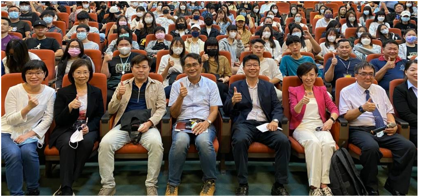
交通部觀光局跨界尋找旅宿業人才