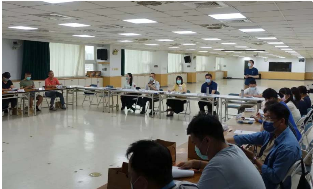
為促進青少年就業，市府勞工局邀集台南各高中職學校座談，說明青少年打工或尋職應注意的勞動權益與職安事項。