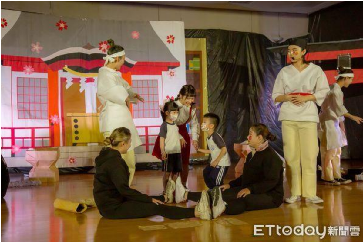
▲嘉南藥理大學嬰幼兒保育系於27日在該校演藝廳，演出兒童戲劇「睡夢仙境」為112級畢業成果展拉開序幕。