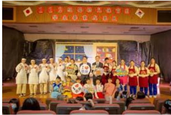
嘉藥幼保育舉辦112級畢業成果展兒童戲劇「睡夢仙境」。

【記者孫宜秋 / 南市報導】嘉南藥理大學嬰幼兒保育系於27日在該校演藝廳演出兒童戲劇「睡夢仙境」為112級畢業成果展拉開序幕，演出當天特別邀請超過300位幼兒園小朋友，透過場景中的異國旅行，一起搭乘太空船體驗「腦筋急轉彎」的挑戰，進而認識、學習如何與喜、怒、哀、樂等情