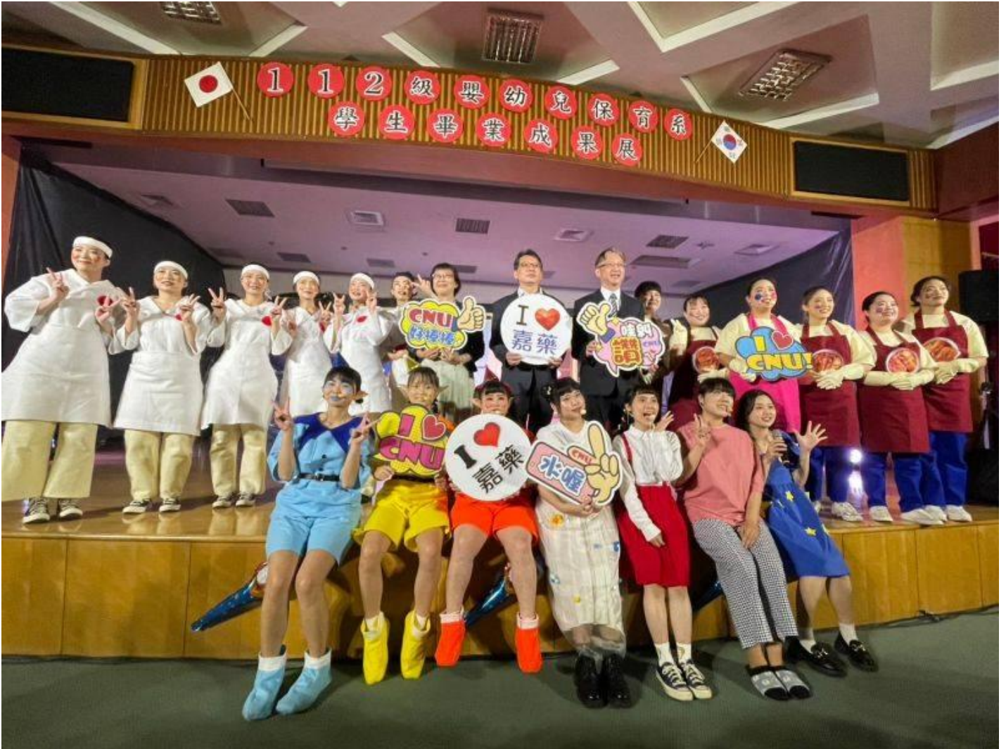
▲嘉南藥理大學幼保系「睡夢仙境」畢業成果展演出團隊合照（2023,04,27）

現學生作為「準教保人才」的專業知識與健康活力。參與的同學表示，此次畢業公演結合在校4年所學，同學們利用實習之餘抓緊時間討論、排練及製作道具，一開始大家都沒經驗，難免生澀怯場，但為了達到最好的表現，到後來索性甩開偶包、放飛自我、全心投入。過程中全班同學分工合作，聯絡配合廠商、協調場佈時間，從中學習成長不少，也藉機檢視自己遇到負面情緒產生時，或遇到問題需解決時的方法與態度。