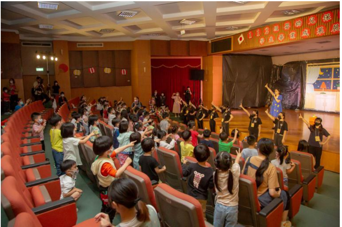
▲ 台下孩童手舞足蹈一起同樂。