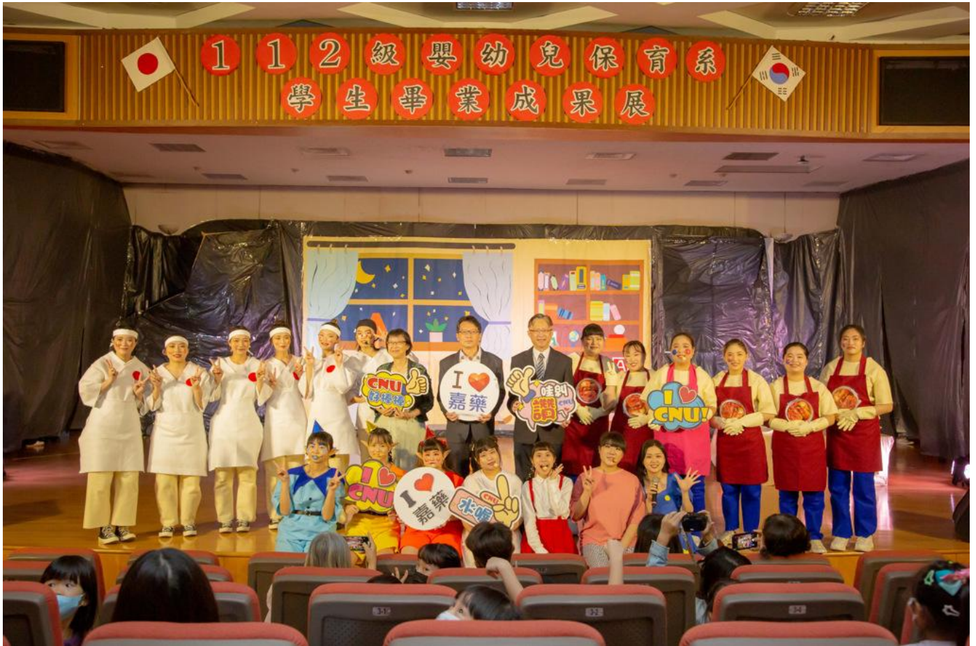
嘉藥幼保育舉辦112級畢業成果展兒童戲劇「睡夢仙境」。

嘉南藥理大學嬰幼兒保育系於今(27)日在該校演藝廳演出兒童戲劇「睡夢仙境」，為112級畢業成果展拉開序幕，演出當天特別邀請超過300位幼兒園小朋友，透過場景中的異國旅行，一起搭乘太空船體驗「腦筋急轉彎」的挑戰，進而認識並學習如何與喜、怒、哀、樂等情緒和平相處。而該系即將畢業的學生也在籌備畢業展的過程中，認識到團隊合作與正向思考的重要性，讓整場演出更具有教學相長的意義。