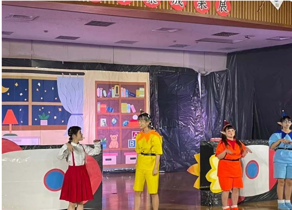
▲小蘋與3位精靈一同搭乘太空船展開冒險旅行 (圖 / 記者林怡孜攝 · 2023,04,27)

[NOWnews今日新聞]嘉南藥理大學嬰幼兒保育系於今(27)日假該校演藝廳演出兒童戲劇「睡夢仙境」畢業成果展，邀請了300多位幼兒園小朋友前來欣賞。台下小朋友跟著劇中主角「小蘋」一起搭乘太空船展開冒險，進而學習如何與喜、怒、哀、樂等情緒和平相處，演出活潑精彩，小朋友們看得相當投入，笑聲不斷。