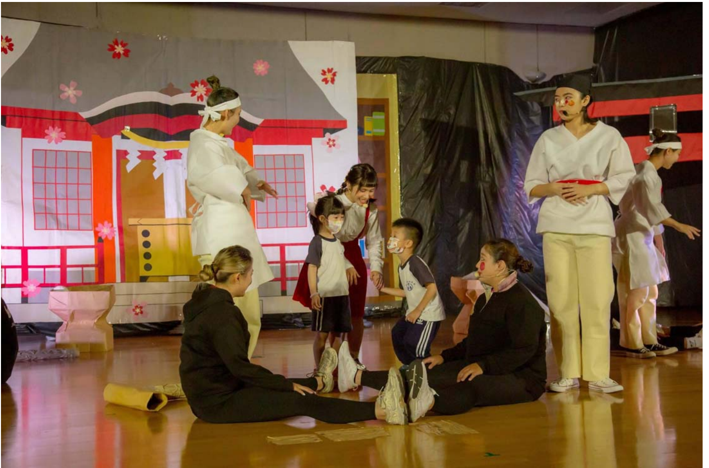
圖說：幼兒園小朋友開心上台與劇中人物互動。

代理校長張翊峰指出，這次兒童戲劇展演，幼保系學生們使用小朋友的語言、角度與想法，設計出符合幼童能理解且有趣的戲劇內容，充分展現創意與專業的素養，也為在校所學繳出漂亮的成績單；期望學生們透過這次畢展演出經驗，未來在幼兒教學職場能發揮更多靈感，延伸出更多元豐富的教學內容，使幼兒教育得以更加繽紛有趣。