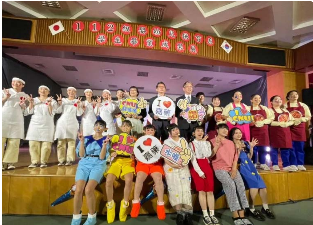
▲嘉南藥理大學幼保系「睡夢仙境」畢業成果展演出團隊合照（圖 / 記者林怡孜攝，2023,04,27）

代理校長張翊峰指出，這次兒童戲劇展演，幼保系學生們使用小朋友的語言、角度與想法，設計出符合幼童能理解且有趣的戲劇內容，充分展現創意與專業的素養，也為在校所學繳出漂亮的成績單；期望學生們透過這次畢展演出經驗，未來在幼兒教學職場能發揮更多靈感，延伸出更多元豐富的教學內容，使幼兒教育得以更加繽紛有趣。