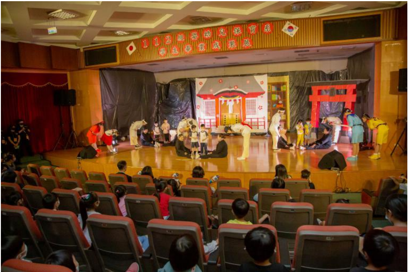
▲嘉藥幼保系畢業公演精采絕倫吸引孩童目光。

該校代理校長張翊峰指出，這次兒童戲劇展演，幼保系學生們使用小朋友的語言、角度與想法，設計出符合幼童能理解且有趣的戲劇內容，充分展現創意與專業的素養，也為在校所學繳出漂亮的成績單；期望學生們透過這次畢展演出經驗，未來在幼兒教學職場能發揮更多靈感，延伸出更多元豐富的教學內容，使幼兒教育得以更加繽紛有趣。