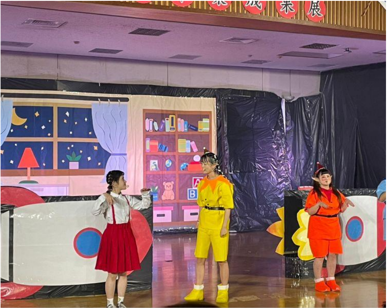
▲小蘋與3位精靈一同搭乘太空船展開冒險旅行 (圖 / 記者林怡孜攝，2023,04,27)