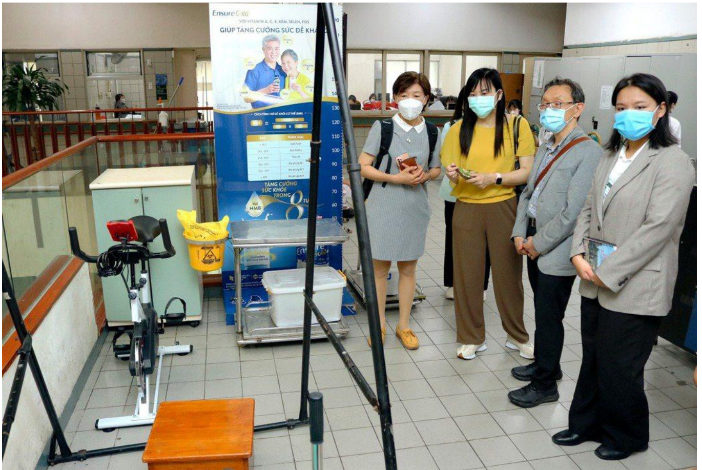
參訪越南最大老人養護中心的設備。