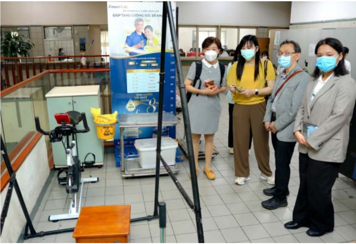
參訪越南最大老人養護中心的設備。

河內公衛大學是越南國內第一所培養公共衛生領域人才的大學，也是醫學和藥學領域第一所擁有符合東南亞大學認證標準 (AUN-QA) 培訓計劃的大學，此次雙方分享培養醫務社會工作知能專業人才經驗，也對健康醫療體系進行意見交流，期待藉由台越雙方的經驗分享，對社會工作、高齡照護及醫療健康管理等領域帶來更多教學、研究的實務推展的機會。