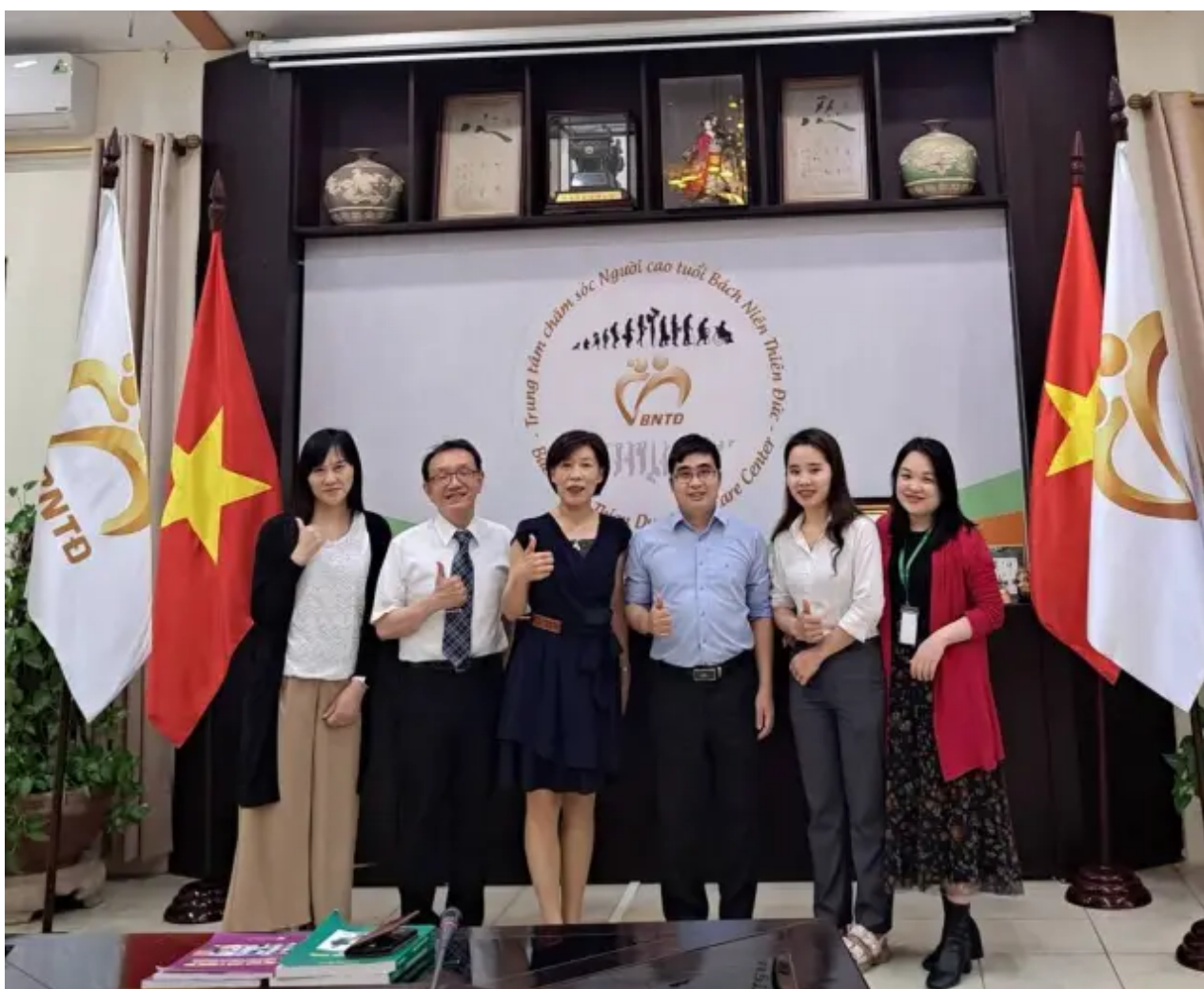
（圖說）嘉藥高福、社工及醫管系前往河內公衛大學洽談實質合作與短期課程事宜。

嘉藥表示，嘉藥擁有豐富的國際化資源，締結超過255所國際姊妹校，日本是高齡化的國家，長期照顧模式是國際推崇學習的對象，疫情解封後高福系透過教育部學海築夢計畫於今年暑假將協助3位同學至日本愛知縣長照機構實習，社工系也預計於日本沖繩異文化交流中心共擬見學計畫，培養學生語言能力的同時，給予學生國際文化交流及長照機構實務服務的機會，透過多重管道的建構，累積學生多元國際視野，實踐邁向「全人健康服務」的終極教育目標。