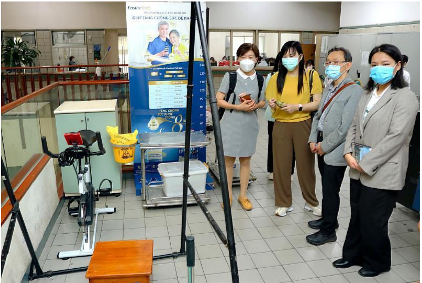
參訪越南最大老人養護中心的設備

河內公衛大學是越南國內第一所培養公共衛生領域人才的大學，也是醫學和藥學領域第一所擁有符合東南亞大學認證標準（AUN-QA）培訓計劃的大學，此次雙方分享培養醫務社會工作知能專業人才經驗，也對健康醫療體系進行意見交流，期待藉由台越雙方的經驗分享，對社會工作、高齡照護及醫療健康管理等領域帶來更多教學、研究的實務推展的機會。