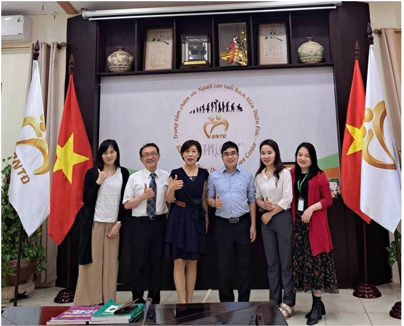
嘉藥高福、社工及醫管系前往河內公衛大學洽談實質合作與短期課程事宜。