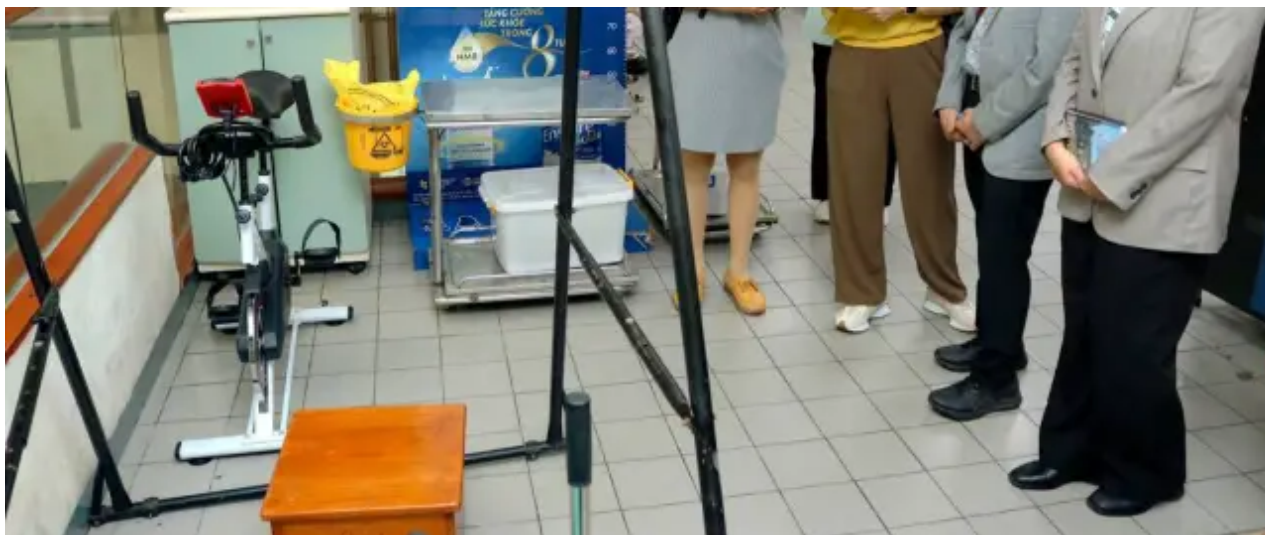
（圖說）嘉藥高福系參訪越南最大老人養護中心的設備。（記者鄭德政攝）

嘉藥表示，嘉藥擁有豐富的國際化資源，締結超過255所國際姊妹校，日本是高齡化的國家，長期照顧模式是國際推崇學習的對象，疫情解封後高福系透過教育部學海築夢計畫於今年暑假將協助3位同學至日本愛知縣長照機構實習，社工系也預計於日本沖繩異文化交流中心共擬見學計畫，培養學生語言能力的同時，給予學生國際文化交流及長照機構實務服務的機會，透過多重管道的建構，累積學生多元國際視野，實踐邁向「全人健康服務」的終極教育目標。