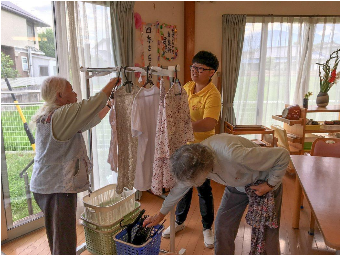
高福系學生在日幫忙長者生活自理。