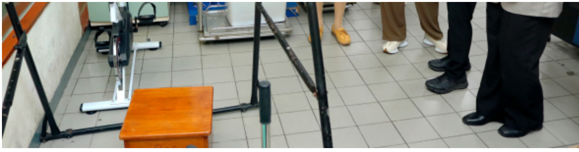
參訪越南最大老人養護中心的設備。

河內公衛大學是越南國內第一所培養公共衛生領域人才的大學，也是醫學和藥學領域第一所擁有符合東南亞大學認證標準（AUN-QA）培訓計劃的大學，此次雙方分享培養醫務社會工作知能專業人才經驗，也對健康醫療體系進行意見交流，期待藉由台越雙方的經驗分享，對社會工作、高齡照護及醫療健康管理等領域帶來更多教學、研究的實務推展的機會。