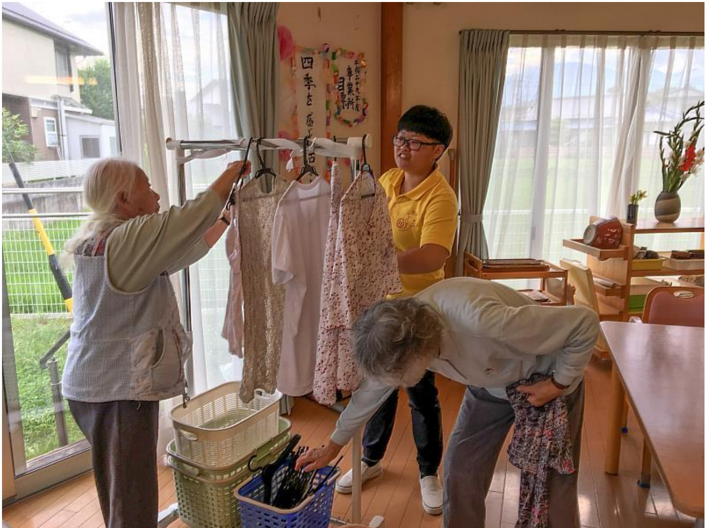
高福系學生在日幫忙長者生活自理

異文化交流中心共擬見學計畫，培養學生語言能力的同時，給予學生國際文化交流及長照機構實務服務的機會，透過多重管道的建構，累積學生多元國際視野，實踐邁向「全人健康服務」的終極教育目標。