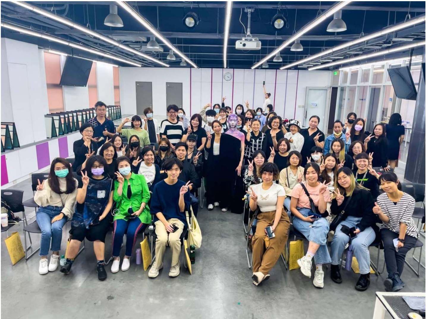
圖說：嘉藥粧品攜手美妝頂尖企業舉辦特效、彩粧創意造型營。

【記者黃鐘毅 / 台南報導】嘉南藥理大學日前辦理「MAKE UP FOR EVER 彩妝造型經驗交流會」及「影視特效 彩粧創意造型」高中職教師研習課程，透過與美妝產業頂尖企業的合作掌握市場脈動，同時快速瞭解目前最新最夯的新知與技巧，研習課程特別邀請TTC彩繪工作室陳姿婷老師授課分享，吸引全台包含遠從花蓮、台東、宜蘭等地近80位的教師參與。