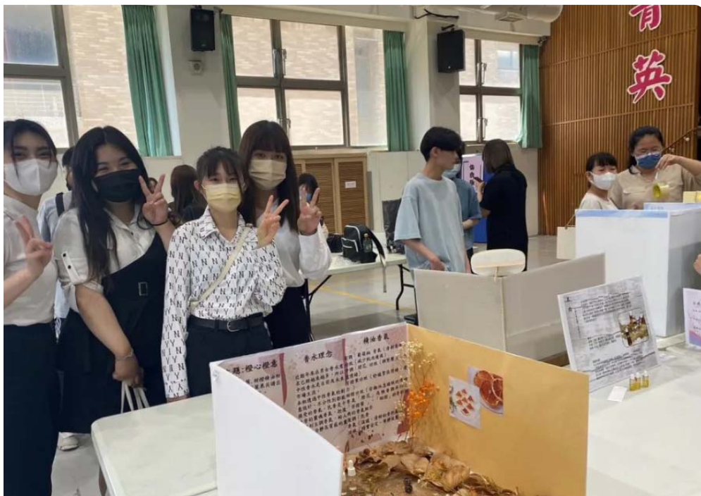
嘉藥粧品系「橙心橙意」中性調精油香水獲得銅牌獎。(校方提供)