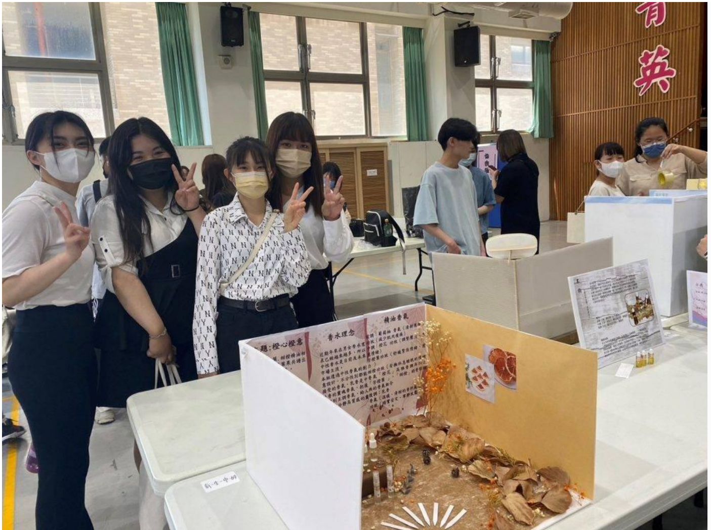
嘉藥粧品系「橙心橙意」中性調精油香水獲得銅牌獎。