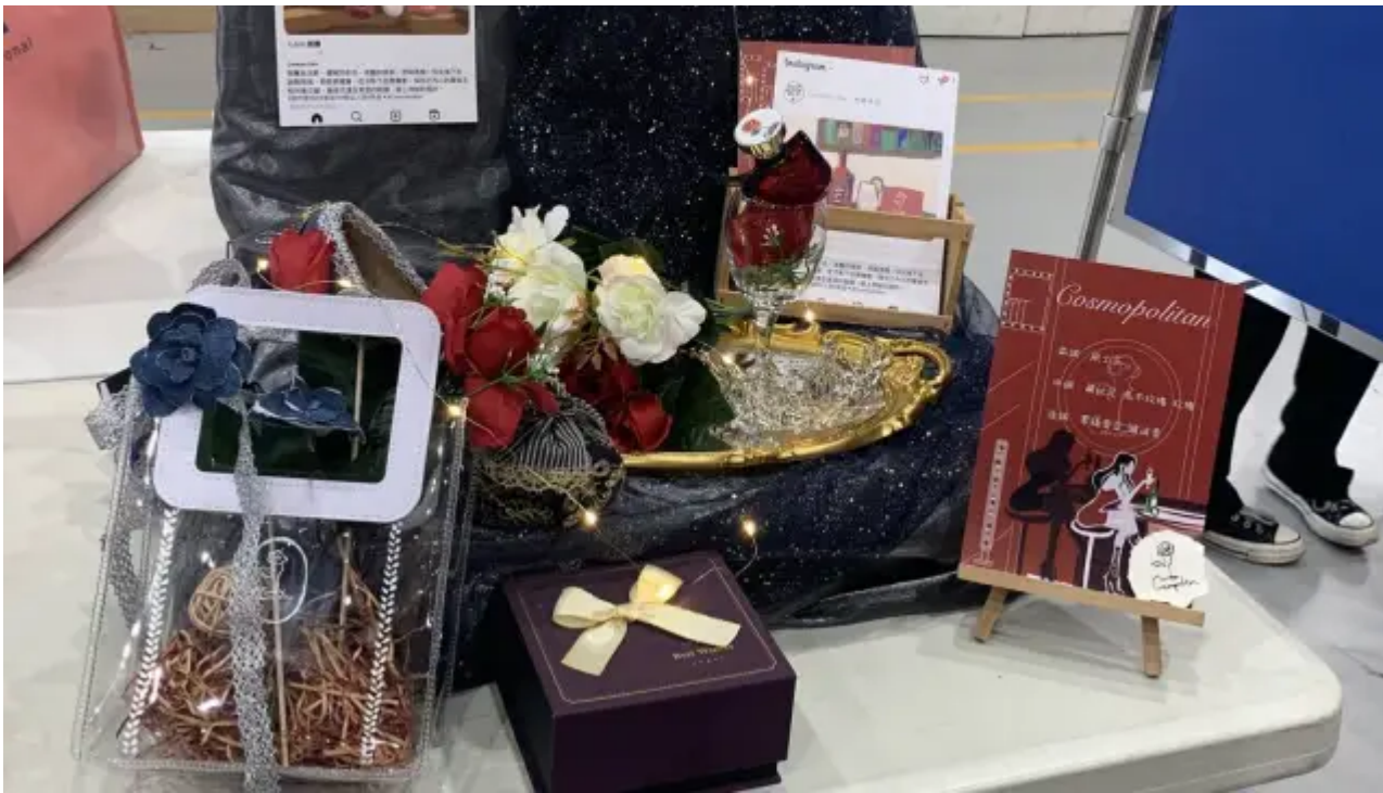
(圖說)「橙心橙意」中性調精油香水喜獲銅牌。

得獎同學表示，初次參加精油調香比賽就能獲獎，自己因此擁有了滿滿成就感，參賽過程中從主題設定、香氣選擇、香水故事、情境佈置、香瓶選擇來完成整體設計風格，把學校所學的主題、包裝、調性等調香知識融合發揮，更是收穫滿滿，藉由此次競賽也了解到不同風格的調香作品，不只對調香更加認識，也確定自己畢業後的就業方向。