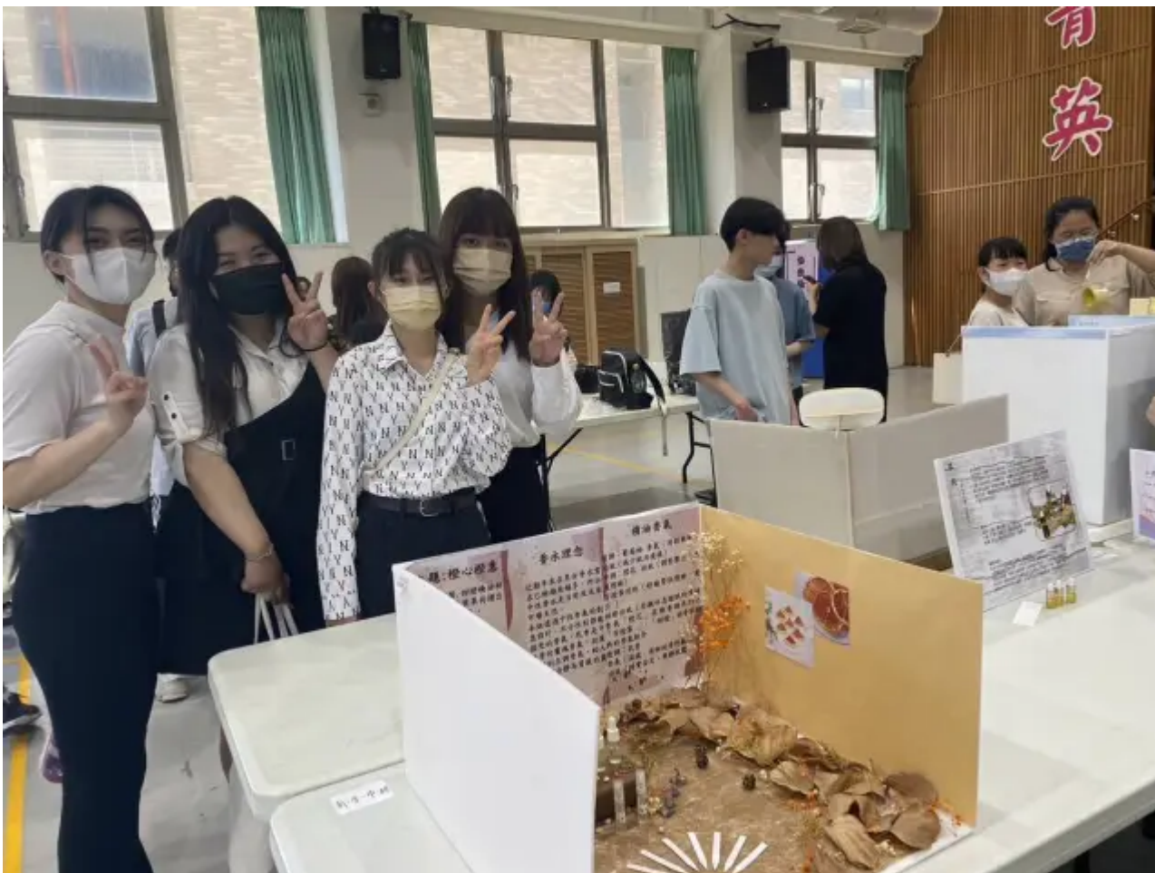
(圖說)獲得及「最佳人氣獎」的「柯夢波丹(cosmopolitan)香水」。

得獎同學表示，初次參加精油調香比賽就能獲獎，自己因此擁有了滿滿成就感，參賽過程中從主題設定、香氣選擇、香水故事、情境佈置、香瓶選擇來完成整體設計風格，把學校所學的主題、包裝、調性等調香知識融合發揮，更是收穫滿滿，藉由此次競賽也了解到不同風格的調香作品，不只對調香更加認識，也確定自己畢業後的就業方向。