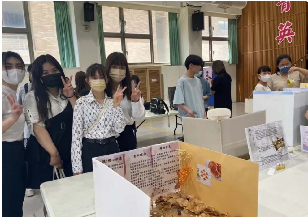
嘉藥粧品系「橙心橙意」中性調精油香水獲得銅牌獎。