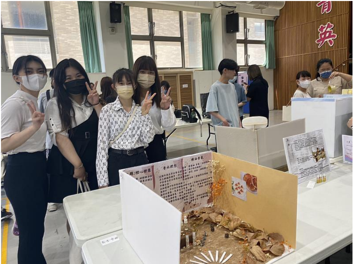
「橙心橙意」中性調精油香水喜獲銅牌

調香藝術是針對香味進行調配與研發，融合調性及香味，調出具有獨特前調、中調、後調的調香作品，而出色的調香師則需要擁有靈敏的嗅覺、好的觀察力、豐富表達能力及專業知識，才能調出獨特的香氛作品，嘉藥粧品系在基本化學相關知識外，加入調香相關課程，指導學生加強嗅覺敏銳度及香氣辨識，累積調香實力，才能在競賽調出有獨特潛力的香氣作品。