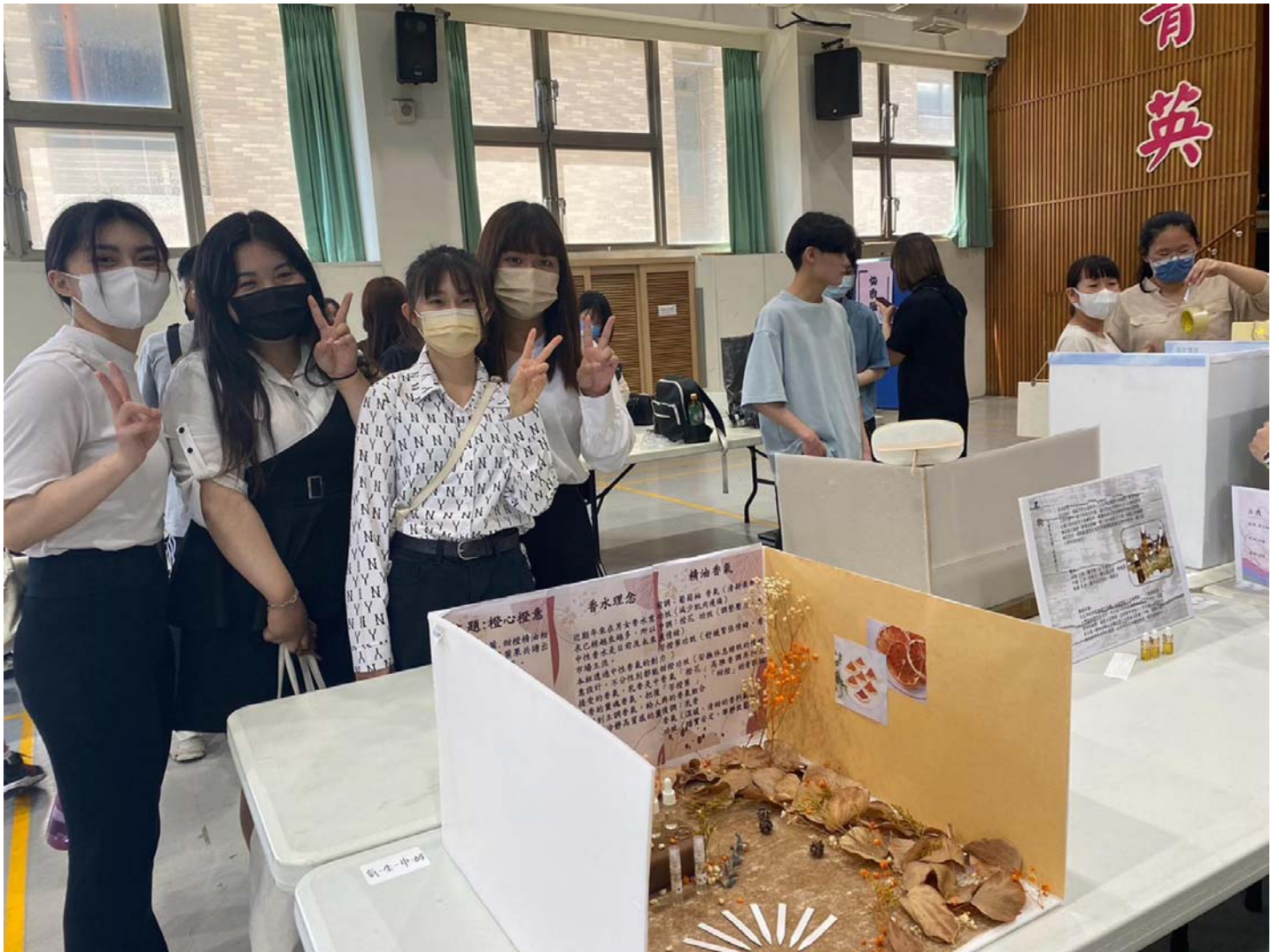
圖說：嘉藥「橙心橙意」中性調精油香水喜獲銅牌。（記者黃鐘毅 / 翻攝）

指導老師劉孟春及林美惠表示，以調香藝術是針對香味進行調配與研發，融合調性及香味，調出具有獨特前調、中調、後調的調香作品，而出色的調香師則需要擁有靈敏的嗅覺、好的觀察力、豐富表達能力及專業知識，才能調出獨特的香氛作品，粧品系在基本化學相關知識外，加入調香相關課程，指導學生加強嗅覺敏銳度及香氣辯識，累積調香實力，才能在競賽調出有獨特潛力的香氣作品。