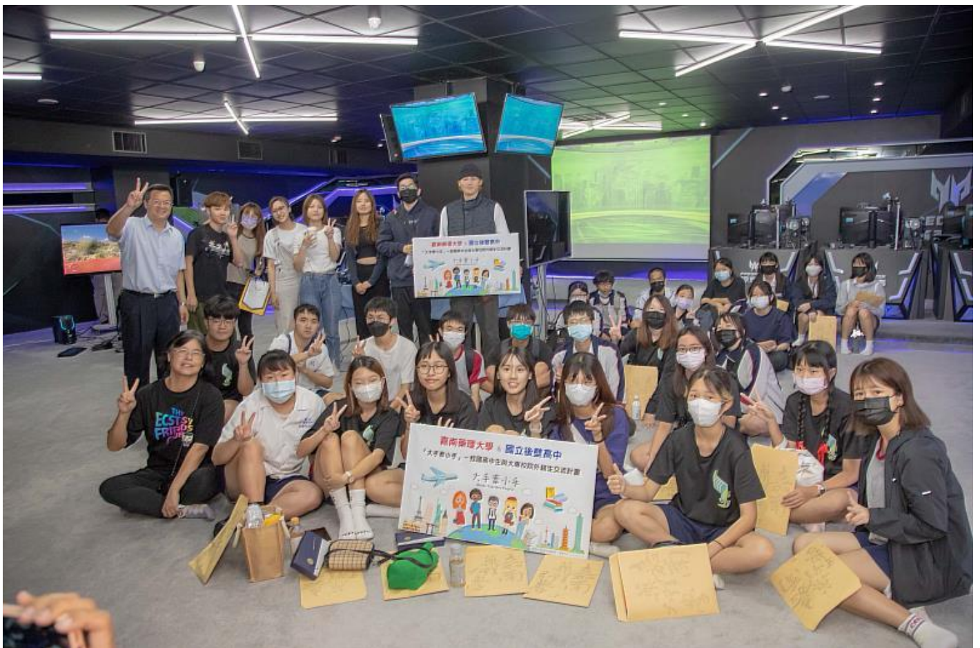
嘉藥攜手後壁高中舉辦「大手牽小手」一日大學生體驗活動

為了提升青年學生全球移動力，教育部自105年起陸續推動「大手牽小手 - 我國高中生與大專院校外籍生交流計畫」，希望透過鼓勵國內大專院校外籍學生與高級中等學校同學間的交流，增加高中學生的國際交流經驗與國際視野及促進語言與文化交流。