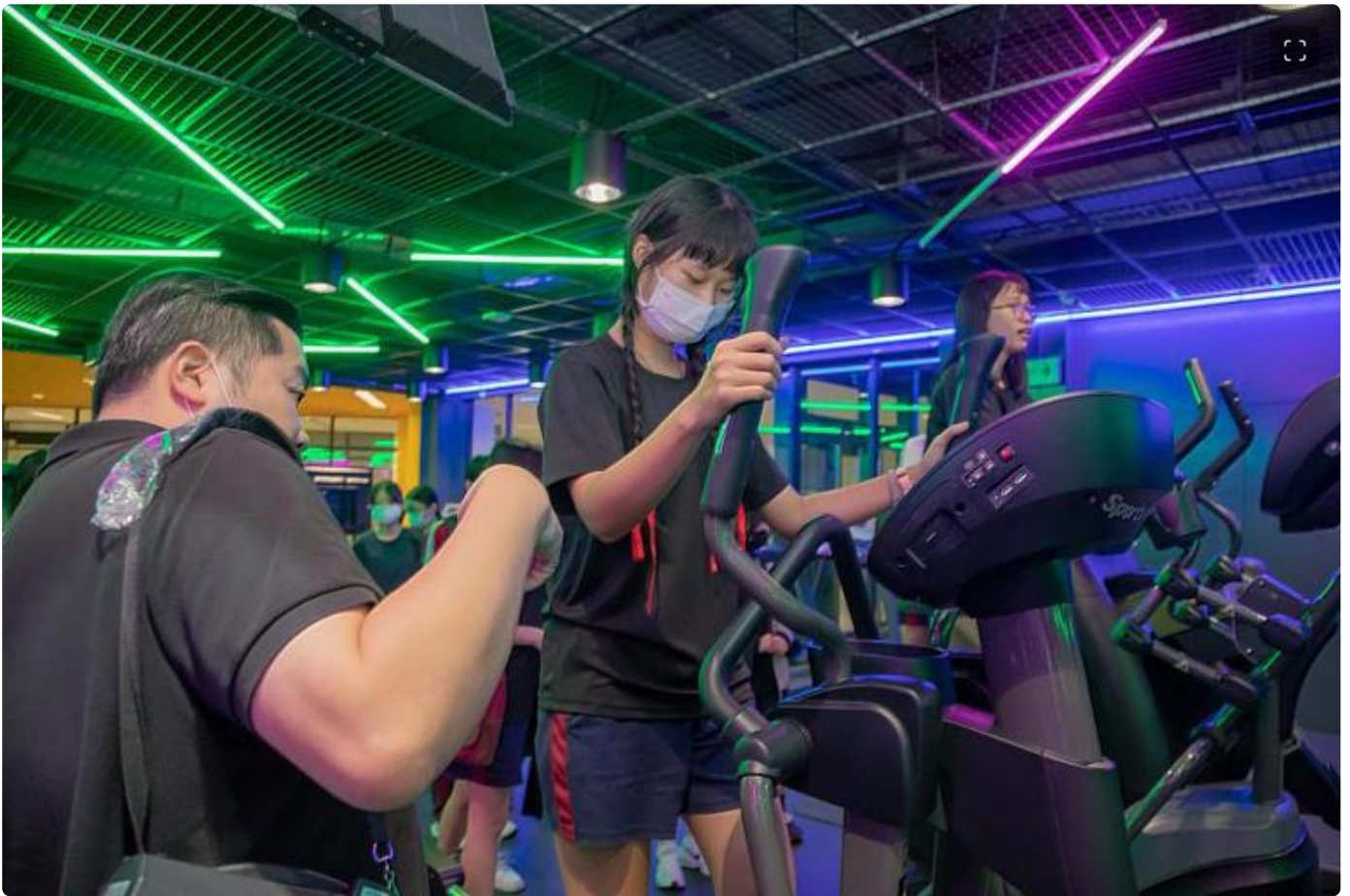
嘉藥休閒系老師指導高中生如何正確使用健身器材