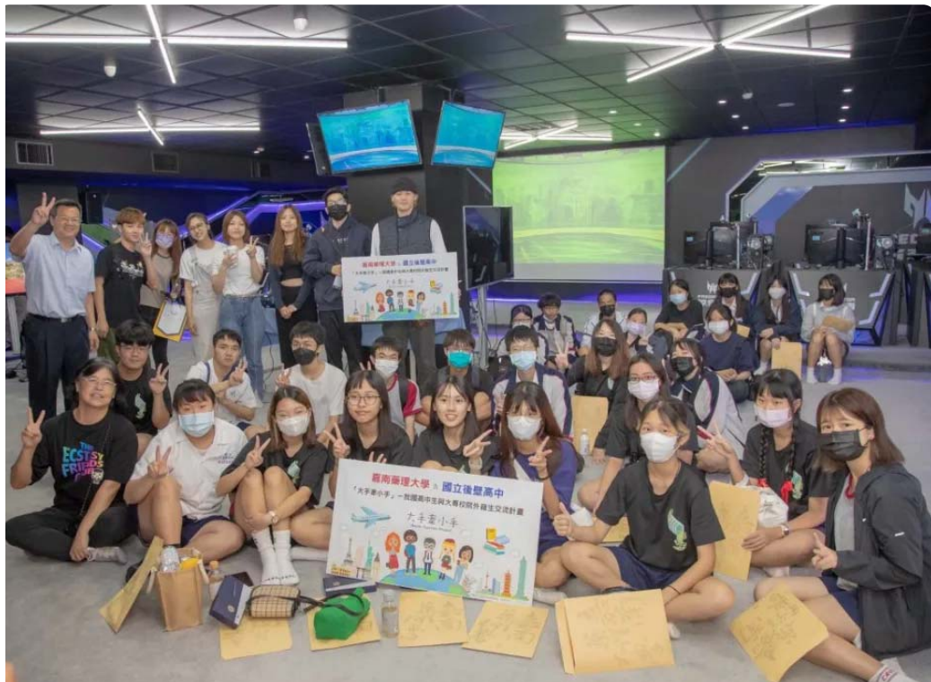
嘉藥攜手後壁高中舉辦「大手牽小手」一日大學生體驗活動。