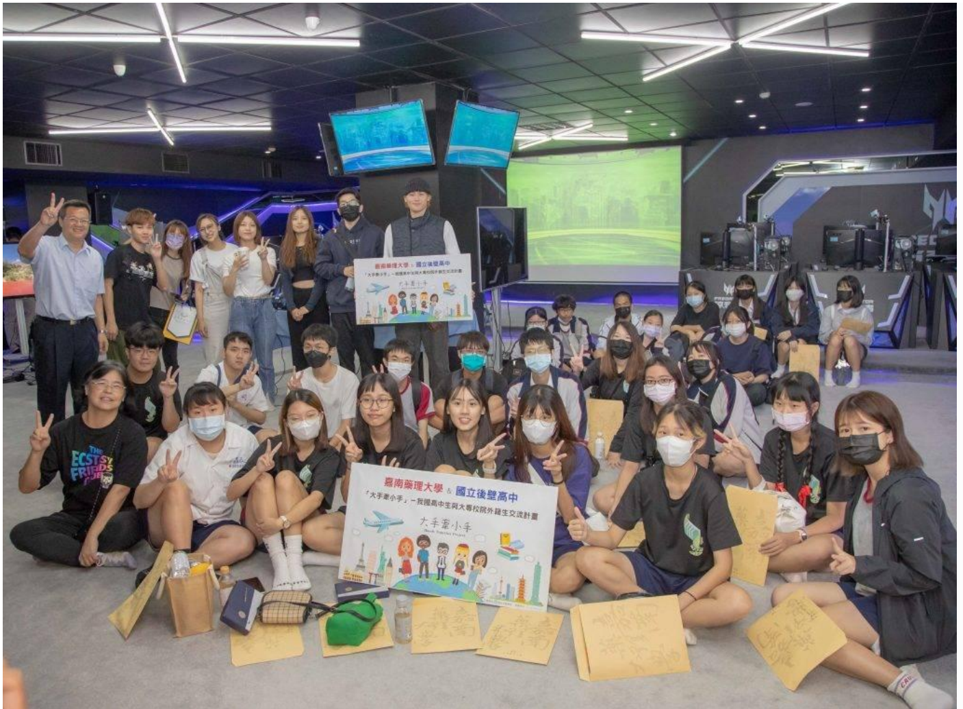
嘉藥攜手後壁高中舉辦「大手牽小手」一日大學生體驗活動。(記者黃文記攝)