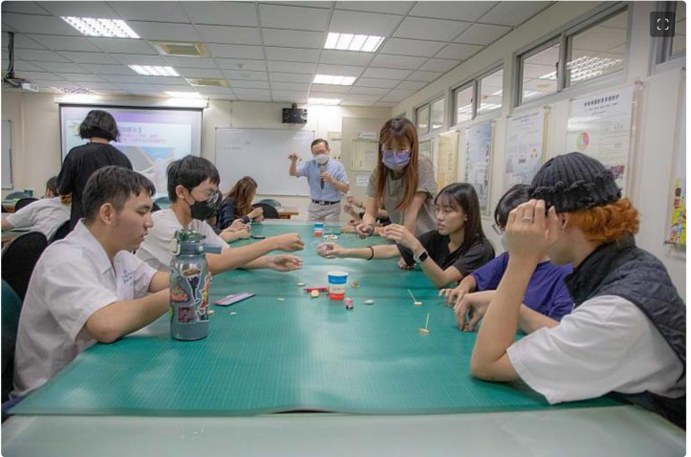
嘉藥休閒系老師教學生「認識人體重要穴位」利用家中薑蒜片做蒜薑灸

動態課程更是精彩，嘉藥五星級健身中心更是讓從未去過健身房的高中學生大開眼界，除了體驗專業健身器材外，老師現場示範正確使用方式並引導同學進行體適能檢測，同學能依照自己的體能狀態來選用適合的設施；讓學生從實際操作中，跳脫運動的枯燥感，體驗健身的樂趣。電競遊戲體驗是國際大哥哥、姐姐與高中學生的共同語言，在嘉藥電競黑洞裡，由多媒體系學生指導與協助，讓高中生實際操作大螢幕電玩、VR情境體驗、直播主攝影棚及電競座艙等遊戲，氣氛歡樂又刺激，透過遊戲互動讓在地高中學生以多元學習模式，瞭解語言溝通的重要性，搭起國際友誼橋樑。