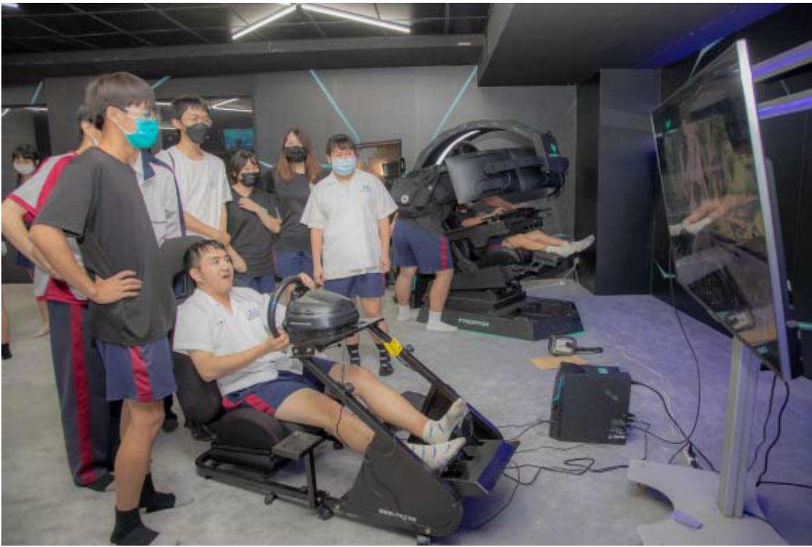
嘉藥電競黑洞有著先進豐富的電玩設備。

動態課程更是精彩，嘉藥五星級健身中心更是讓從未去過健身房的高中學生大開眼界，除了體驗專業健身器材外，老師現場示範正確使用方式並引導同學進行體適能檢測，同學能依照自己的體能狀態來選用適合的設施；讓學生從實際操作中，跳脫運動的枯燥感，體驗健身的樂趣。