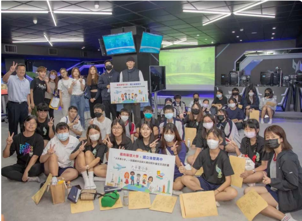
嘉藥攜手後壁高中舉辦「大手牽小手」一日大學生體驗活動。