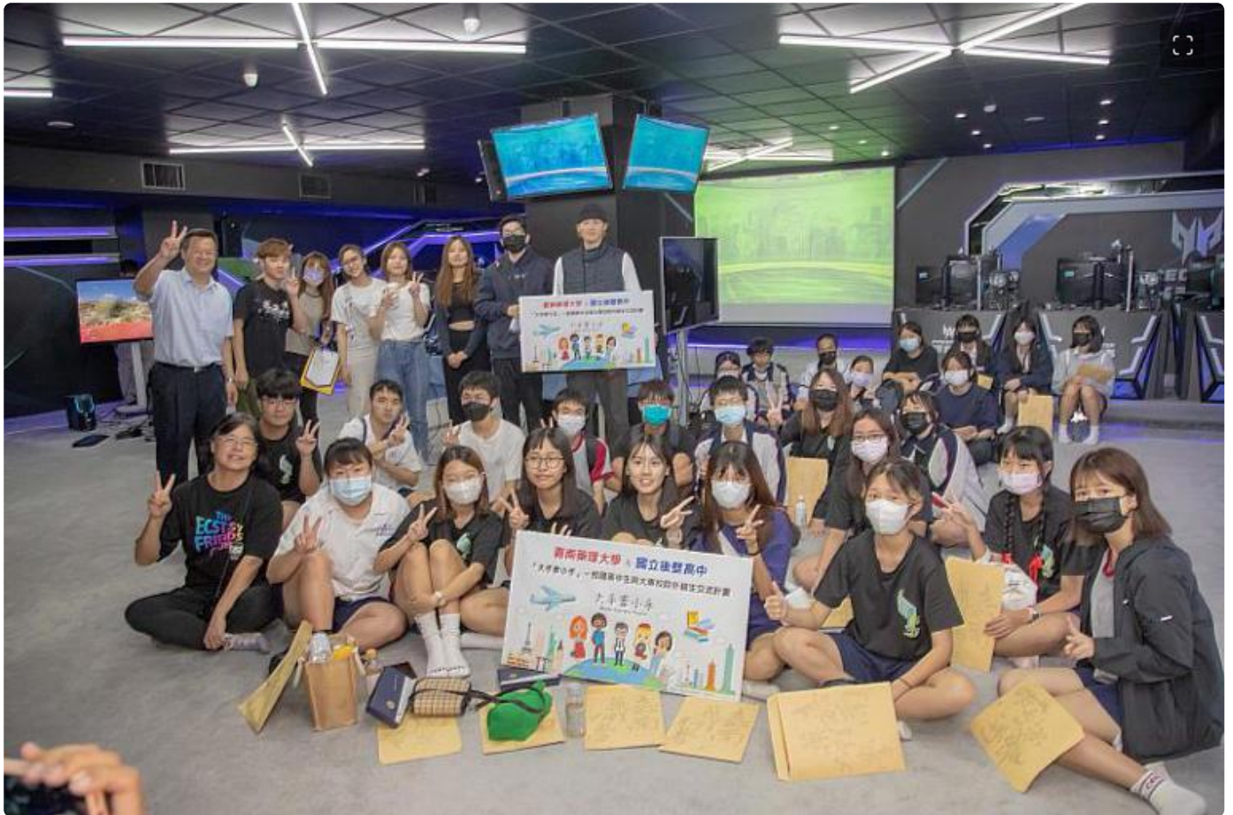
嘉藥攜手後壁高中舉辦「大手牽小手」一日大學生體驗活動

為了提升青年學生全球移動力，教育部自105年起陸續推動「大手牽小手 - 我國高中生與大專院校外籍生交流計畫」，希望透過鼓勵國內大專院校外籍學生與高級中等學校同學間的交流，增加高中學生的國際交流經驗與國際視野及促進語言與文化交流。